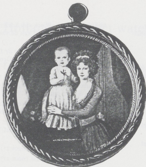
Afb. 13. Pierre Le Sage, ges., ca. 1794. Wilhelmina van Pruisen met haar zoontje Willem, de latere Koning Willem II. Miniatuur, ivoor, rond. Coll.: 1981 Duitse kunsthandel.

geen groot kunstenaar, maar hij wist aantrekkelijk werk af te leveren, waarmee hij zijn voorname cliëntèle voor een periode van meer dan dertig jaar aan zich kon binden. Het is daarom verheugend, dat er nu wat meer bekend is geworden over zijn persoon en zijn werk.