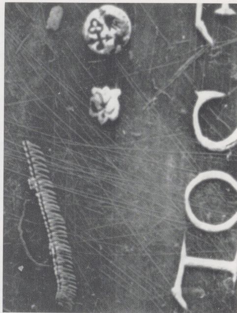
Afb. 6. Merken op de doopschotel van Rijklof van Goens en Esther de Solemne.

dat het merk op Sri Lanka is aangebracht. Bovendien is in het merk het wapen van Colombo toch nog beter te onderscheiden dan in het merk van de munt. Gelukkig is onlangs een publikatie verschenen waarin een aantal plakkaaten uit deze periode is opgenomen 5 . Uit dit Ceylonees Plakkaatboek blijkt dat, eigenlijk wel onverwacht, al eerder dan in Batavia, namelijk op 22 september 1666, in Colombo een keurmeester was aangesteld. Tot keurmeester over alle inlandse (!) goud- en zilversmeden werd de goud- en zilversmid Manuel St. Pay (ook wel geschreven als St. Payo of St. Paya) benoemd. Hij moest er op toezien dat geen goud onder de 21 karaat en geen zilver onder de 19½ karaat werd verkocht. De merken die op dit zilver en goud moesten worden aangebracht werden helaas niet vermeld 6 . Iedereen, dus elke Sri Lankaan van Singhalese, Tamil of Moorse afkomst moest zich aan de besluiten houden. Aangezien er geen Nederlandse zilversmeden genoemd werden, lijkt het waarschijnlijk dat er toen in Sri Lanka nog geen Nederlanders in dit vak werkzaam waren, vooral omdat de keurmeester tot de niet onbelangrijke groep der Toepassen