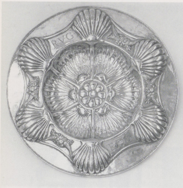
Afb. 5. Zilveren schotel aanwezig in de Wolvendaalkerk te Colombo. Aan de voorzijde zijn de initialen van Rijklof van Goens en Esther de Solemne ingegraveerd. Diameter 52 cm. Ca. 1668, Colombo.

er doorheen een pijl herkennen, treffen we aan op een grote zilveren schotel in de Wolvendaalkerk te Colombo (afb. 5 en 6) 4 . De mangaboom met een vogel erboven is niet erg overtuigend en heeft meer weg van een hand die naar iets grijpt. Op deze schotel, die zich al meer dan drie eeuwen in Colombo bevindt, is op de achterkant een tekst ingegraveerd, die de doop op 17 juni 1668 van Esther Ceylonia van Goens, dochter van Rijklof van Goens en Esther de Solemne (overleden 22 juni 1668) memoreert. Indien we aannemen dat het bord ouder is dan de datum van de inscriptie aangeeft, dan betekent dit dat er in Colombo mogelijk al voor juni 1668 gekeurd werd. Helaas zijn in die periode geen kopieën van alle resoluties naar Nederland gestuurd, zodat de benoeming van een eventuele keurmeester niet gemakkelijk is te verifiëren. In latere resoluties kon evenmin een benoeming van een keurmeester worden gevonden. Hoewel de schotel in principe in Colombo geïmporteerd kan zijn, is de combinatie van een onbekend merk op een schotel in Colombo én op een Oosters voorwerp als een kwispedor op zich al een sterke aanwijzing