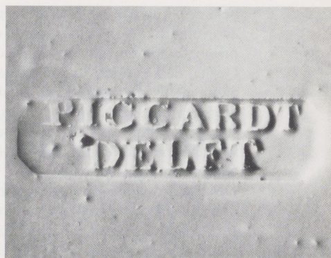
Afb. 4. Fabrieksmerk 'PICCARDT DELFT' aan de achterkant van de borden.

Scheveningen. De scène is overgenomen van een aquatint door W. H. Hoogkamer naar H. P. Oosterhuis 14 . Het getuigt niet van veel kunstzin van de kant van de plateelschilder dat bij een zo simpele voorstelling al naar een voorbeeld werd gewerkt. Verondersteld mag worden dat de decoratie op de sacramentsborden op soortgelijke wijze tot stand is gekomen.