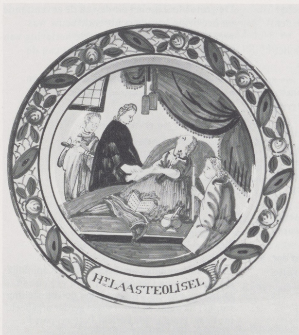
Afb. 3. Bord 'H T LAASTEOLISEL'. Gepolychromeerd aardewerk. Piccardt Delft. Diam. 25,5 cm.