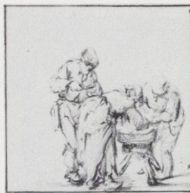
Afb. 10. Isack van Ostade. Drie figuren bezig met het schoonmaken van vlees van een geslacht dier en staand jongetje van achteren, album Figuurstudies 1 , fol. 62. Amsterdam, Rijksprentenkabinet.

Van Adriaens jongere broer Isack leek in ieder geval één tekening aanwezig te zijn 14 (album I, fol. 32; afb. 9). We zien een man bij een tafel die met zijn rechterhand een gebaar maakt alsof hij geld uittelt. Rechts loopt een jongetje van hem weg met een rommelpot (?) onder zijn arm. Deze tekening werd gemaakt met potlood en daarna met penseel in grijs uitgewerkt. Het blad draagt een opschrift in 17de-eeuws schrift: Ostade heeft dit na 't leven geteykent . Dit handschrift is niet dat van Isack, die op enkele van zijn tekeningen aantekeningen maakte 15 , en het opschrift werd dus later aangebracht. De kaderlijn om