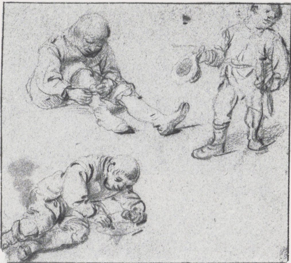
Afb. 14. Isack van Ostade. Drie schoolkinderen, album Figuurstudies II, fol. 86. Amsterdam, Rijksprenten- kabinet.