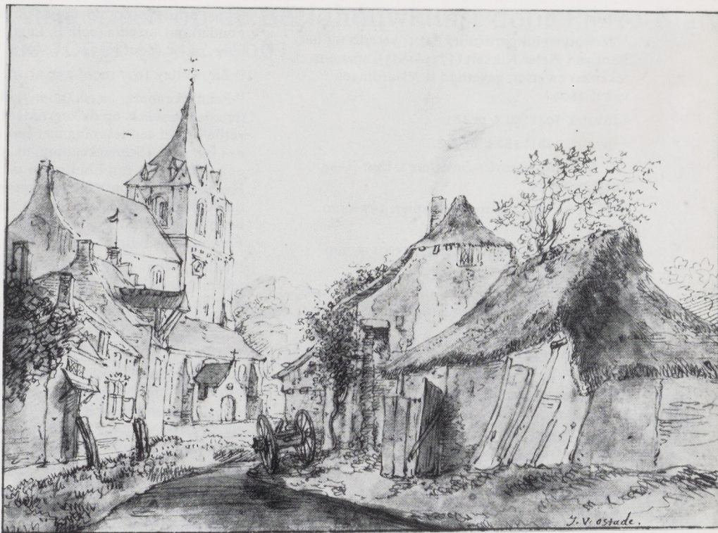
Afb. 17. Isack van Ostade. Gezicht te Eindhoven vanuit het noord-oosten. Malibu, The J. Paul Getty Museum. Afb. 18. Cornelis Pronk en/of Abraham de Haen. Gezicht te Eindhoven vanuit het noord-oosten, fol. 48 van schetsboekje. Amsterdam, Rijksprentenkabinet.