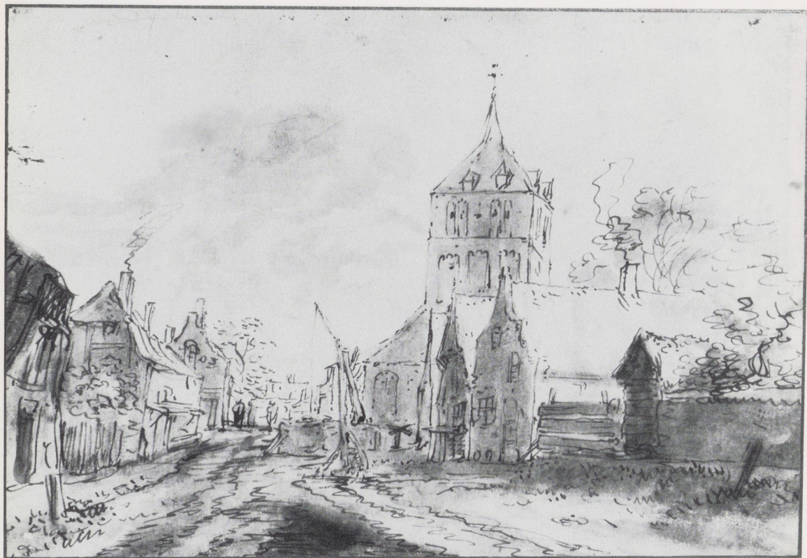
Afb. 16. Isack van Ostade. Gezicht te Eindhoven vanuit het westen. Amsterdam, particuliere verzameling.

keerzijde van de gereconstrueerde tekening kon worden herkend, bleek het ook mogelijk nog andere tekeningen te lokaliseren. Isack tekende namelijk van twee kanten de kerk te Eindhoven, eenmaal vanuit het westen (afb. 16) 25 en eenmaal vanuit het noordoosten (afb. 17) 26 . Ongeveer een eeuw later zat er weer een kunstenaar op dezelfde plaats als Isack en deze schreef de plaatsnaam boven zijn tekening (afb. 18) 27 . Het is niet zo verwonderlijk dat juist Eindhoven is weergegeven. De vader van Adriaen en Isack was Jan Hendricx van Eynhoven, die waarschijnlijk uit Ostade bij Eindhoven