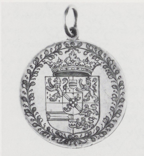
Afb. 1 en 2. De voor- en achterzijde van de gouden medaille die stadhouder Frederik Hendrik heeft geschonken aan Piet Heyn.