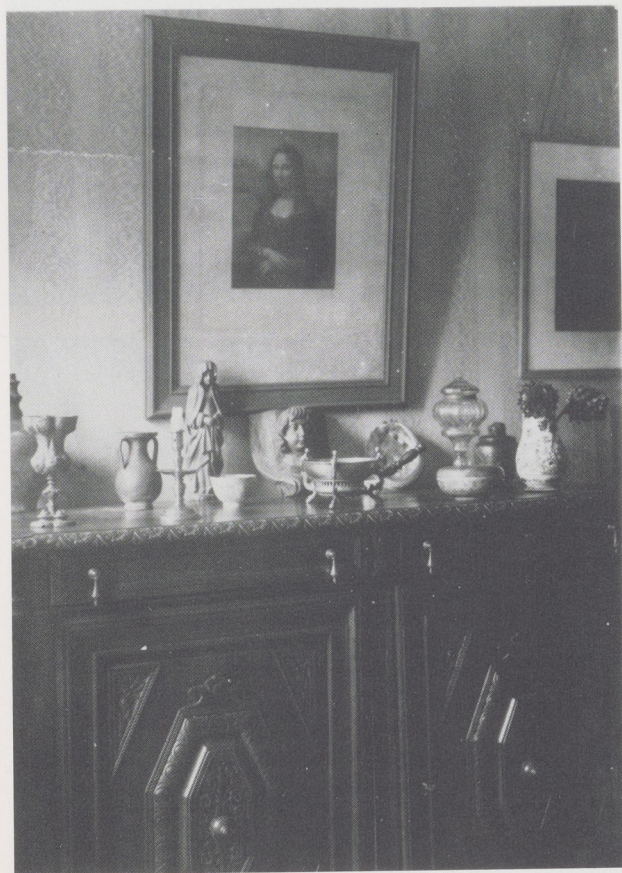
Afb. 2. Maris' 'grand salon' op Westbourne Square 18 in Londen. Boven het kabinet hangt een prent van de Mona Lisa door Luigi Calamatta. Maris had deze prent met krijt opgewerkt.