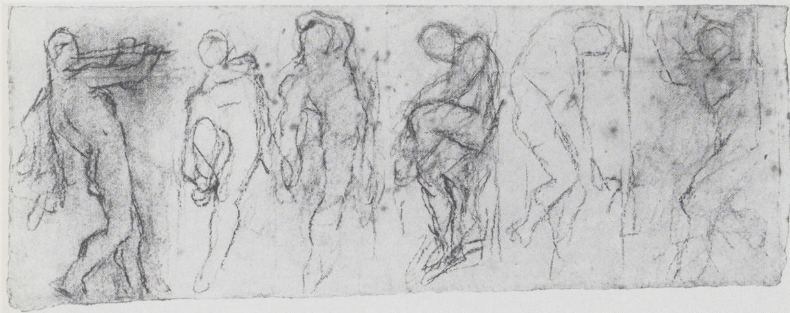
Afb. 13 (linksonder). De schalmeiblaazer, ontwerp voor een kamerscherm. Zwart krijt, 278 x 190 mm.