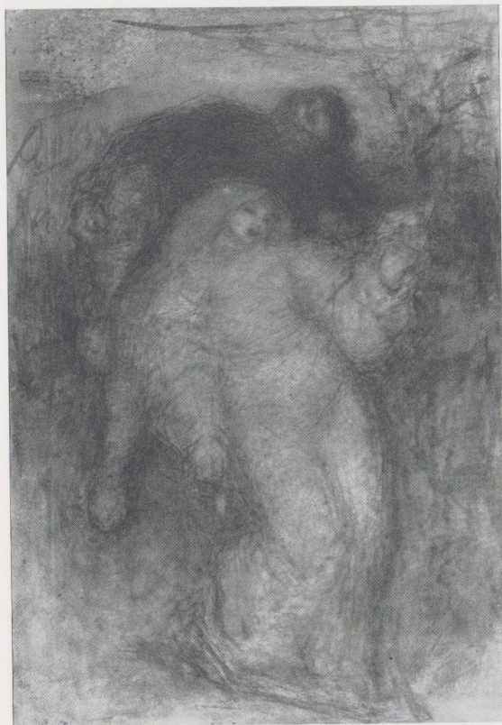
Afb. 8. Staande vrouw en achter haar een zittende man. Zwart krijt, penseel in grijs, bruin en wit, 545 × 360 mm.