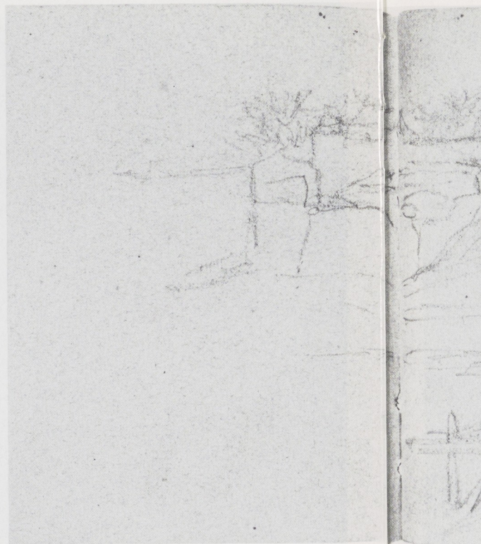
Afb. 5. Voorstudie voor het schilderij De buitenkant van een Frans stadje . Zwart krijt. Twee bladen van een schetsboek. Het linker gedeeltelijk afgebeeld. Bladmaat 140 × 225 mm. Deze tekening maakt deel uit van één van Maris' schetsboekjes.

te maken en door veelvuldig herhalen en overdoen het atmosferische te bereiken 19 . In het andere schetsboekje (inv. 1981 : 6) heeft Matthijs Maris een aantal idyllische composities van twee figuren in steeds wisselende poses getekend. Deze 'prinsen' en 'prinsessen' – zoals ze later werden genoemd – treffen we veelvuldig aan in het werk uit zijn Londense periode (1878–1917). Zo maakte hij in dit schetsboekje een reeks voorstudies (p. 3 verso t/m 12 recto) voor twee tekeningen, die eveneens afkomstig zijn uit het ensemble van Fridlander (inv. 1981 : 5 en inv. 1982 : 11), en voor de – ten onrechte als De koningskinderen aangeduide – tekening uit de collectie van mevrouw A. E. Reich-Hohwü (inv. 1978 : 30) in het Rijksprentenkabinet (afb. 7–9). Een belangrijke groep vormen de acht jongelingschetsen, ook wel Titanen genoemd. De jongelingen zijn, gezien de tempels op de achtergrond bij enkele ervan, 'klassieke' figuren 20 . In de Mededelingen van