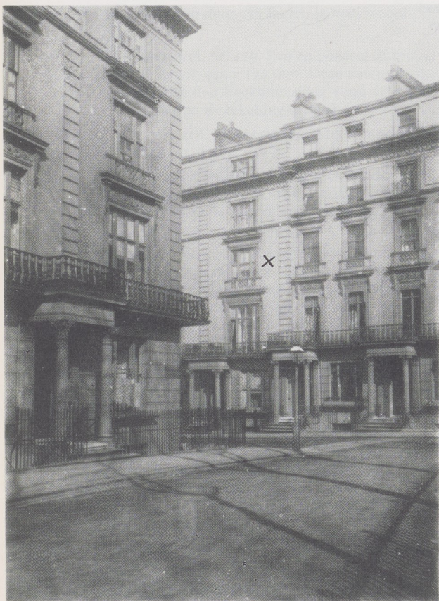
Afb. 1. De etage van Westbourne Square 18 in Londen waar Matthijs Maris van 1906 tot aan zijn dood in 1917 woonde.

Matthijs Maris had, toen hij in Londen woonde (1877–1917), de naam ongenaakbaar te zijn voor mensen die hem niet persoonlijk kenden. Nieuwsgierige bezoekers hield hij zoveel mogelijk buiten de deur, terwijl zijn hospita hem daarbij hielp. Diegenen die zich toch toegang wisten te verschaffen tot zijn sobere optrekje in Londen (afb. 1) 1 hebben daarover in enkele gevallen omstandig geschreven. Het bekendst is de beschrijving van het bezoek dat Lodewijk van Deyssel in 1894 met Jan Toorop aan de 55-jarige schilder bracht 2 . In bijna lyrische bewoordingen schreef deze Tachtiger: Ik begreep, dat ik hier op een der subliemste plaatsen van de wereld was, waarschijnlijk op de heiligste plek, die thands in Europa wordt aangetroffen 3 . Hij doelde hiermee op het appartement van Maris, een klein, lichtelijk gebocheld jong oudachtig mannetje, met heel armoedige oude en slordige kleertjes aan ... De muren waren bruin, de zoldering was bruin, geheel en al donker door het fijne, sterke licht, en niet duidelijk te onderscheiden. Grootte schilderijen stonden, alle met hun ruggen naar ons toe, op hoopen tegen de muren, alle donker bruin en duister. Nauwelijks was er, behalve voor den engen doorgang, plaats voor het éene tafeltje, dat als oud ijzer geworden was en waarop wat schilderswerktuig lag. Tusschen deze hoog opstaande bruine duisters, viel in de sublime woning een fel wit licht, opmerkelijk veel lichter dan men vermoeden zou dat van den donker grijzen hemel buiten kon dalen. En