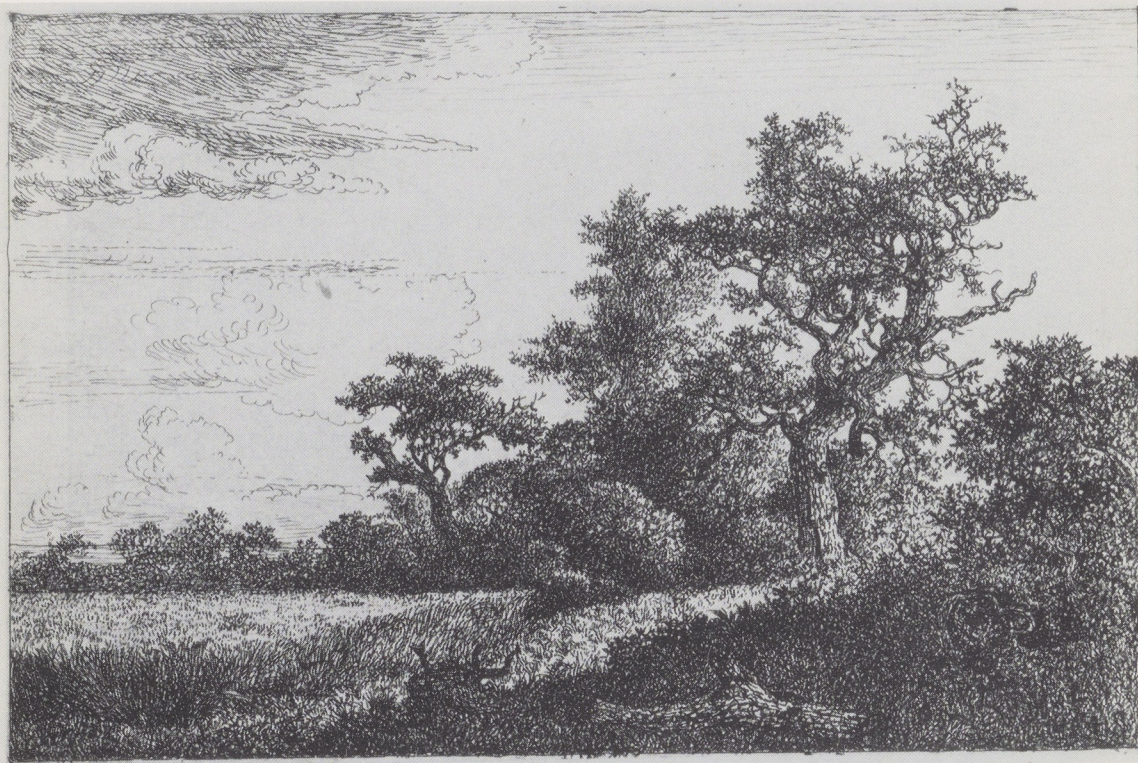
Afb. 1. Jacob van Ruysdael. Korenveld omzoomd door bomen. Ets, B. 5 II. In 1958 aangekocht met steun van het F. G. Waller-Fonds. Rijksprentenkabinet, Amsterdam.

De aanwinsten op het gebied van de overige buitenlandse grafiek: Italiaanse, Duitse, Engelse, e.a. zijn wel minder talrijk geweest, maar daarom zeker niet zonder spectaculaire uitschieters: het complete oeuvre der Tiepolo's uit de collectie Liechtenstein (1950), één der beroemde verzamelbanden met het jaartal 1637, vol Duitse grafiek van Urs Graf, Hans Weiditz, e.a. (1965, afb. 3), de aangrijpende ets El Agarrotado , van Goya (1972, afb. 4), Munchs monumentale houtsnede met twee vrouwen aan het strand (1979) en niet te vergeten menig prachtstuk onder de Japanse houtsneden, van Harunobu, Utamaro, Hiroshige e.a.