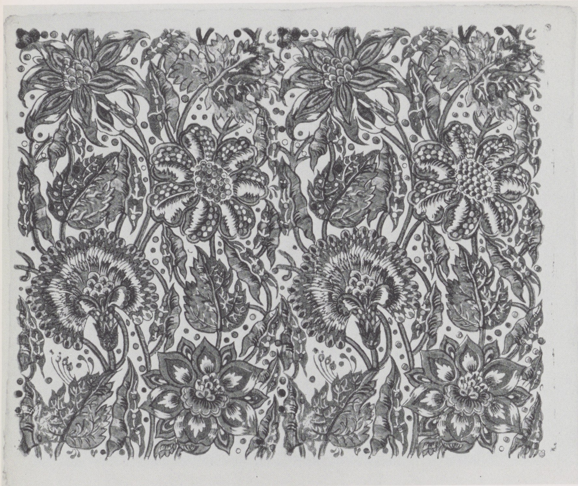
Afb. 3. Veelkleurig sits- of katoenpapier met bloem- motieven. Blokdruk, verm. Duits, ca. 1760. Rijksprenten- kabinet, Amsterdam (afkomstig uit coll. F. G. Waller).

Cachet en Nieuwenhuis en de schutbladen van Georg Rueter uit de jaren 1910-'20 met adres van 'Het Klokhuis' te Amsterdam. Deze vullen met een kleine maar interessante groep Oosterse bladen de laatste portefeuilles van de collectie sierpapieren zoals die kort geleden opnieuw werd geordend. Van die collectie, nu ca. 750 stuks tellend, beslaat de schenking van F. G. Waller numeriek nog steeds ongeveer tweederde gedeelte en ook in kwalitatief opzicht vormt zij het hoogtepunt ervan. Nog zeer onlangs werden er door aankoop op veilingen weer een aantal Neurenbergse en Augsburgse gouddrukken uit de collectie Mr. C. F. van