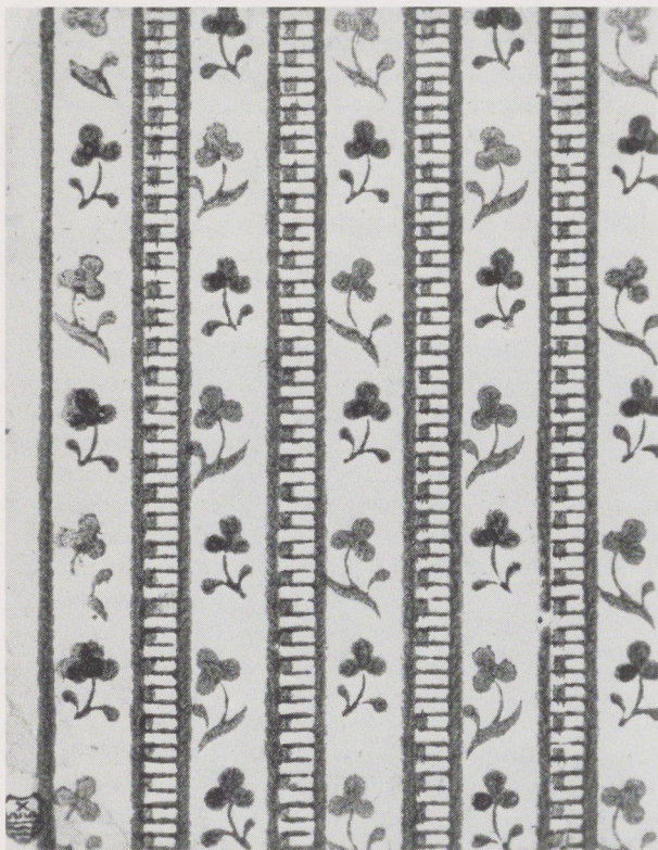
Afb. 4. Detail van sierpapier met regelmatig patroon. Blok- of stempeldruk, 19de eeuw. Rijksprentenkabinet, Amsterdam (afkomstig uit coll. F. G. Waller).

marmere- en stijfelpapieren in 's Rijks Prentenkabinet te Amsterdam, Oude Kunst III, 1918–1919, pp. 252–253.