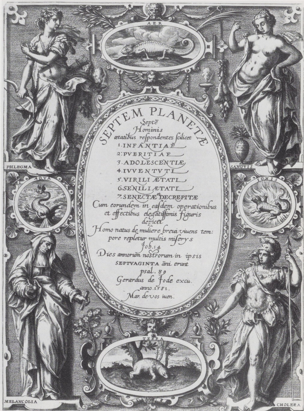
Afb. 17. Adriaen Collaert naar Maarten de Vos. Titelprent voor een serie van Zeven Planeten en Leeftijden (1581). Rijksprentenkabinet, Amsterdam.