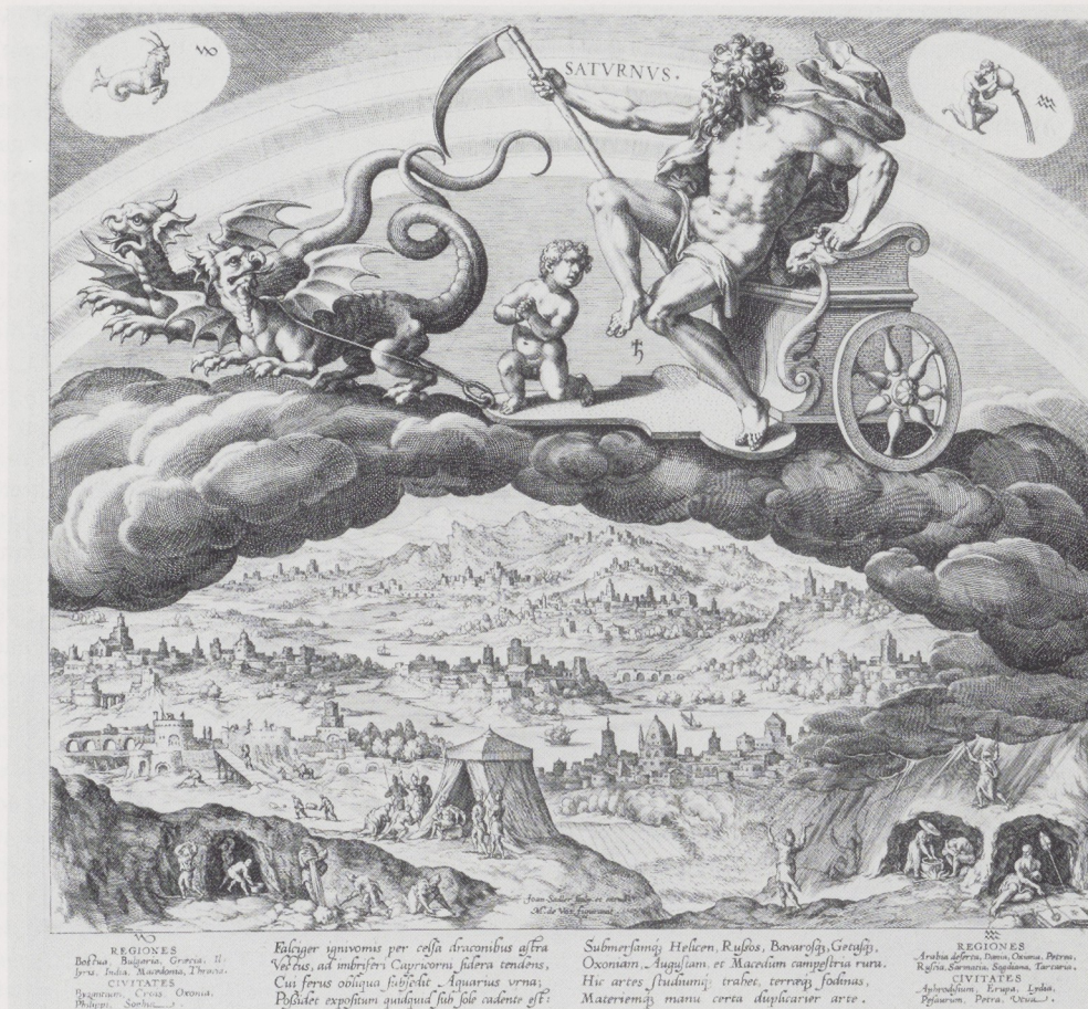
Afb. 16 (boven). Jan Sadeler de Oude naar Maarten de Vos. Saturnus (1585). Rijksprentenkabinet, Amsterdam.

is ontstaan en die het onderwerp weer op een heel andere en eigen wijze weergeeft.