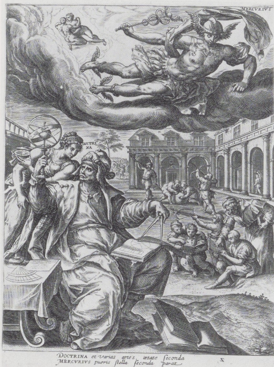
Afb. 19. Adriaen Collaert naar Maarten de Vos. Mercurius-Kindertijd (1581). Rijksprentenkabinet, Amsterdam.