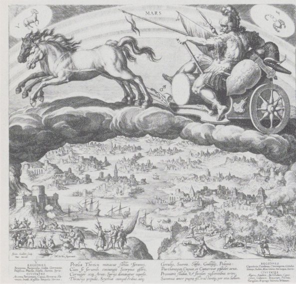
Afb. 14 (boven). Jan Sadeler de Oude naar Maarten de Vos. Mars (1585). Rijksprentenkabinet, Amsterdam. Afb. 15 (onder). Jan Sadeler de Oude naar Maarten de Vos. Jupiter (1585). Rijksprentenkabinet, Amsterdam.