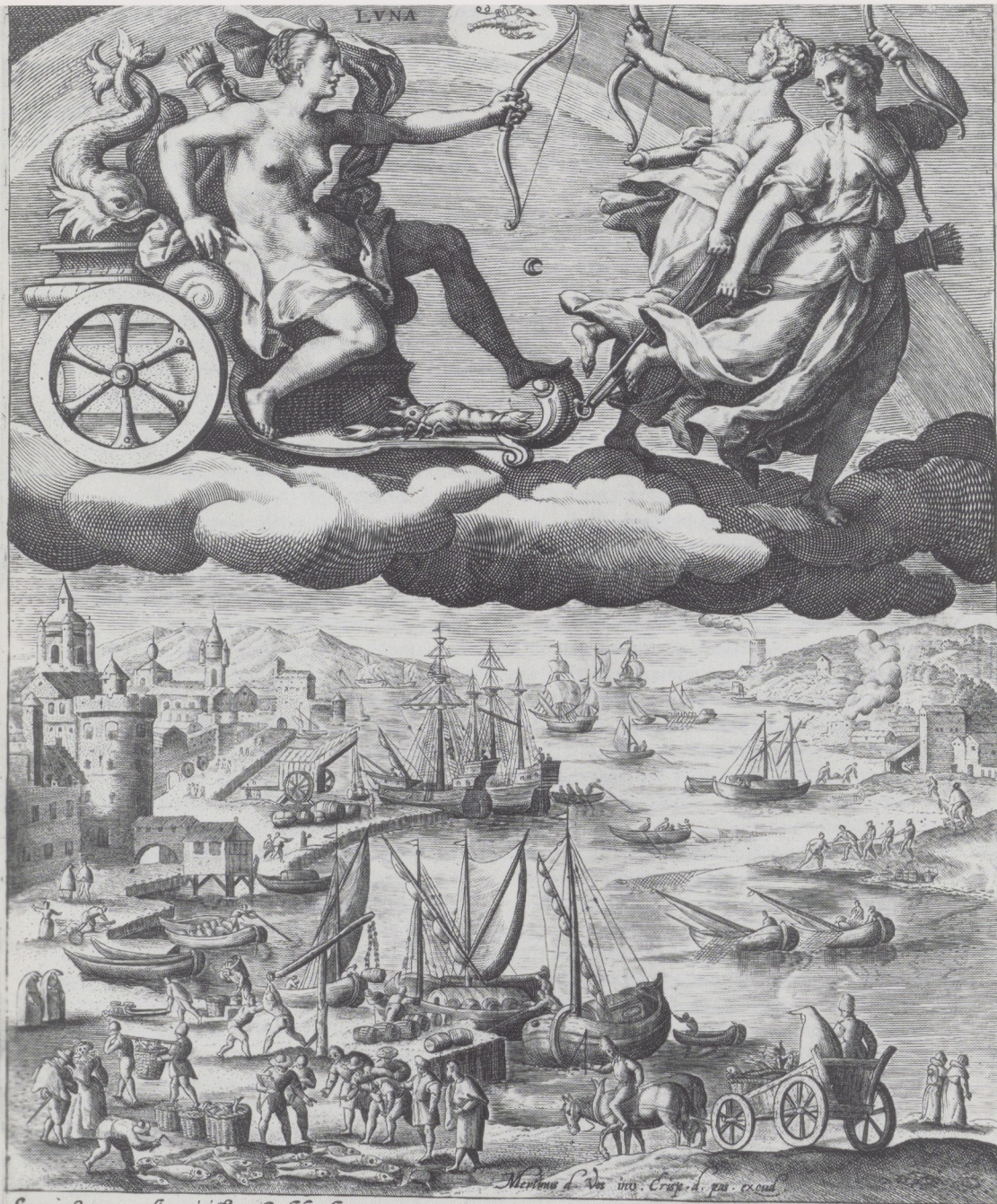
Afb. 2. Crispijn de Passe de Oude naar Maarten de Vos. Luna. Rijksprentenkabinet, Amsterdam.

Luna nocturnos radios ministrat Albido curru variatq; menſes Cornibus plenis, modo ſemplenis, Aut vacuatis.