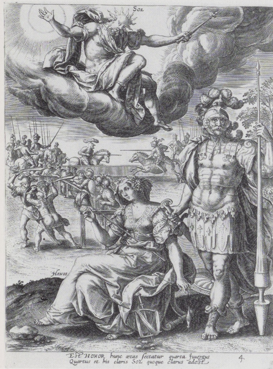
Afb. 21. Adriaen Collaert naar Maarten de Vos. Sol-Volwassenheid (1581). Rijksprentenkabinet, Amsterdam.