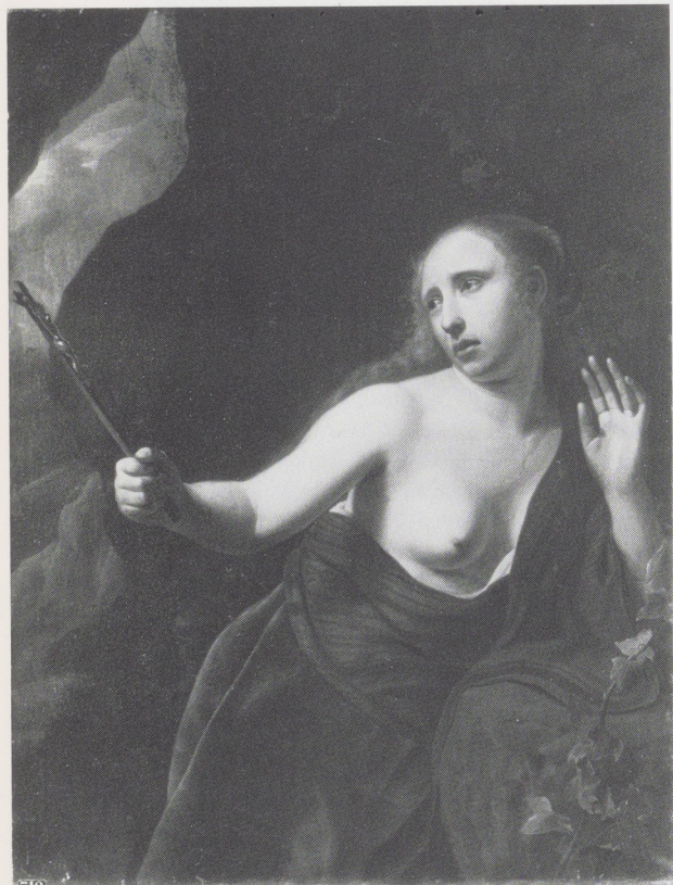
Afb. 3. Dirck Bleker, 1651. Maria Magdalena. Amsterdam, Rijksmuseum.

buick ende lengte. Hebbe daer met Mons' van Campen 13 van gesproken. Sijn begeerte is dat men de teekening soude oversende met den alder eersten also hij hier tegenwoordich is. Hij ceurt haer voor volmaeckt schoon en meint dat hij so vertoont om dat het wat van anderen gesien wort of omdat het in de teekening niet genoch wtgeront is, doch als de teekening hier is sullen wij daer van dischereren wat dat tot verbetering van schoonheit sou dienen. Ick heb noch een seer schoon model gecreegen dat nae mijn meining het onderste schoonder is. Ick en sal geen moeite noch costen ontsien om so het mogelijk is een volmaecte schoonheit voor den dach te brengen ende op het alder curieyeuste wt te voeren. Mons' van Campen versoeckt of uwe edele meteen gelieft te doen