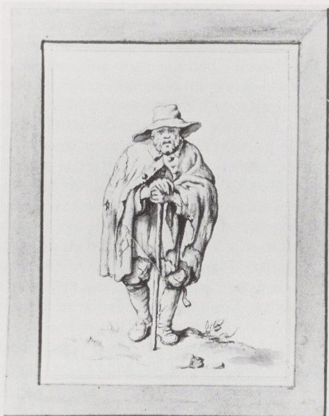
Afb. 14. Frans van Mieris jr. (1689–1763). Oude man en krankzinnige vrouw. Twee tekeningen van ca. 1747–1750, gemaakt voor de gravure op het glas van afb. 13. Gemeentelijke Archiefdienst, Leiden.