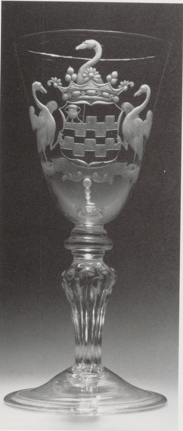
Afb. 11. Willem Otto Robart, ca. 1730. Glas met het wapen van de familie Van Slingelandt. H. 19,5 cm. Burggraaf Newport, Weston Park, Shifnal, Shropshire, Engeland.