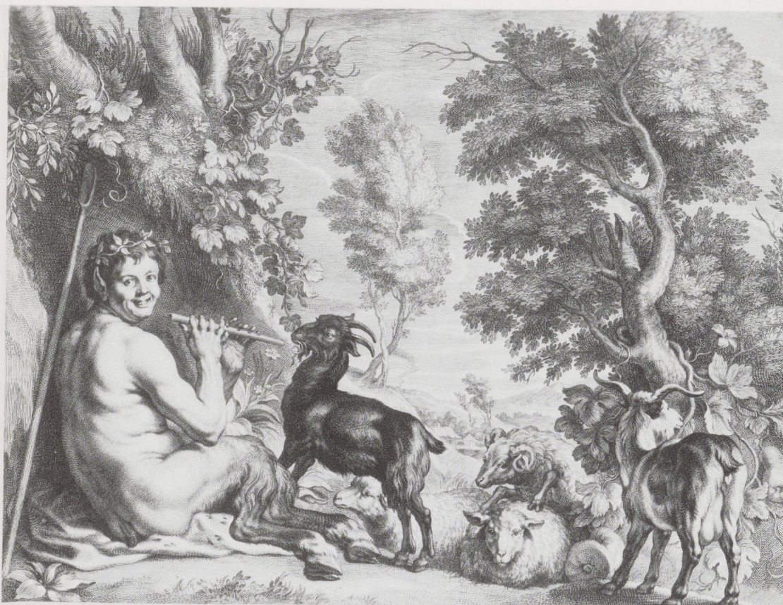
Afb. 10. Schelte à Bolswert. Pan, fluitspelend in een landschap. Gravure, naar een schilderij van Jacob Jordaens. Rijksprentenkabinet, Amsterdam.

Pan salit et virali ridens sub tegmine laet. Dixerunt legibus gutture Dulce sonas.