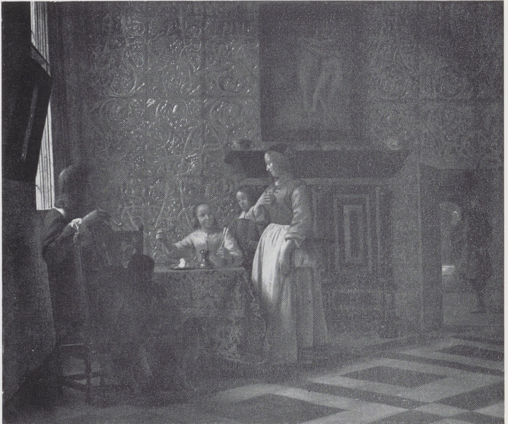
Afb. 4. Pieter de Hooch (1629–na 1683). Gezelschap in interieur . Doek, 58,5 × 68,5 cm. The Metropolitan Museum of Art, Robert Lehman Collection, New York.

derd: behang met precies hetzelfde motief komt voor, zoals de heer Van Soest constateerde, op een interieur van Pieter de Hooch in het Metropolitan Museum te New York, dat omstreeks 1665 wordt gedateerd (afb. 4). Het is geenszins onwaarschijnlijk, dat de mooiste kamer van het kasteel Elmina inderdaad met goudleer behangen is geweest: dit materiaal houdt zich immers uitstekend in het vochtige klimaat, waar Elmina om berucht was 7 . De hoofdfiguur zelf vertoont de haardracht en de kledij, die omstreeks 1660 mode waren: halflang los haar, zwarte jas met kostbare voering van gebloemde zijde of brokaat, vol met strikjes van kleurige tafzijde en zilveren troetels naar de smaak van de