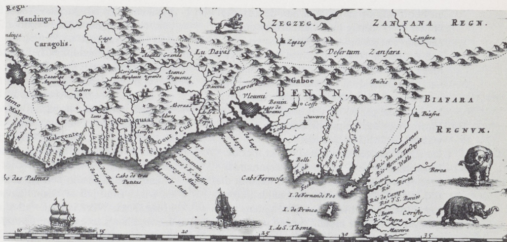
Afb. 7. Detail uit afb. 6.