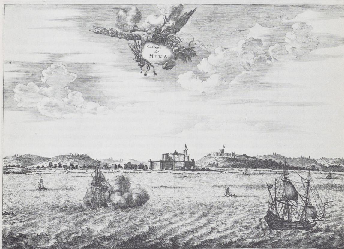
Afb. 8. Gezicht op Elmina. Uit: O. Dapper, Naukeurige beschrijvinge der Afrikaensche gewesten... , Amsterdam 1668 (Foto Universiteitsbibliotheek, Amsterdam).

van kracht – of de handelsoorlog laaide door de komst van een vloedgolf van Engelse schepen meer dan ooit op. De overvoering van de Afrikaanse markt met goederen ten gevolge daarvan, verhinderde in 1669 voor het eerst de totstandkoming van een prijsafspraken met de Accanisten. Bovendien brak er als gevolg van de grote invoer van vuurwapenen in het achterland van de Grein-, Goud- en Slavenkust onder de binnenlandse potentaten een reeks van oorlogen uit, die zo'n zes jaar lang hevig woedde en de goudhandel buitengewoon bemoeilijkte 55 . De goudkist van de w.i.c. kreeg ten gevolge van o.m. die oorlogen maar de helft van wat daar gewoonlijk in terecht kwam. Daardoor beschikte de Compagnie over te weinig