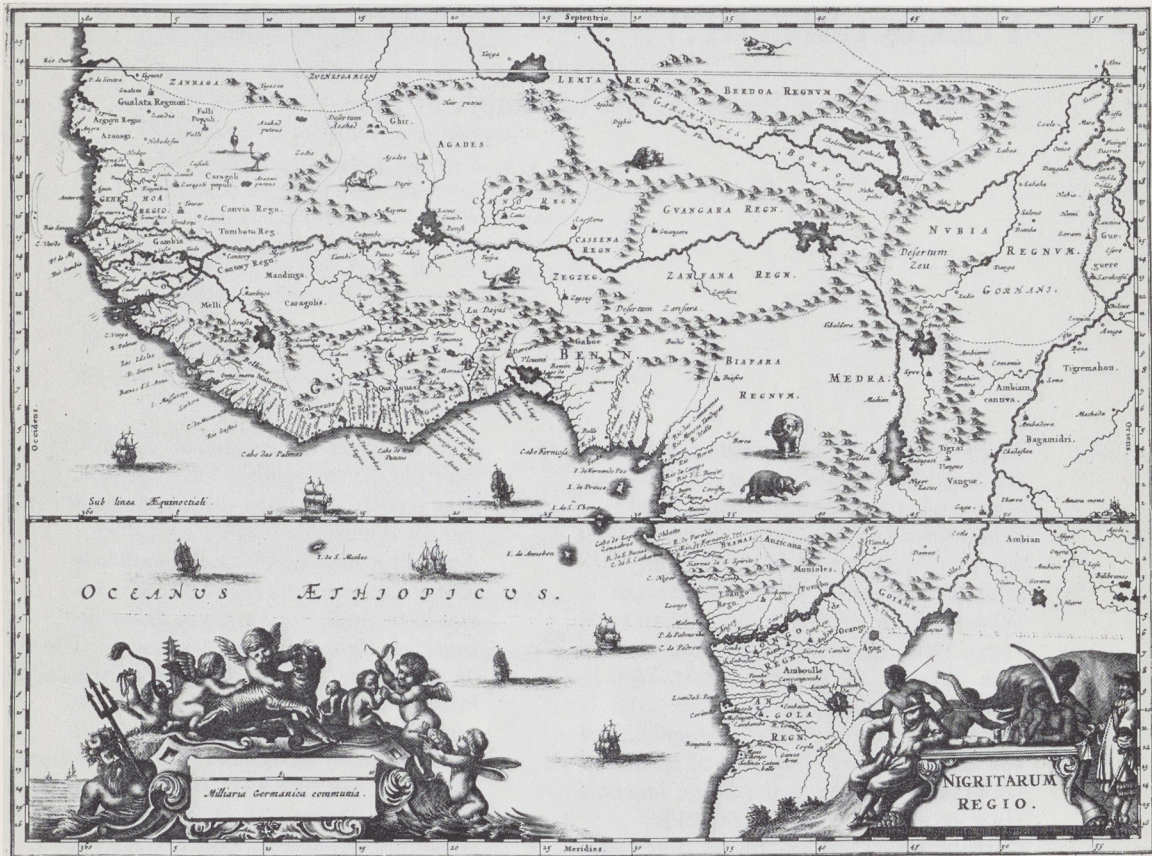
Afb. 6. De Afrikaanse westkust. Uit: O. Dapper, Nauwkeurige beschrijvinge der Afrikaensche gewesten... , Amsterdam 1668.

tocht als lorrendraaier, er de voorkeur aan gaf vrijwillig in dienst te treden bij de w.i.c., liever dan thuis geconfronteerd te worden met zijn reders of bevrachters. In weerwil van de placcaten mocht de Compagnie nog blij zijn smokkelaars bereid te vinden bij haar in dienst te treden, dit vooral gezien de hoge sterfte onder het personeel op de kust. Alleen notoire belhamels en onwilligen werden te Elmina gevangen gezet tot er een schip gereed was naar patria uit te zeilen 14 . Als een lorrendraaier zich zonder slag of stoot overgaf, mochten officieren en bootsvolk hun plunje en zelfs hun tot dan toe verdiende gage behouden 15 .