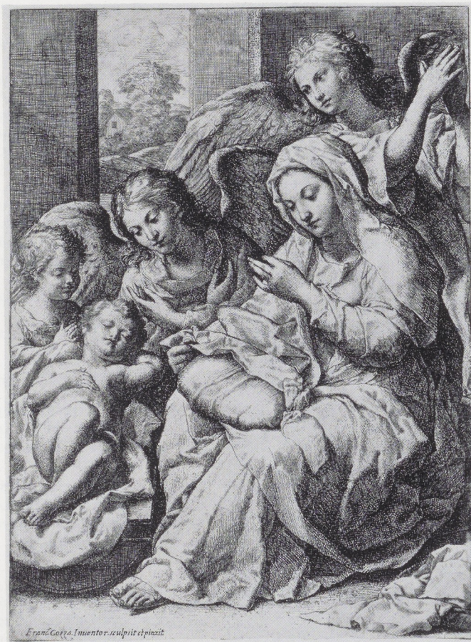
Afb. 9. Francesco Cozza. Maria met het slapende Kind, omgeven door engelen. Rijksprentenkabinet, Amsterdam. Geschenk van het F. G. Wallerfonds.

WILLIAM BLAKE (1757-1827) en TH. PIROLI (1750-1824) naar JOHN FLAXMAN (1755- 1826). The Iliad en The Odyssee. Twee series gravures (39 en 34) in één band, 1805.