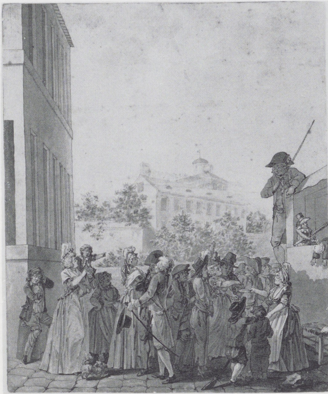
Afb. 6. Nicolas-Antoine Taunay. Poppenkast op een plein. Rijks- prentenkabinet, Amsterdam.

Aquarel, 337 × 506 mm. Legaat mevr. Th. L. Laue- Drucker, Den Haag. Zie: Bulletin 1975, afb. 17 op blz. 192.