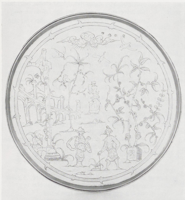
Afb. 7. Blad. Londen 1685, meesterteken AH. Huidige verblijfplaats onbekend.