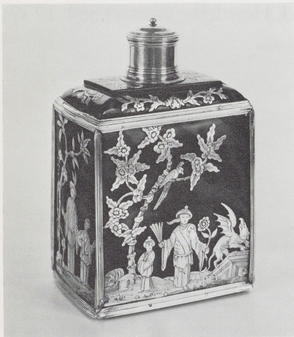
Afb. 1 en 2. Hendrik Voet. Theebusje. Rijksmuseum, Amsterdam.