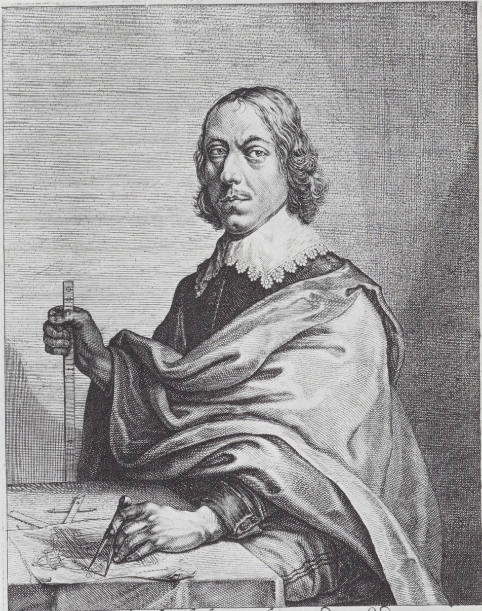
Afb. 1. S. Saverij. Jacob Vennekool? Gravure. Rijksprentenkabinet, Amsterdam.

Siet hier het Beeltenis geboren in dees Stadt Die in een kleyn begryp een groot Gebou beuat En i Raethuys Vierlyck stelt in pleyster voor ons ooggen Gy bent tot leet helaes ons al te vroeggh ontoghen Doch ghy Rust in den Heer u Roem sal niet vergaen Soo lanck des Hemels blau aen t Firmament sal staen .