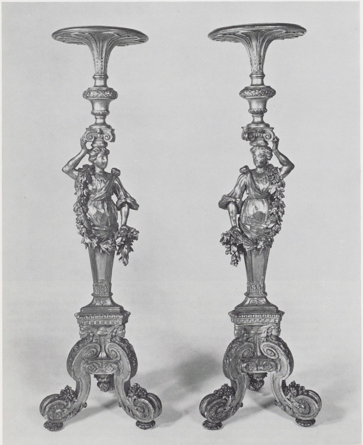
Afb. 1. Twee guerdons. Verguld lindehout, H. 146 cm. Noord-Nederland, in de stijl van Daniel Marot, vroege 18de eeuw. Rijksmuseum, Amsterdam. Geschenk van de Commissie voor Fotoverkoop, 1972.