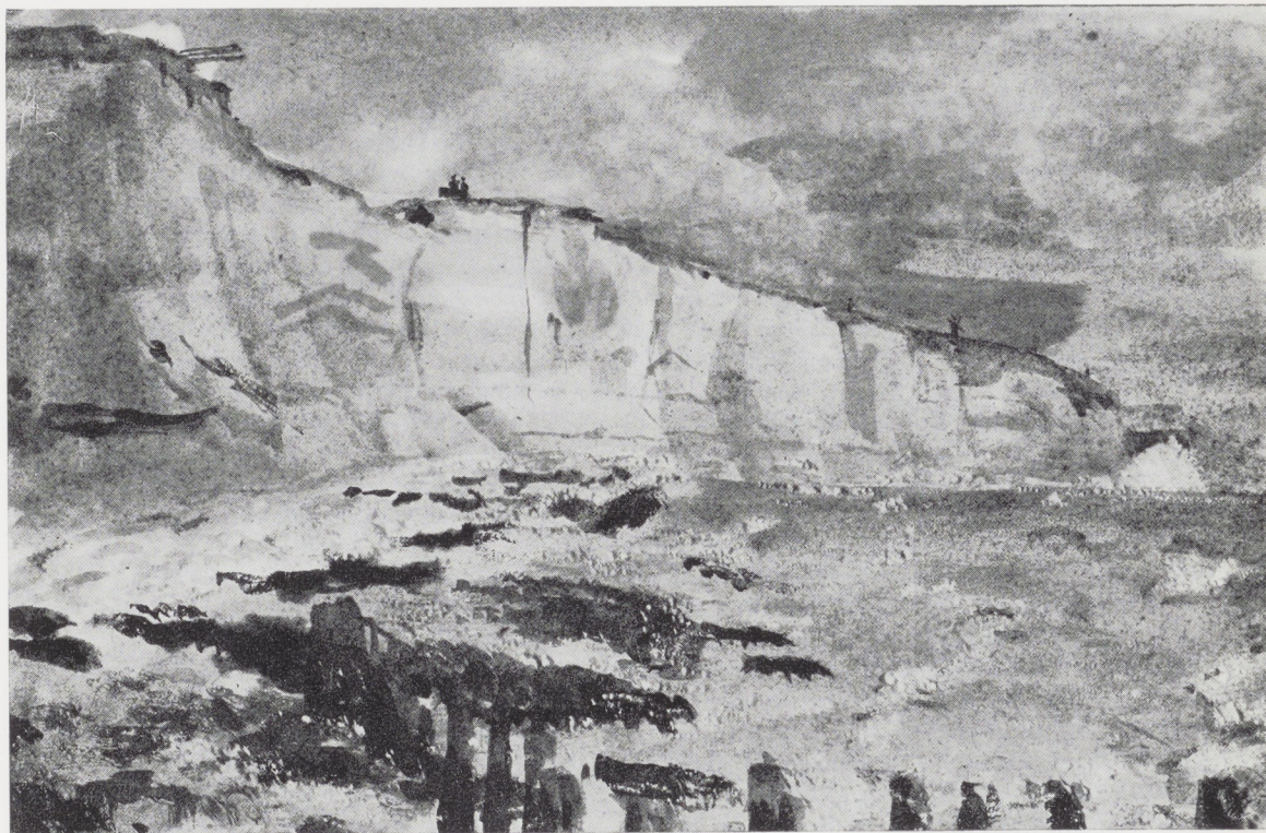
Afb. 1. A. Delacroix (1798-1863). Krijtrotsen bij Dieppe. Aquarel en gouache, 132 × 198 mm. Rijksprentenkabinet, Amsterdam. Aankoop 1967.