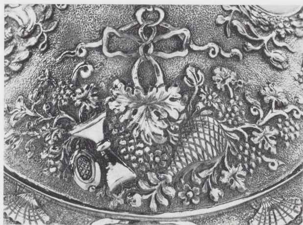
Afb. 6-8. Details van afb. 1.