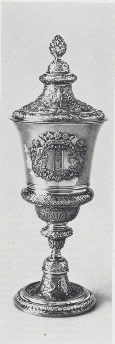
Afb. 4. Keerzijde van afb. 1.