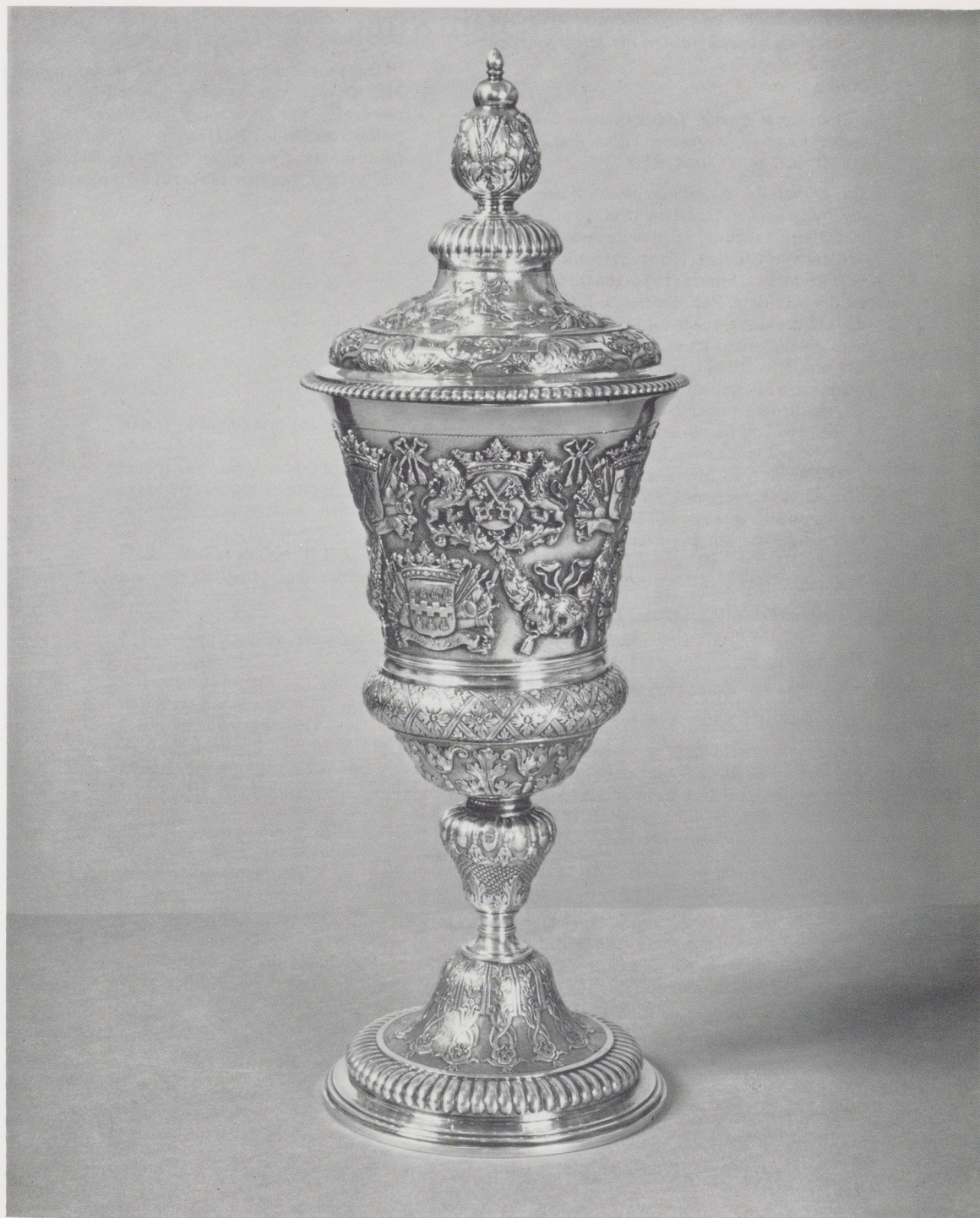
Afb. 10. Beker van het Leidse Schuttersgilde. Zilver, in 1711 vervaardigd door Cornelis van Dijck, te Delft. Rijksmuseum, Amsterdam.