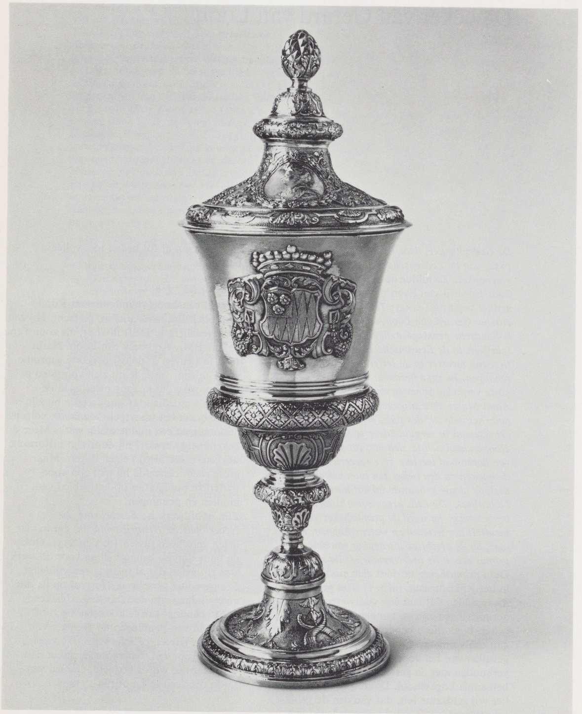
Afb. 1. Beker van Gerard van Loon. Verguld zilver, in 1723 vervaardigd door Cornelis van Dijck, zilver-smid te Delft. Rijksmuseum, Amsterdam (bruikleen van het Bisschoppelijk Museum te 's-Hertogenbosch).