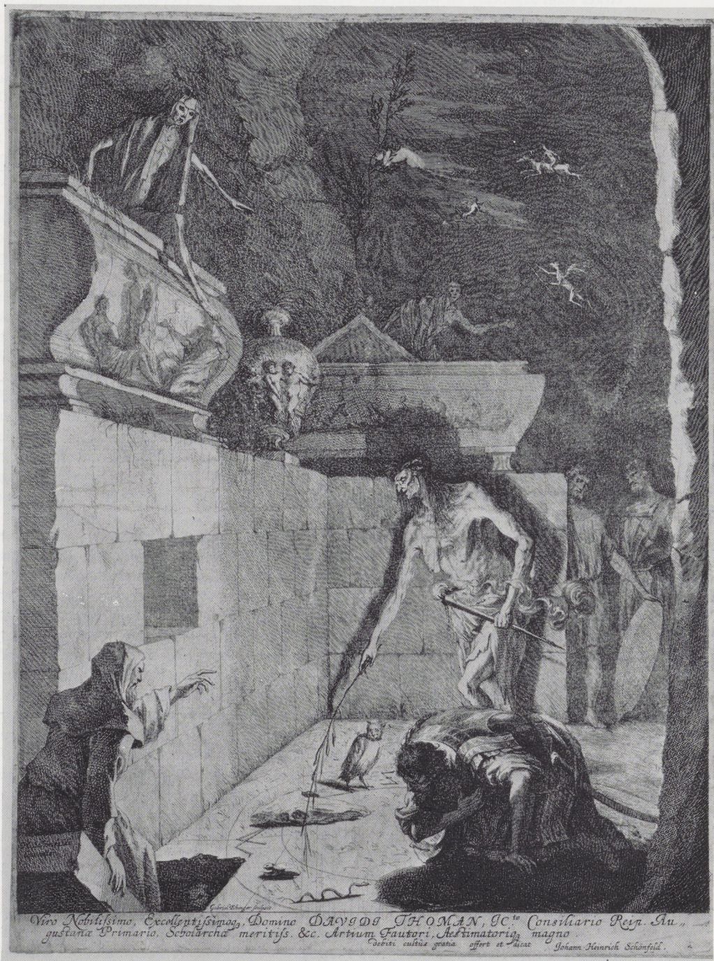
Afb. 1. G. Ehinger. Saul bij de heks van Endor. Ets en gravure, 400 × 308 mm. Rijksprenten- kabinet, Amsterdam.