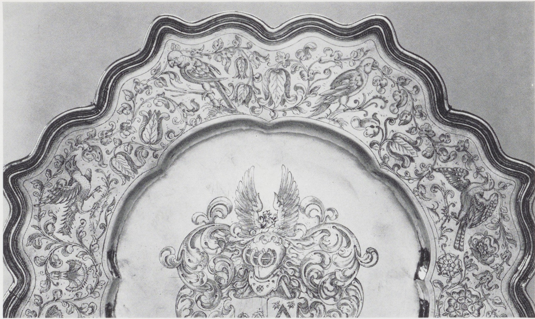
Afb. 6. Detail van de rand van afb. 1.

Indien Hansen zich later Hanselaer heeft genoemd, zou de schotel dus ook in 1670 door hem gemaakt kunnen zijn. Toch menen wij dit te moeten betwijfelen, en wel om de volgende redenen. Zoals reeds werd opgemerkt nam het gilde de insculpatieplaat met de naam van Claes Hanselaer kort na het midden van de zeventiende eeuw in gebruik. Dit moet na 1653 en voor 1678 zijn gebeurd. In het jaar 1653 legde Jannus Geerinck, wiens naam als eerste op de plaat is gegraveerd, de burgereed af 39 . Aspirant-leden werden slechts tot het gilde toegelaten wanneer zij burger van de stad Zwolle waren. Geerinck kon dus eerst in 1653 gildebroeder worden. In 1678 overleed Christiaan Reiners, die als derde op de plaat wordt vermeld en die sedert 1650 te Zwolle als zilversmid werkzaam was 40 . Het jaar van ingebruikname van de legger is echter nauwkeurig vast te stellen op 1663. Indien men de plaat namelijk bekijkt, ziet men eerst de drie keurmerken te weten: het Zwolse wapen met kroon, voor de eerste keur. het Zwolse wapen met R D, voor de tweede keu-