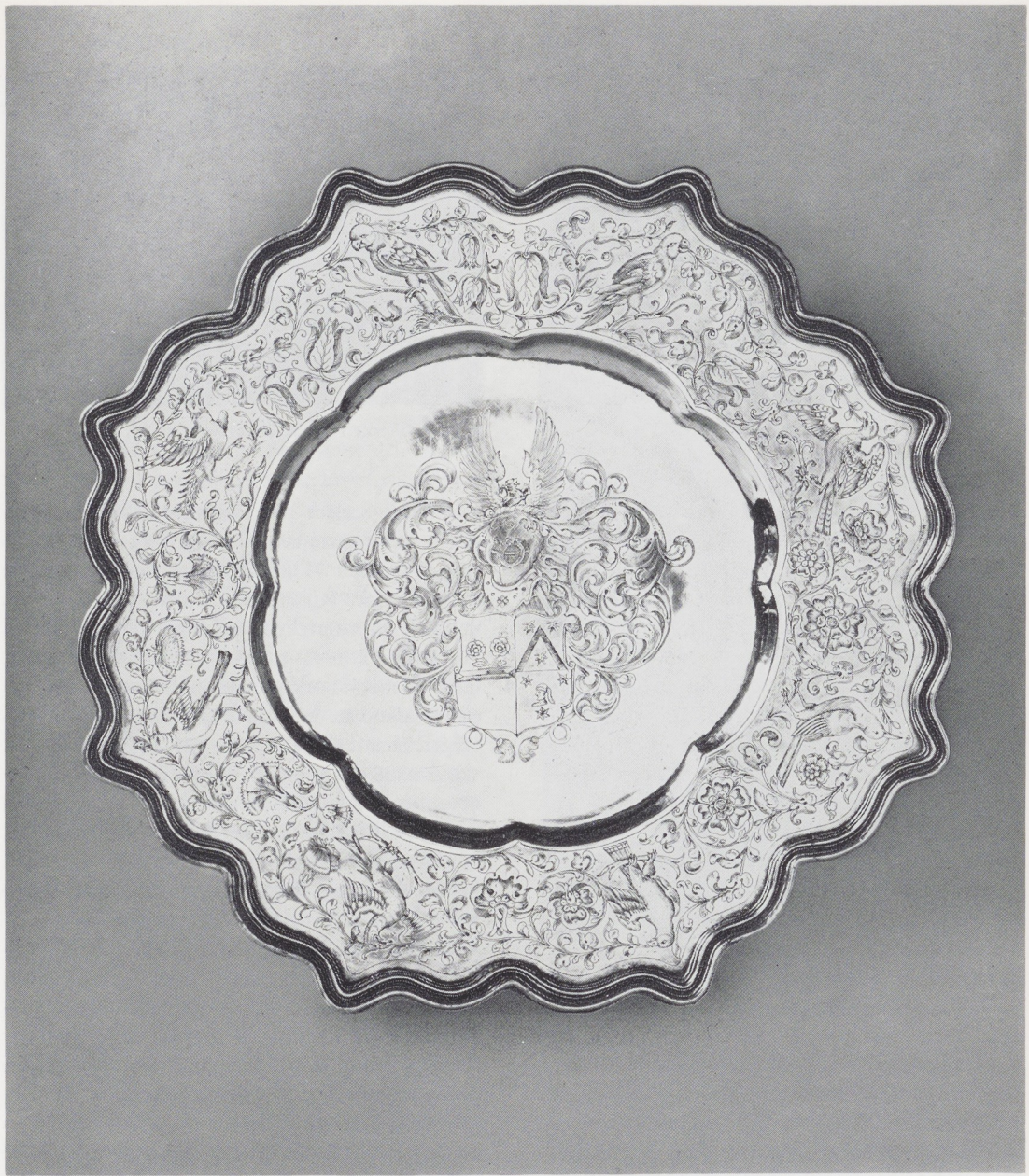
Afb. 1. Claes Hansen. Zilveren schaal met het alliantiewapen Schickhart-Ter Welberch. Diam. 33 cm. Rijksmuseum, Amsterdam.