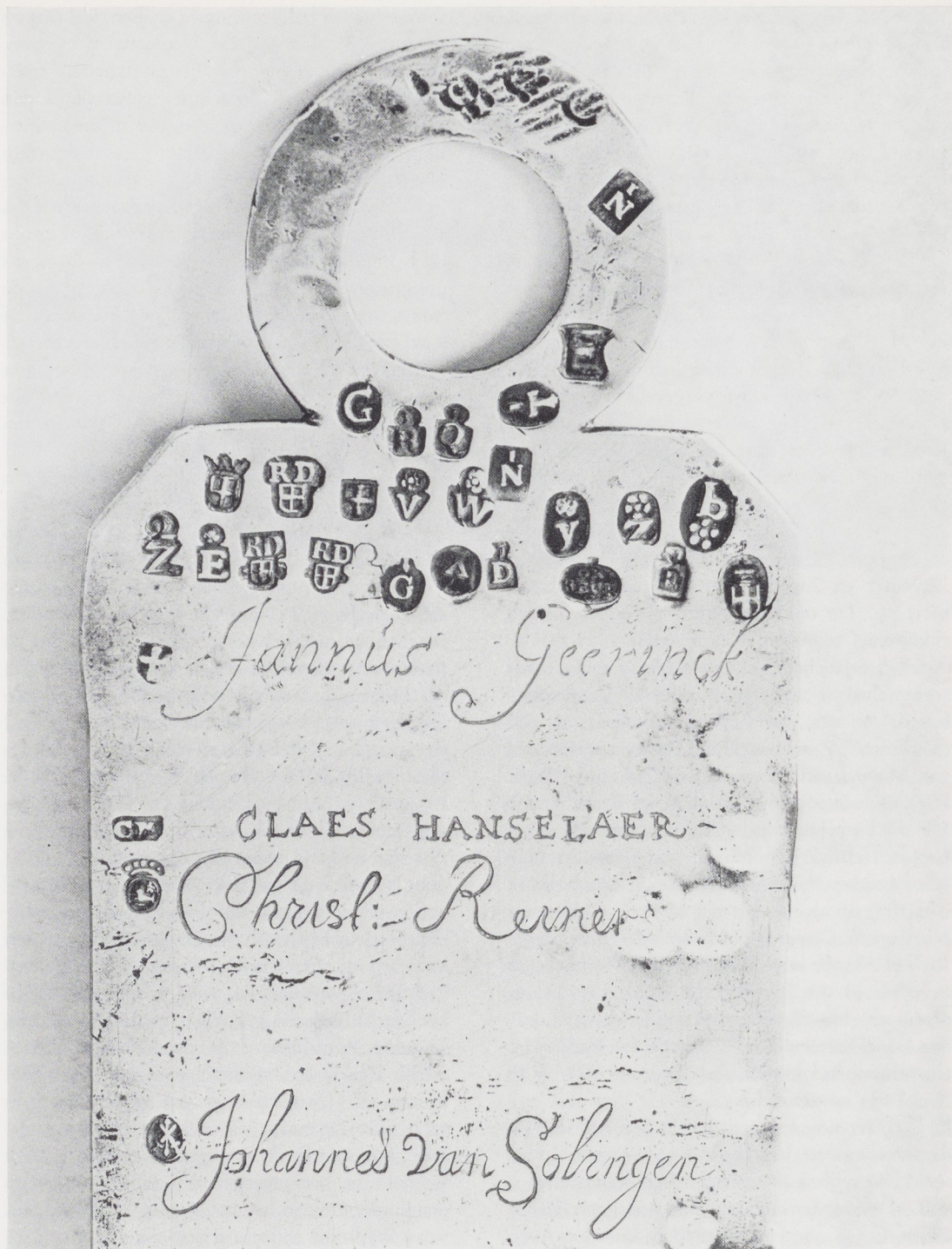
Afb. 5. Detail van de gildeplaat der Zwolse zilversmeden. Provinciaal Overijssels Museum, Zwolle.