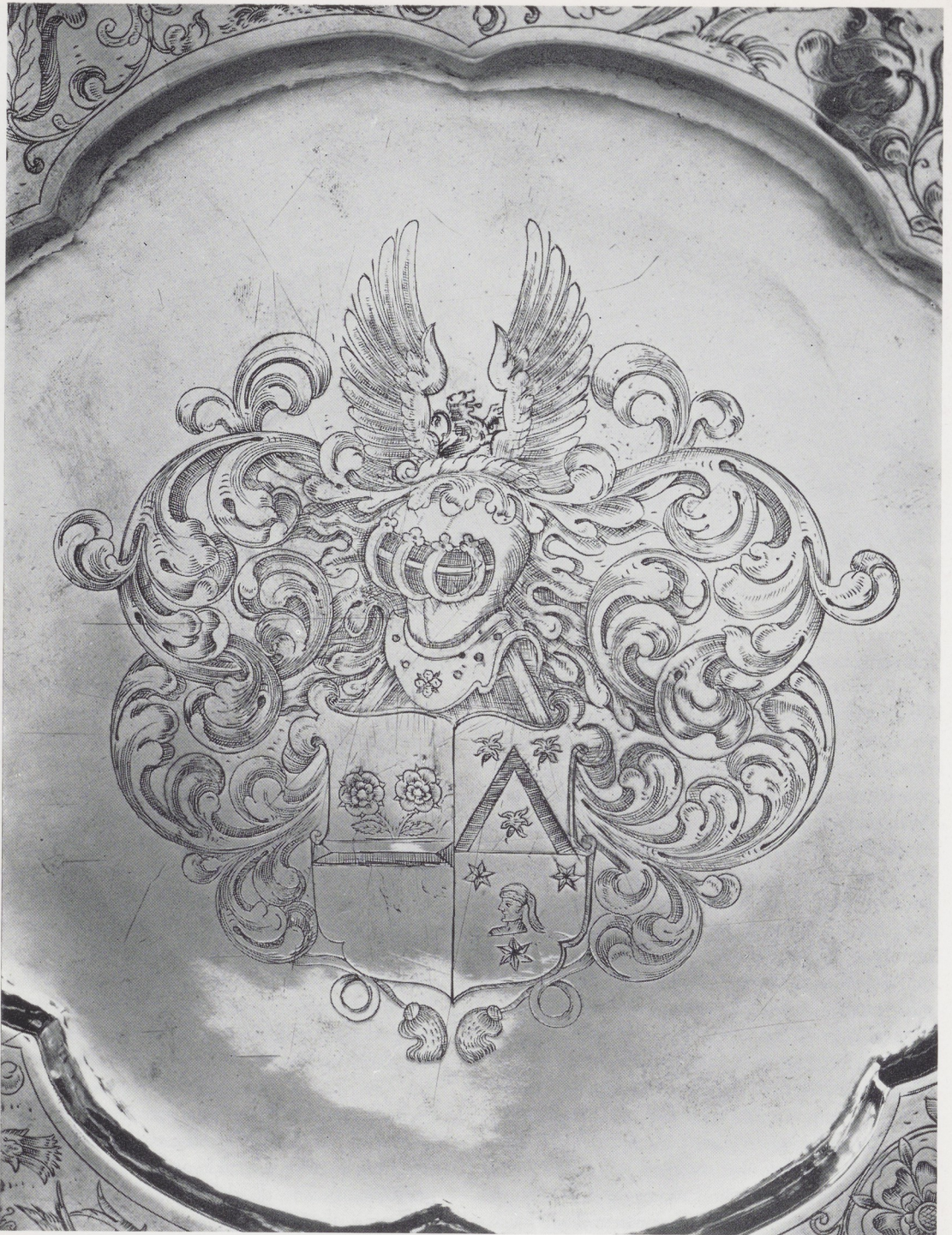
Afb. 7. Alliantiewapen Schickhart-Ter Welberch, detail van afb. 1.