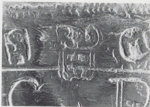
Afb. 3. Merken op de beker van afb. 4.

Hiermede was echter de vraag opnieuw aan de orde wie de schaal dan wèl zou hebben vervaar-