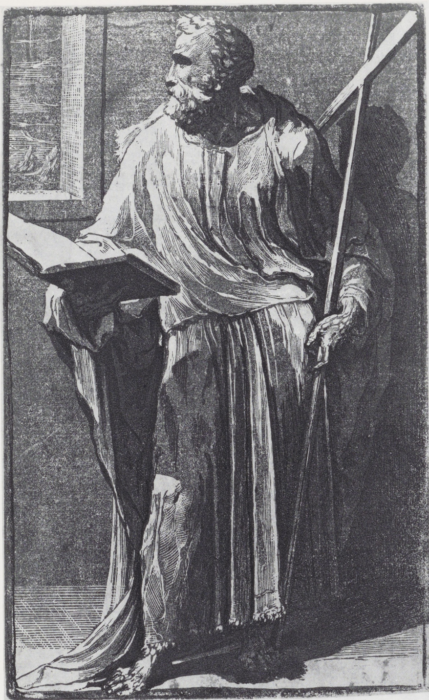
Afb. 6. Domenico Beccafumi (1486-1551). De apostel Philippus. Clairobscuurhout- snede. Geschenk van het F. G. Waller- fonds.