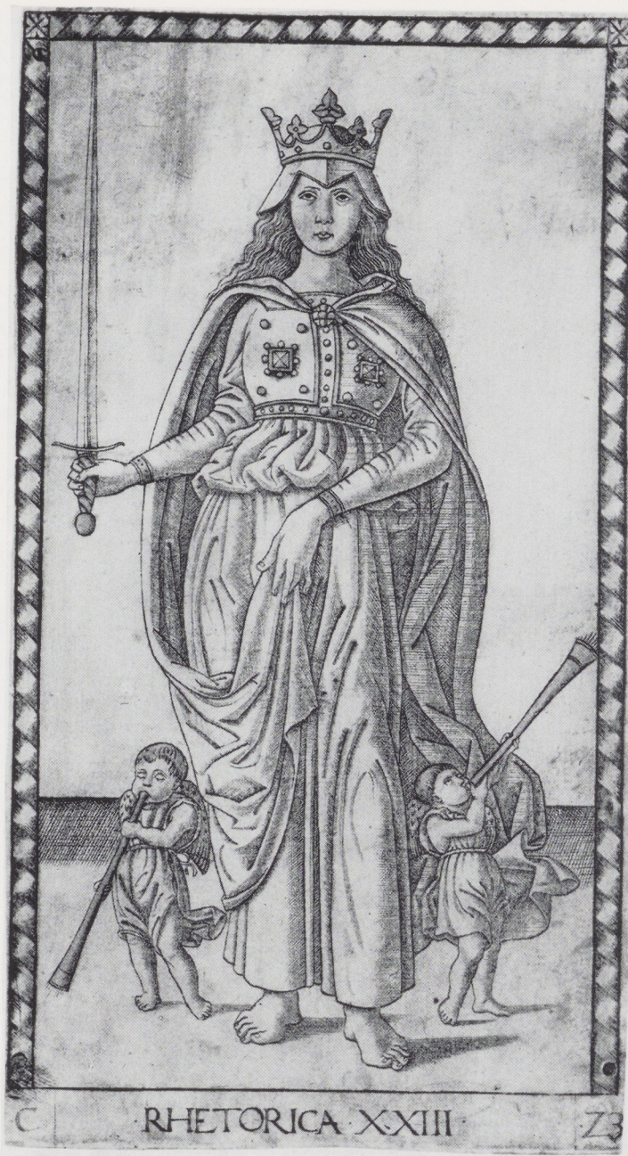
Afb. 5. Anoniem N. Italiaans (15de eeuw). 'Rhetorica XXIII', zgn. Tarochiprent. Gravure. Geschenk van het F. G. Wallerfonds.

KATSUSHIKA HOKUSAI (1760-1849). De Fuji gezien vanuit de theetuinen in Katakura in de provincie Soruga. Uit de serie: 36 gezichten op de Fuji. Kleurenhoutsnede. Terry 33.