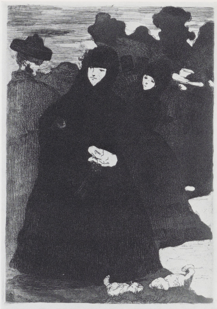
Afb. 4. Edouard Manet (1832-1883). Au Prado. Ets en aquatint, tweede staat. Geschenk van het F. G. Wallerfonds.