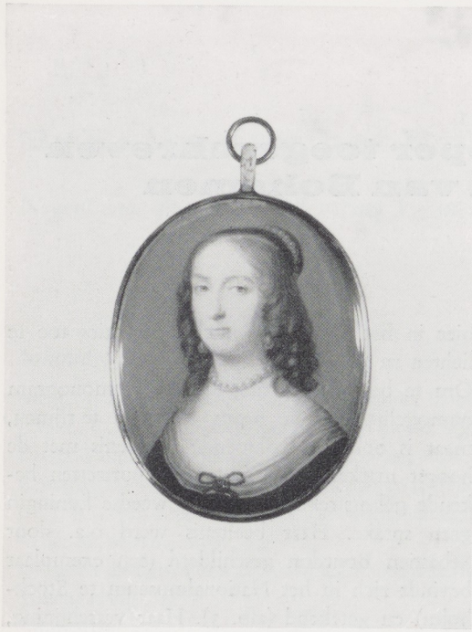
Afb. 1. Alexander Cooper (toegeschreven). De 'Winterkoningin' Elizabeth van Bohemen. Miniatuur 4,5 × 3,6 cm. Rijksmuseum, Amsterdam.