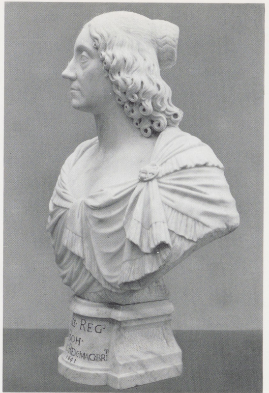
Afb. 5 en 6. François Dieussart (toegeschreven). Elizabeth van Bohemen, 1641. Marmer, hoog ca. 83 cm. Victoria and Albert Museum, Londen.