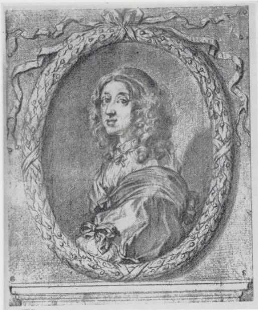
Afb. 3. Sebastien Bourdon. Christina, Koningin van Zweden. Tekening in rood krijt. Musée du Louvre, Parijs.