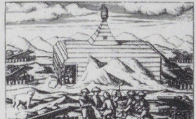
1596 - 3 november De zee voor het laatst gezien. De beren verdwijnen - de vossen komen. Zij leveren vlees en hant voor mutsen