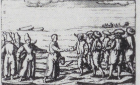
1597 - 28 juli Ontmoeting met Russische vissers. "... de Russen waren erg vriendelijk. Wij waren ontzettend blij en dankten God weer mensen te ontmoeten, die wij 13 maanden niet gezien hadden"