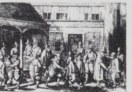
1597 - 1 november Aanloopt te Amsterdam, waar de overlevenden onmiddellijk werden ontzagen door onder meer Pieter Rastolter, één der mitztrekemers van de tocht

1871 De Noorse kapitein E. Carlsen ontdekt Het behouden Huys en keert met honderden voorwerpen uit Nova Zembla terug. Deze behoren thans tot de verzameling Nederlandse Geschiedenis van het RIJKSMUSEUM AMSTERDAM Leyden Wille Schuyt