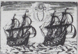
1596 - 5 mei Vertrek uit Amsterdam onder bevel van Willem Barvett en Jacob Heemskerk. Opdracht: Vinde om de Noord van Nova Zembla een noordwestelijke doorvaart naar China 1596 - 4 juni Een wonderlijk natuurschijnsel