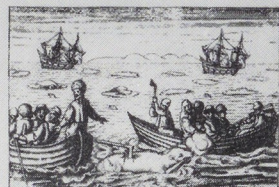
1596 - 12 juni Gevecht met een beer op een onbekend eiland. 'Berremlaan' ontdekt