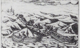
1597 - 13 juni Klaar voor vertrek