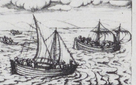
1597 - 19 juli Vertrek van Cruys-iland en wederom enige tijd te behou vastgezeten