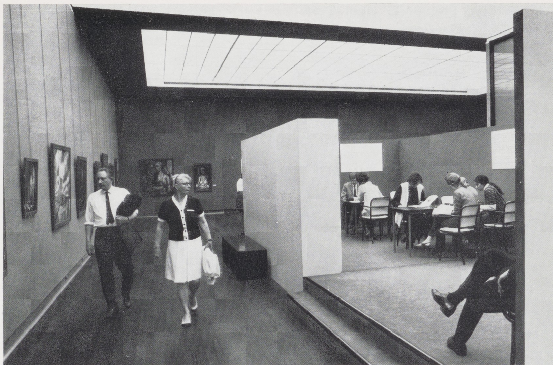
Afb. 2. Lees- en gesprekscentrum in de tentoonstelling 'Oorlog is buiten de Wet'.

ook gedacht aan de volgende mogelijkheid: scholen die daaraan mee willen doen, maken een soort ontwerp voor een tentoonstelling. Hiervan worden de beste uitgekozen, die worden verder uitgewerkt en de inzenders zouden dan de gelegenheid moeten krijgen hun eigen tentoonstelling in het museum in te richten, eventueel met aanvullingen uit de collectie van het museum.