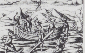
1597 - 29 mei De verzwaakte mannen begonnen met het vertimmeren van de twee kleine boten voor de terugreis