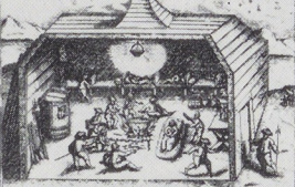
1596 - december Het interieur van Het behouden Huys in het hartje van de winter. "... Deze scheepsdokter maakte een bad om in te stouwen van een winterveld, daar gingen wij allemaal in en merkten dat het heel goed voor onze gezondheid was"