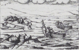
1597 - 17-22 juni De boten moesten bij Lissaven alidweegs over het ijs gestreep worden