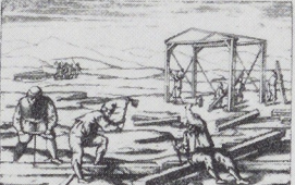
1597 - 25 september Het huis werd gebouwd van drijfhoet, volgens een ontwerp van de timmerman die op 23 september was overleden