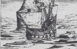
1596 - 26 augustus "... kwamen wij 's avonds aan de westzijde van de Lissaven, waar wij de hote koude winter in grote armoede, alende en verdriet moesten overlijden"