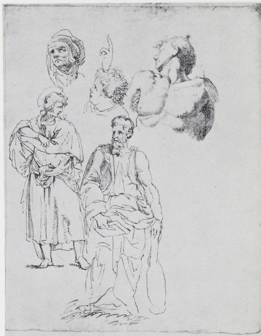
Afb. 3. D. P. G. Humbert de Superville. Studieblad met pentekeningen naar Italiaanse meesters, 205—165 mm. Rijksprentenkabinet, Amsterdam (inv. nr. 1969: 17).

De samenstelling van de verzameling tekeningen, die het Rijksprentenkabinet mocht ontvangen, schijnt in de loop der tijden niet meer geheel in tact te zijn gebleven. Toch zijn er nog twee verschillende ensembles te onderkennen, waarvan