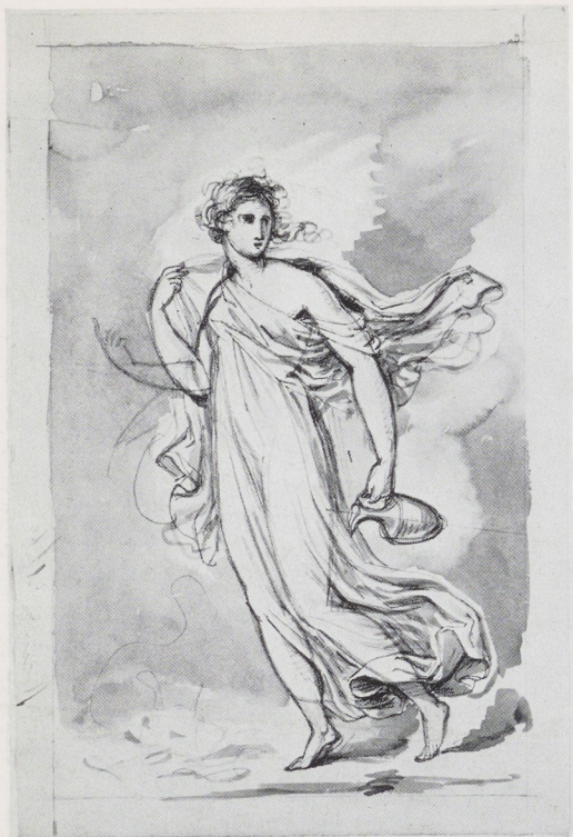
Afb. 4. D. P. G. Humbert de Superville. Hebe. Potlood, penseel in bruin, 250 × 170 mm, verso zwart gemaakt voor het overtrekken. Rijksprentenkabinet, Amsterdam (inv. 1969: 20).