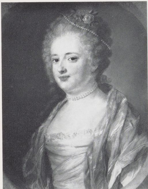
Afb. 5. J. B. Perronneau. Catharina Elisabeth Metayer. Pastel. Rijksmuseum, Amsterdam.