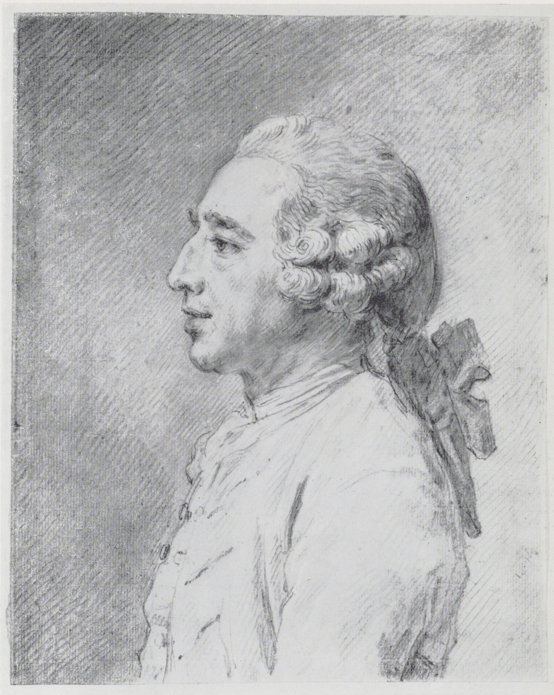
Afb. 1. J. B. Perronneau. Louis Metayer Phzn. Tekening in rood, zwart, wit en geel krijt. Kon. Oudheidkundig Genootschap, Amsterdam.