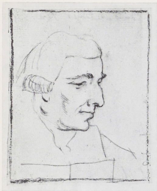
Afb. 2. J. Bernard (?). Louis Metayer Phzn. Tekening in potlood. Kon. Oudheidkundig Genootschap, Amsterdam.