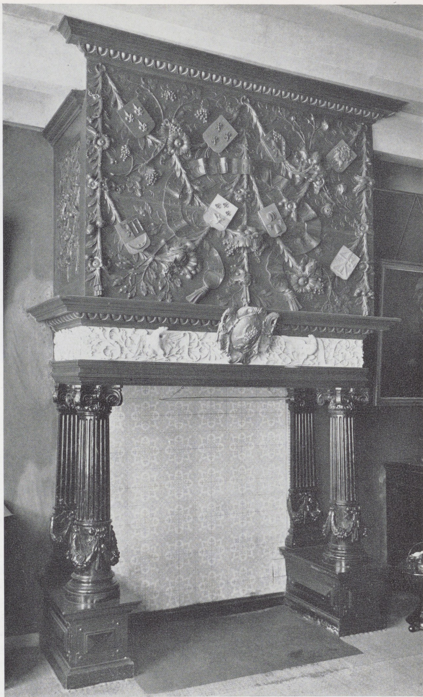
Afb. 3. Schouw. Nieuwe Stadsweeshuis, Leeuwarden.