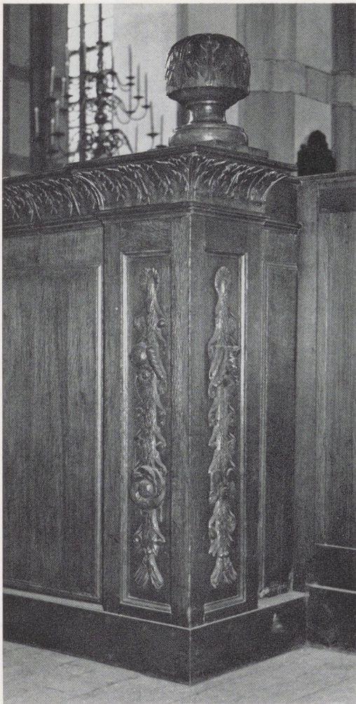
Afb. 6. Zij-aanzicht van afb. 5.