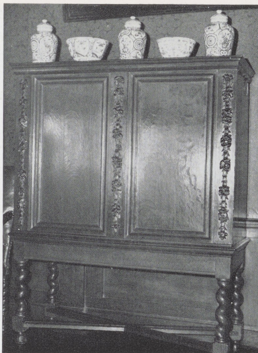
Afb. 4. Eikenhouten kast. Vrouwenhuis, Zwolle.

Uit de aanbesteding blijkt dat Hermannus van Arnhem niet alleen borg was voor de uitvoerder Johannes Hellendoren, maar dat hij ook het snijwerk aan het herengestoelte heeft verricht. In deze festoenen (afb. 8) bezitten wij dus het tot nu toe laatst gedateerde werk van deze houtsnijder. Meer dan in zijn vroegere werk heeft hij zich ondergeschikt gemaakt aan de totale architectuur. De streng gestileerde festoenen, de prachtige rand met bladeren en de forse knoppen passen zich