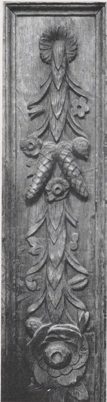
Afb. 8. Detail voorzijde van afb. 5.