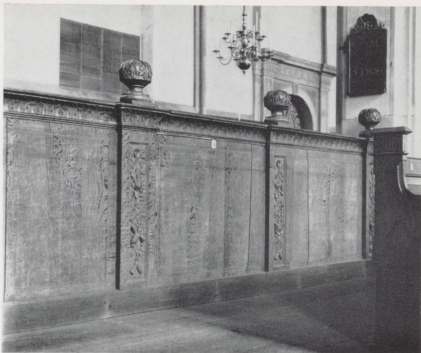
Afb. 5. De herenbanken in de Grote Kerk te Zwolle. Voorzijde.

Het herengestoelte uit 1687 heeft blijkbaar aanvankelijk op dezelfde plaats gestaan als het op de tekening links zichtbare gestoelte. Ook dit had zes pilasters (en zuiltjes) aan de voorzijde. De twee eerste zuilen van de kerk links stonden duidelijk in het gestoelte. Wanneer de nieuwe banken uit 1687 precies zo hebben gestaan, worden allerlei zaken uit het bestek duidelijk, zoals de bekleding van de pilaren (art. 21) en de plaats van de toegangsdeur (art. 22 en 23). Om meer plaatsruimte te winnen vóór de preekstoel heeft men blijkbaar in latere tijd 3/5 van het gestoelte uit 1687 naar achteren geschoven tussen de zuilen, en het overschietende 2/5 gedeelte met copieën aangevuld tot een nieuw, tussen de beide volgende zuilen staand gestoelte.