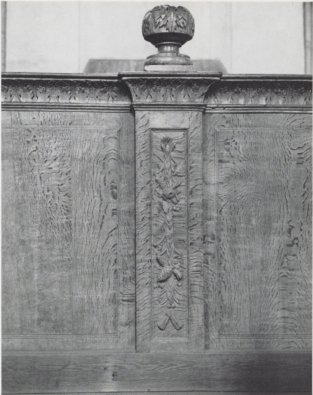
Afb. 7. Detail voorzijde van afb. 5.