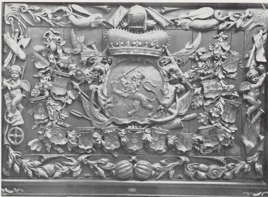
Afb. 1. Wapenbord der Admiraliteit te Harlingen, 150 × 222 cm. Fries Museum, Leeuwarden.

vraag. Het is niet uitgesloten dat Hermannus van Arnhem ook hiervoor het ontwerp heeft geleverd, dat dan door een steenhouwer moet zijn uitgevoerd 4 .