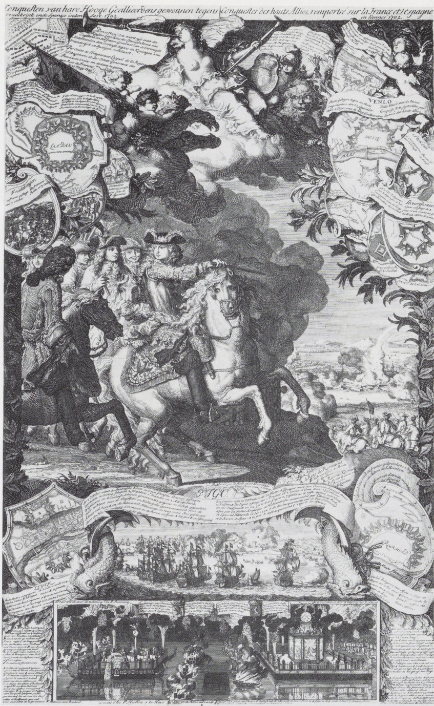
Afb. 8. Daniel Marot. Conquesten van hare Hooge Geallieerdens. Ets. Rijksprentenkabinet, Amsterdam.