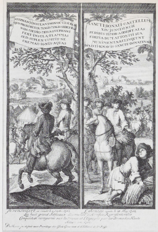
Afb. 2. Daniel Marot. De overgave van Stevensweert en St. Donatius. Ets. Rijksprentenkabinet, Amsterdam.