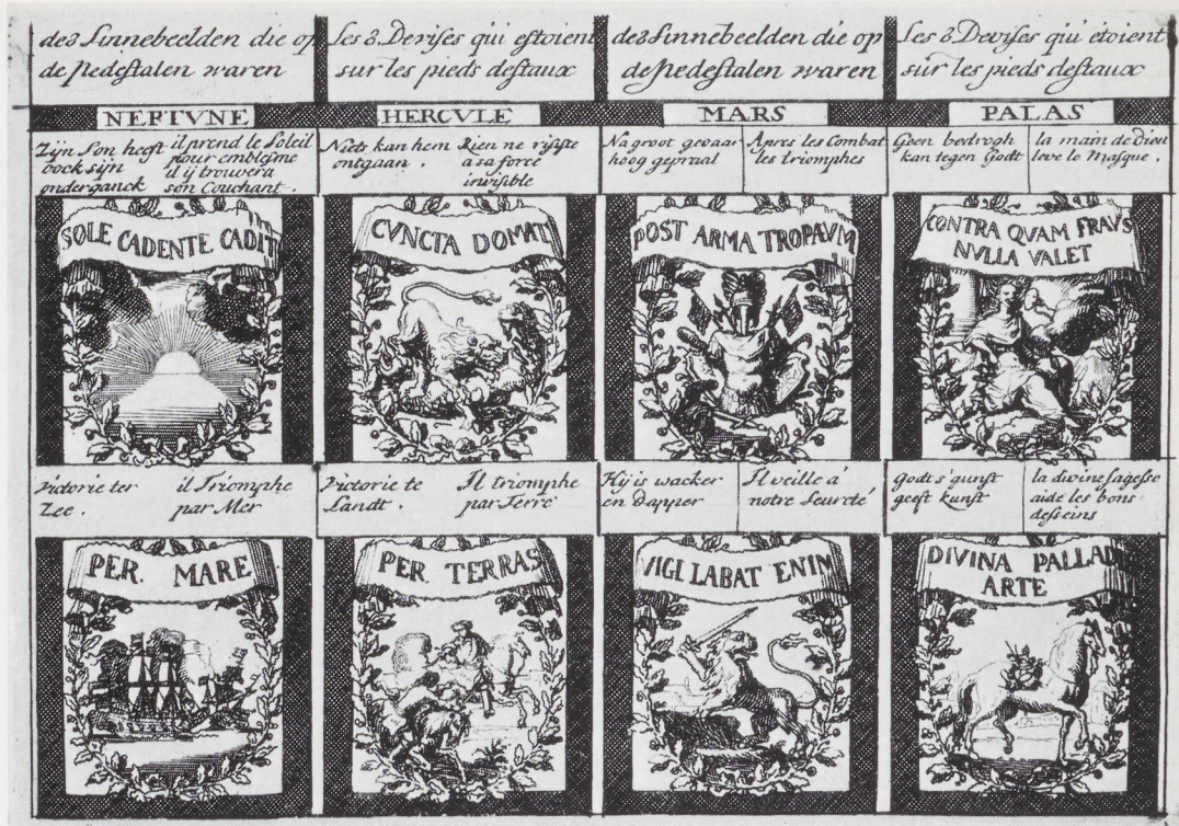
Afb. 9. Daniel Marot. Zinnebeelden. Ets. Rijksprentenkabinet, Amsterdam.

van hare Hooge Geallieerdens', waarop onderaan een beeld van de vuurwerken op de vijver gegeven wordt, een donker als repousoir werkend paard afstekt tegen een lichter paard waarop de veldheer rijdt (afb. 8) 11 . Ditzelfde motief had Lebrun in de Prise de Dunkerque gebruikt. De vier hoeken van het platform werden gemarkeerd door vier grote beelden: Neptunus als heerser van de zee, Hercules de overwinning te land symboliserend, Minerva en Mars als goden van de oorlog. De beelden herinneren sterk aan de ontwerpen voor tuinbeelden, die Marot in zijn verzameld werk heeft uitgegeven. Hun betekenis behoeft nauwelijks nadere uitleg. Op de voetstukken werd deze bovendien nog benadrukt door acht zinnebeelden, eveneens nog in prent bewaard (afb. 9) 8 . Tegen deze eenvoudige maar toch allesomvattende opzet steekt het ontwerp van