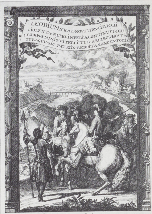
Afb. 7. Daniel Marot. De overgave van Luik. Ets. Rijksprentenkabinet, Amsterdam.