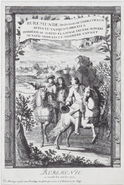
Afb. 5. Daniel Marot. De overgave van Roermond. Ets. Rijksprentenkabinet, Amsterdam.