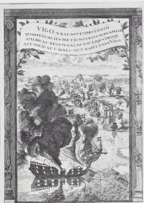
Afb. 6. Daniel Marot. De zeeslag bij Vigos. Ets. Rijksprentenkabinet, Amsterdam.

Expédition de la Flotte d'Espagne avec son Général Amiral de la Flotte de VIGO le 12 Octobre sur la baie d'Anglet et d'Orléans le 1702.