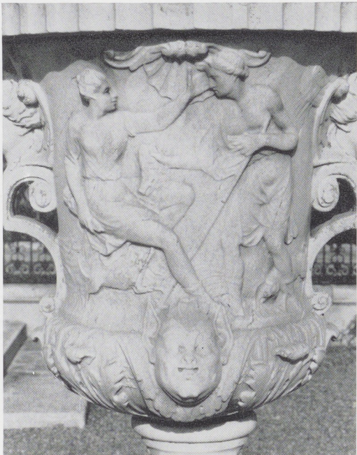
Afb. 23. Atalante en Meleager. Detail van vaas I (zie afb. 18).