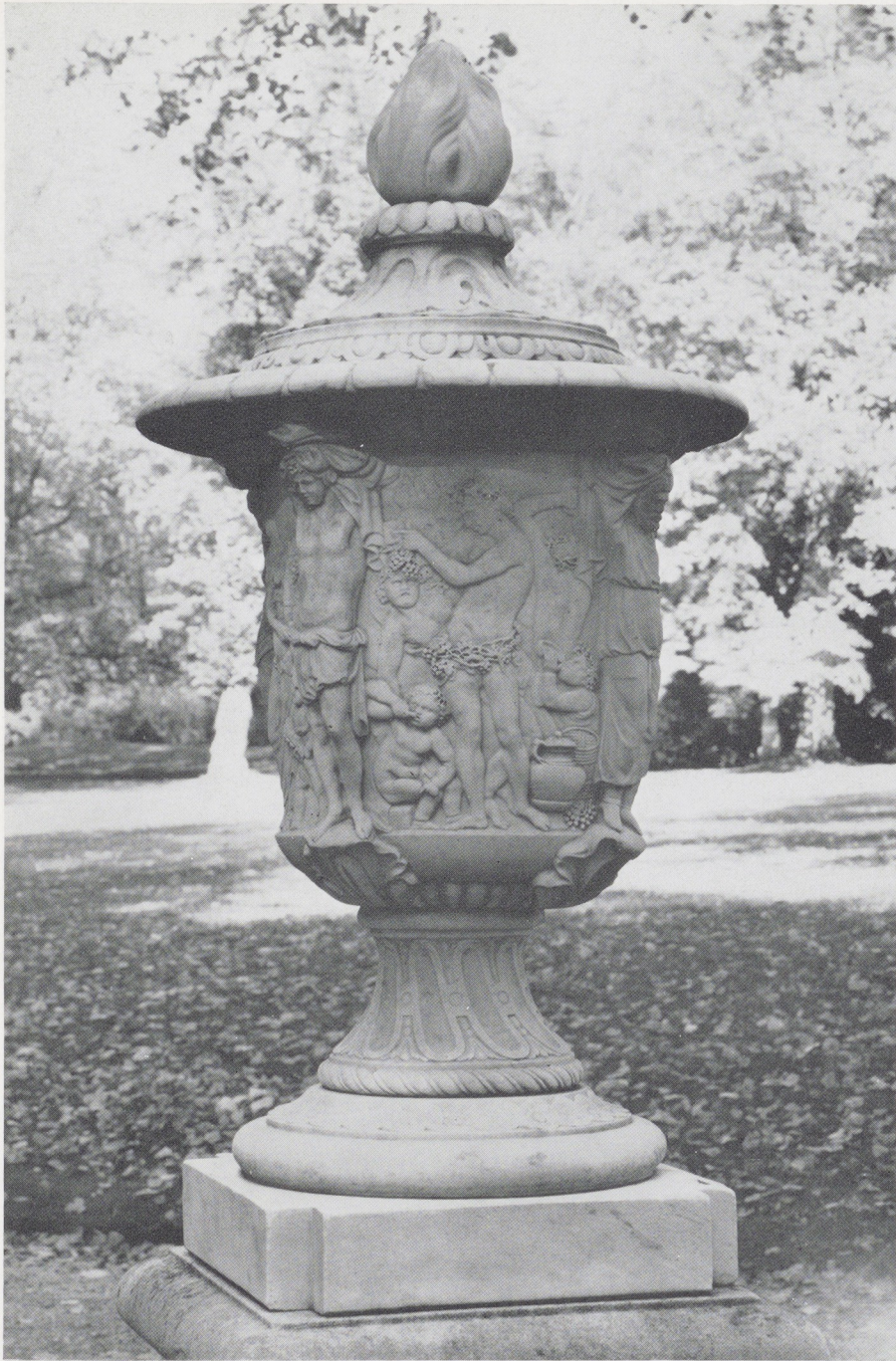
Afb. 13. Marmeren vaas met de Vier Jaargetijden: Herfst (Bacchus en Bacchanten). Noordnederlands, 4de kwart 17de eeuw. Waddesdon Manor.