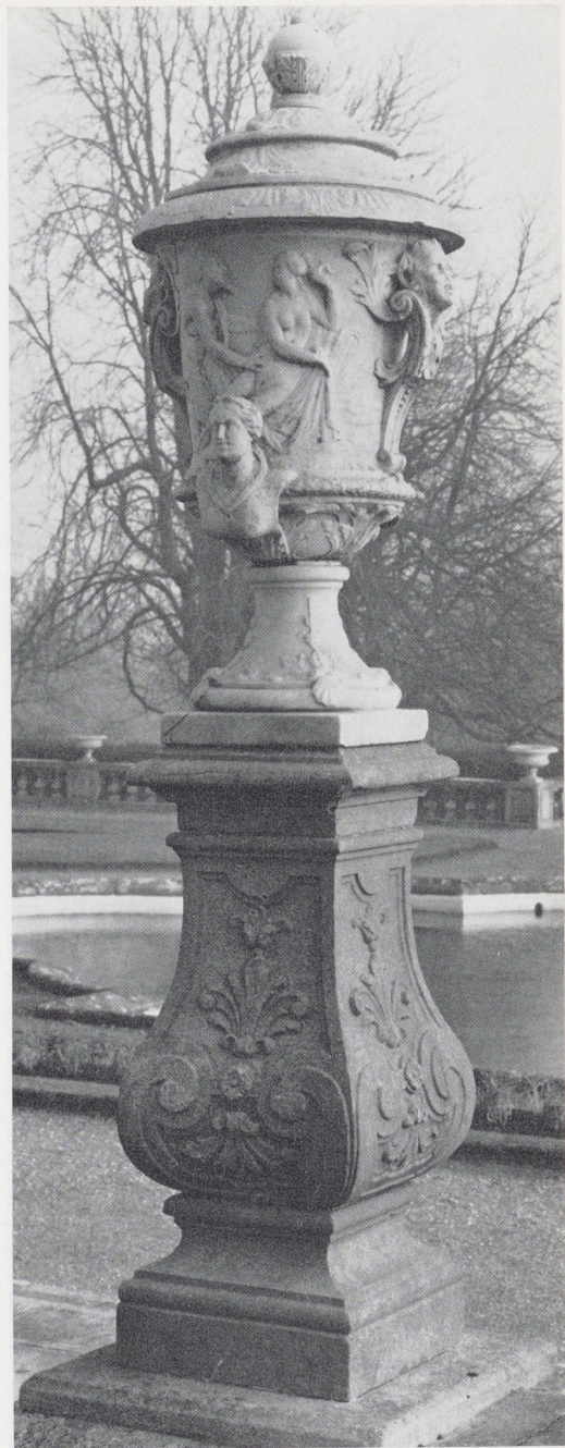
Afb. 19. Werkplaats J. P. van Bourscheit. Marmeren tuinvaas met de voorstelling van Pan en Syrinx (vaas II). H. 129 cm. Waddesdon Manor.