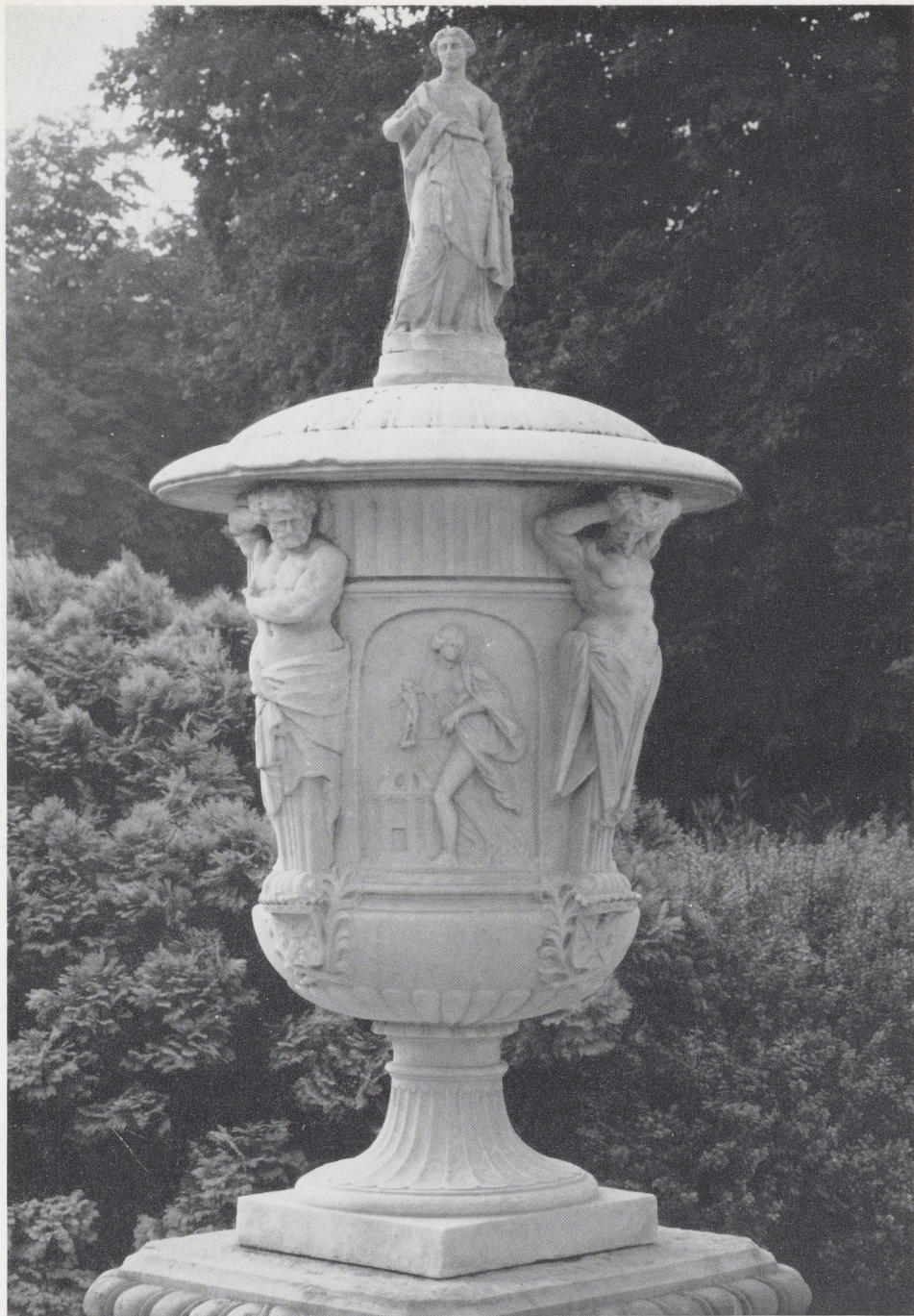
Afb. 2. Artus Quellien. Marmereen tuinvaas met reliëf voorstellende Architectura en Sculptura. H. 157 cm. Waddesdon Manor.