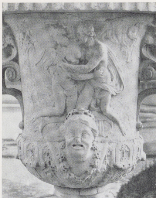
Afb. 20. Jupiter en Callisto. Detail van vaas VI (zie afb. 18).