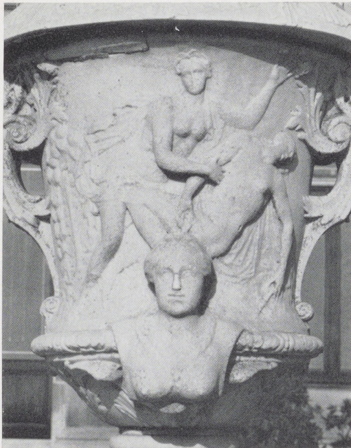
Afb. 24. Venus en Adonis (?). Detail van vaas III (zie afb. 18).