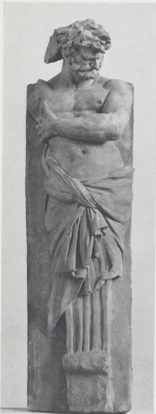
Afb. 3. Artus Quellien. Herme. Schets in terracotta. H. 54 cm. Rijksmuseum, Amsterdam.

sen een bosschage en de rechterflank van het fors geproportioneerde kasteel (afb. 1) 4 . Zij zijn elk opgebouwd uit vier losse delen (afb. 2), nl. uit a. één groot blok bestaande uit plint, voetstuk en romp; b. het deksel, waarop c. een schijfvormige verhoging, met daar weer op d. een klassiek gevormde, staande vrouwenfiguur.