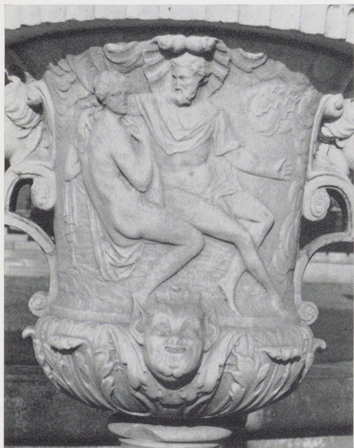
Afb. 22. Jupiter en Io. Detail van vaas IV (zie afb. 18).