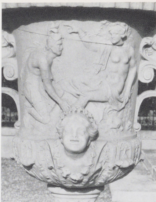
Afb. 21. Perseus en Andromeda. Detail van vaas VI (zie afb. 18).