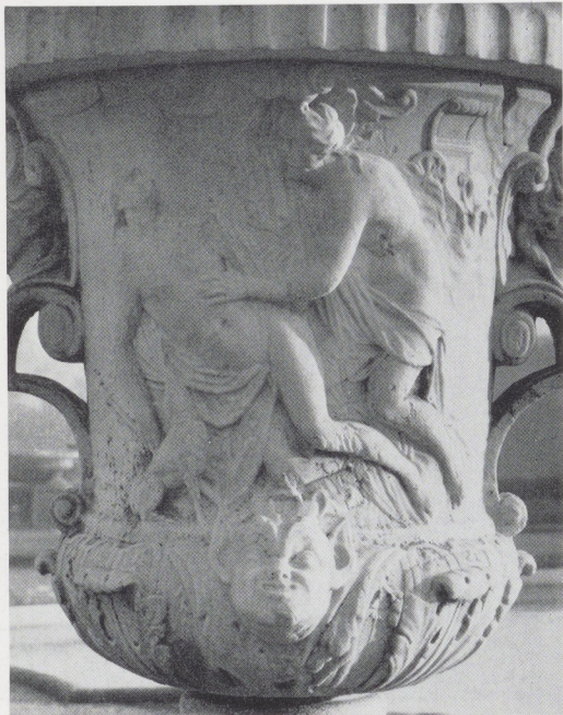
Afb. 25. Venus en Adonis. Detail van vaas IV (zie afb. 18).

land, Duitsland en Engeland er tot nog toe geen in België zijn aan te wijzen 16 .