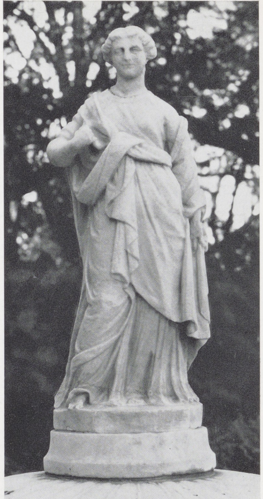
Afb. 12. Prudentia (?). Bekroning van de vaas op afb. 2.

met de beide charmante topfiguren, die vooral in de zo eigen plooiwal van de kleding doen denken aan de bronzen beelden op het dak. Het valt op, dat de koppen bij de halzen als losse delen in de schouders zijn gelaten. Wat hiertoe de aanleiding was, is mij niet duidelijk 5 .