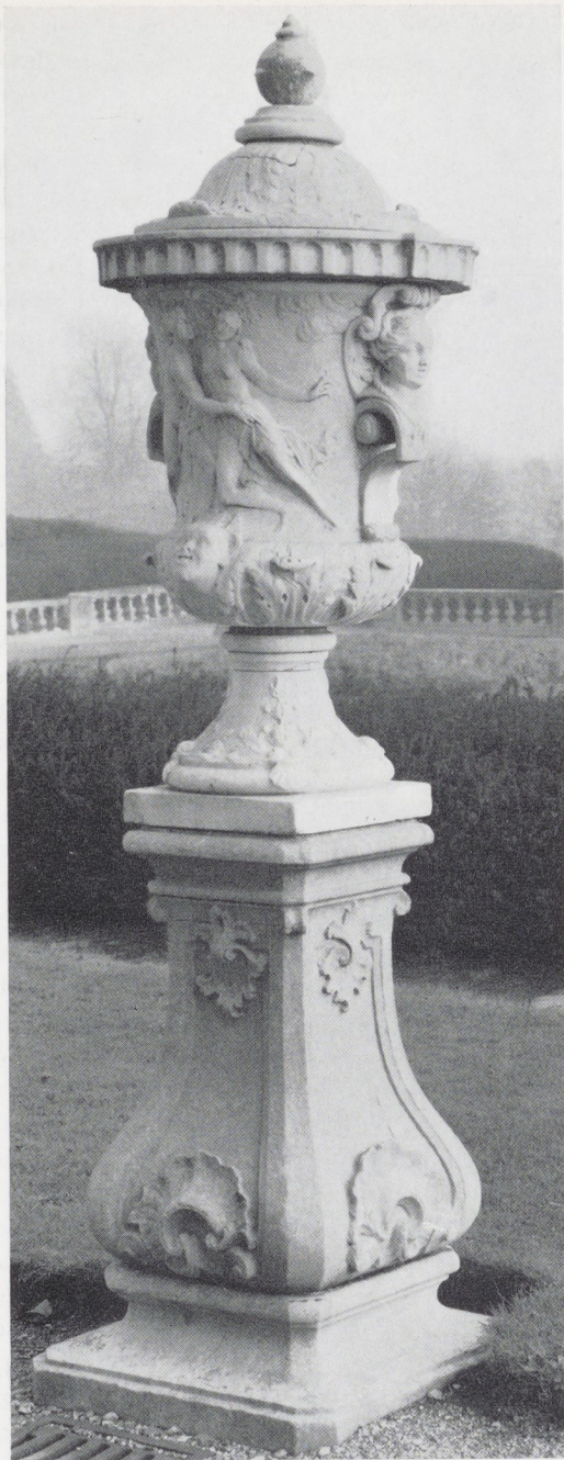
Afb. 18. Werkplaats J. P. van Bourscheit. Marmeren tuinvaas met de voorstelling van Apollo en Daphne (vaas I van een serie van zes). H. 134 cm. Waddesdon Manor.