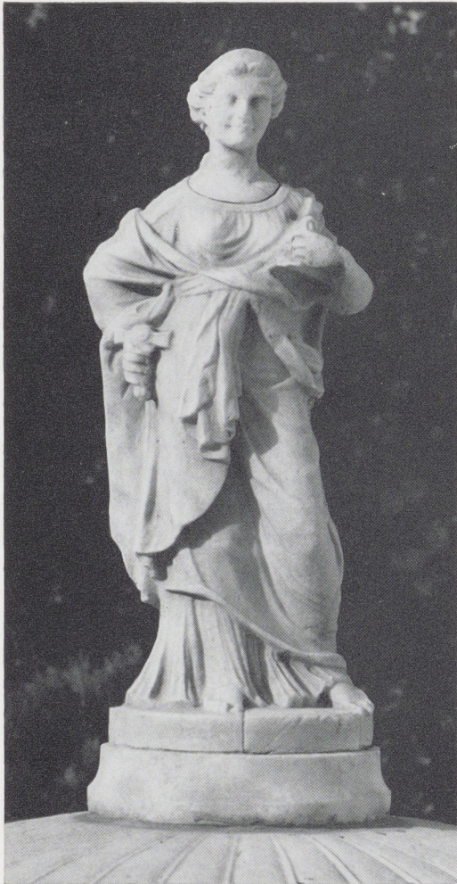
Afb. 11. Justitia. Bekroning van de vaas op afb. 7.