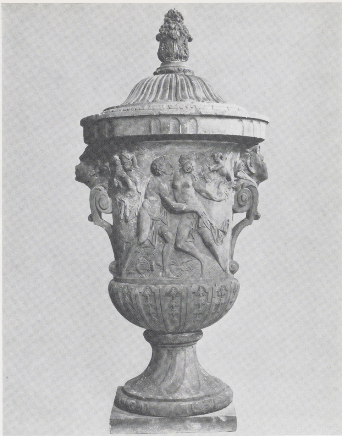
Afb. 17. Jan Pieter van Bauscheit de Oude. Zandstenen tuinvaas. H. 145 cm. Rijksmuseum, Amsterdam.