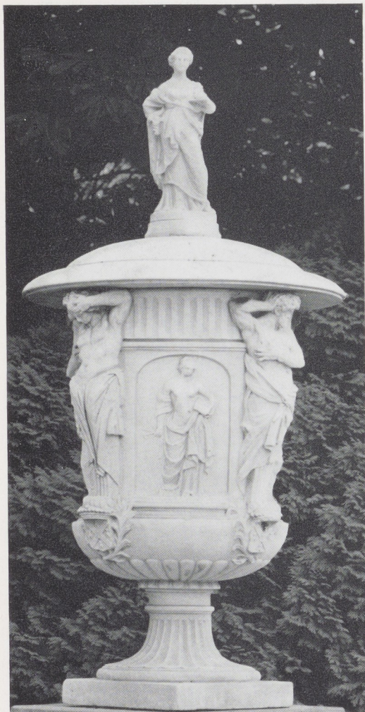
Afb. 7. Artus Quellien. Marmeren tuinvaas met reliëf voorstellende Geometrica. H. 157 cm. Waddesdon Manor.

Ook op het vierde reliëf, Rhetorica, de Reederijk-konst (afb. 6), volgt Quellien de aanwijzingen van Ripa vrij getrouw op: