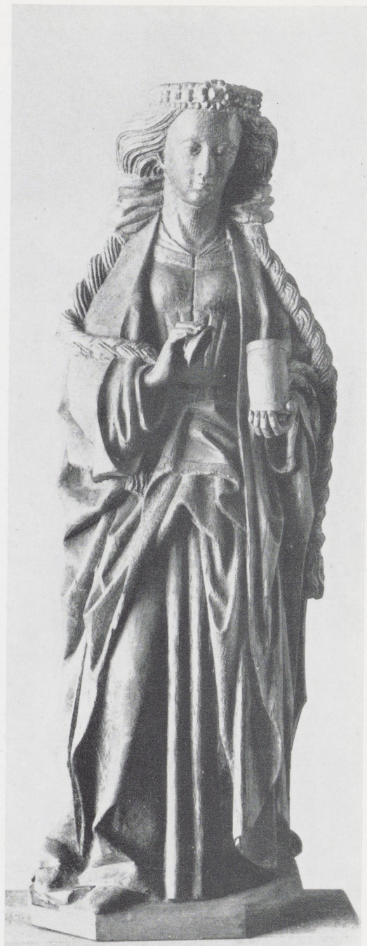
Afb. 5. Maria Magdalena. Noordnederlands, ca. 1480-1490. Eikehout, H. 82,5 cm. Museum, Heidelberg.