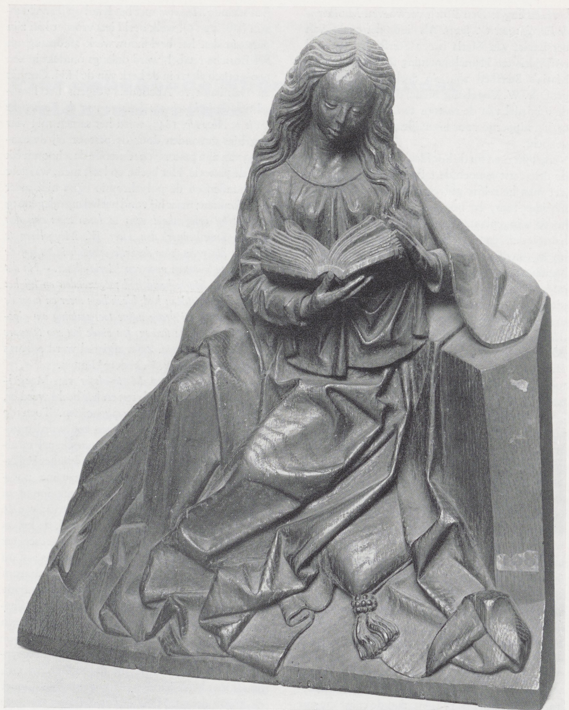
Afb. 1. Adriaen van Wesel. Lezende Maria, rechter deel van een Maria-Boodschap. Eikehout, H. 46 cm. Gruuthusemuseum, Brugge.