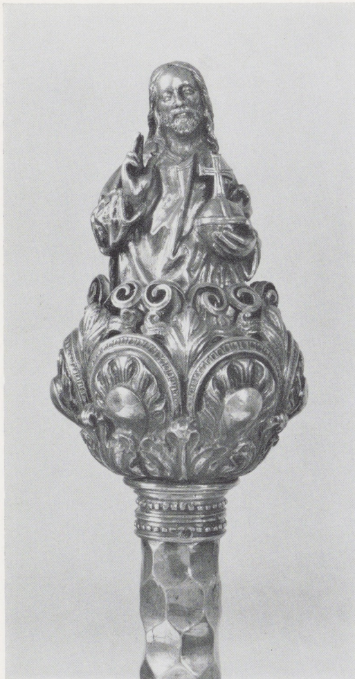
Afb. 10. Ceremoniestaf. Utrecht (?), 1ste helft 16de eeuw. Zilver, H. van de knop 12 cm. Rijksmuseum, Amsterdam.

nislagen en het voetstuk eenmaal waren verwijderd. Het reeds eerder gewekte vermoeden dat het een Utrechts werk moest zijn uit de omgeving van de Meester van de Utrechtse stenen Vrouwenkop, werd er nog door versterkt. Deze anonieme beeldhouwer ontleent zijn naam aan een markante stenen Vrouwenkop in het Aartsbisschoppelijk Museum te Utrecht 12 . Typerend voor deze Utrechtse beeldhouwer zijn de wat plompe volle vormgeving van zijn figuren en de