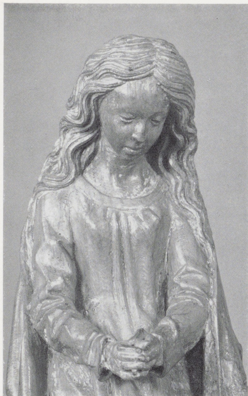
Afb. 2. Adriaen van Wesel. Detail van Knielende Maria. Eikehout. Rijksmuseum, Amsterdam.

kleed wordt opgehouden, zodat een slip van de mantel voor haar rechterknie hangt.