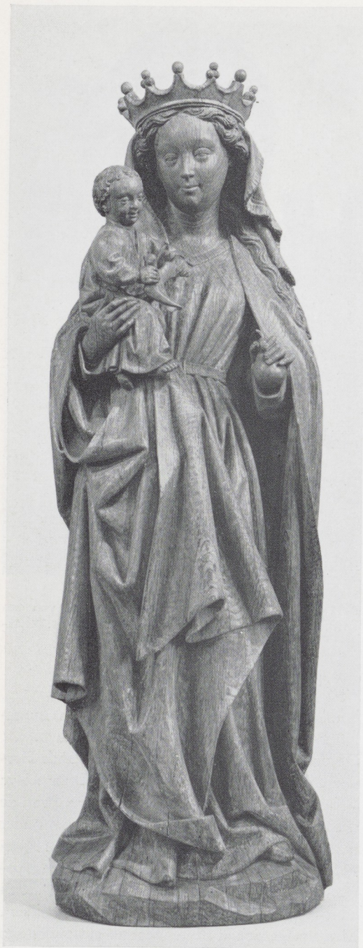
Afb. 4. Maria met Kind. Noordnederlands (Hollands?), ca. 1470. Eikehout, H. 92,5 cm. R.K. Kerk, Abcoude.