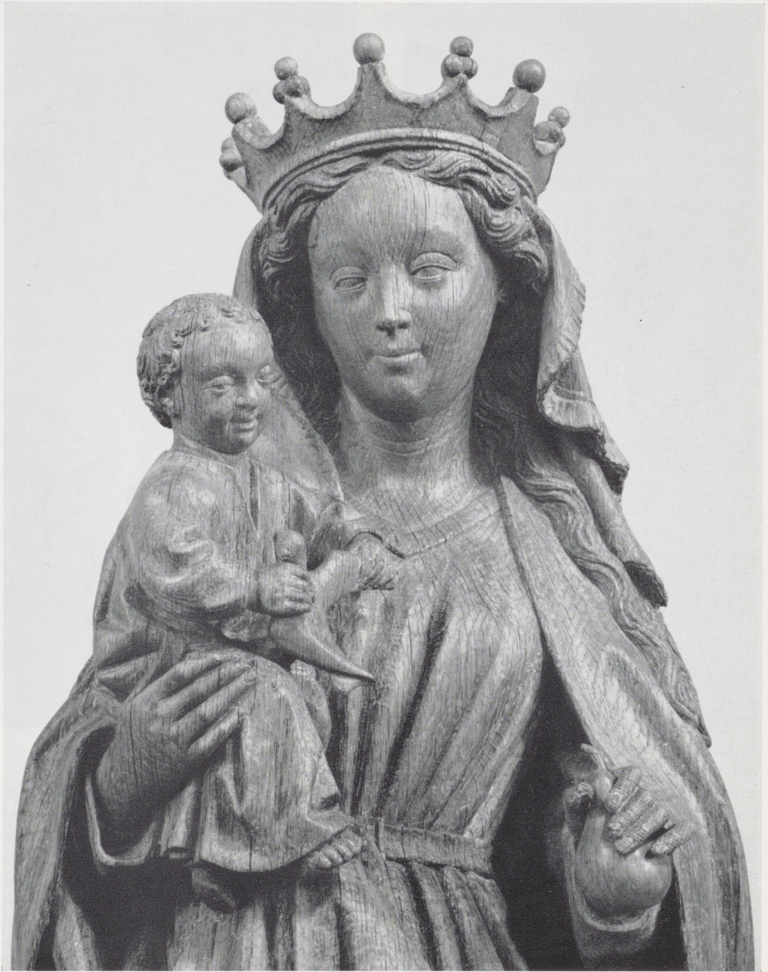
Afb. 6. Detail van afb. 4.