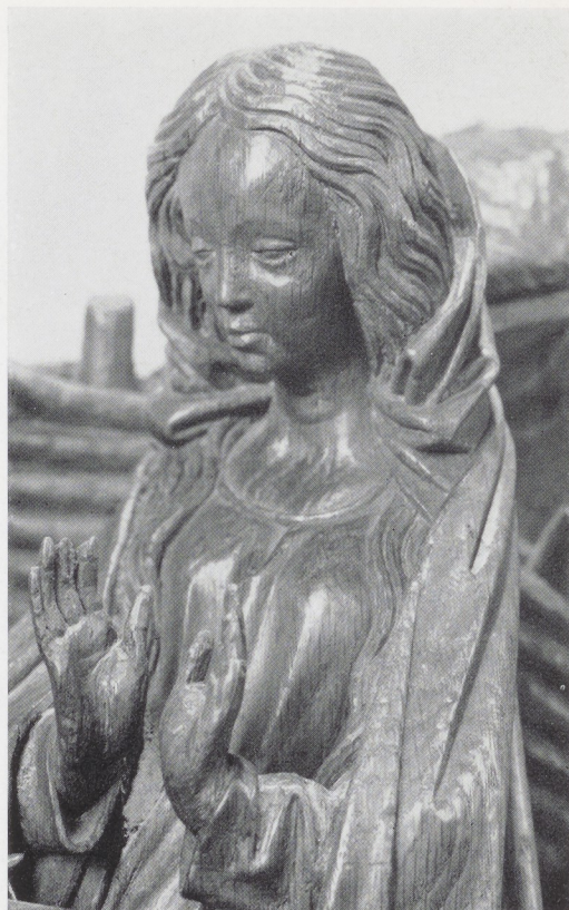
Afb. 3. Adriaen van Wesel. Maria, detail van een Ontmoeting van Maria en Elisabeth. Eikehout. Rijksmuseum, Amsterdam.

Geplaatst naast het naar het gracieuze neigende werk van Adriaen van Wesel uit Utrecht, de stad van bisschop David van Bourgondië, valt het Madonnabeeld op door een meer gesloten vormgeving. Zeker staat het ver verwijderd van de sculptuur aan de Nederrijn met haar opwaaiende kleding en soms wat karikaturale uitdrukking in gelaat en gebaren, en al even ver van die van de Zuidelijke Nederlanden, die minder gedrongen van vorm is en wat gracieuzer en soepeler van karakter dan het meer houtserige, op kleinere schaal geconcipieerde werk van de noorderling. Wij