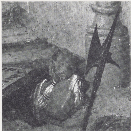
Afb. 1. Meester van de H. Elisabeth. De inneming van Rhenen. Rijksmuseum, Amsterdam.