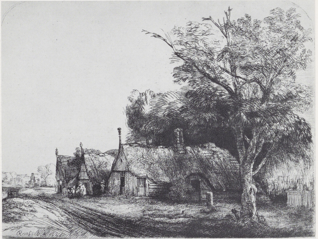
Afb. 2. Rembrandt. De drie hutten, ets en droge naald, 1650. Rijksprentenkabinet, Amsterdam.