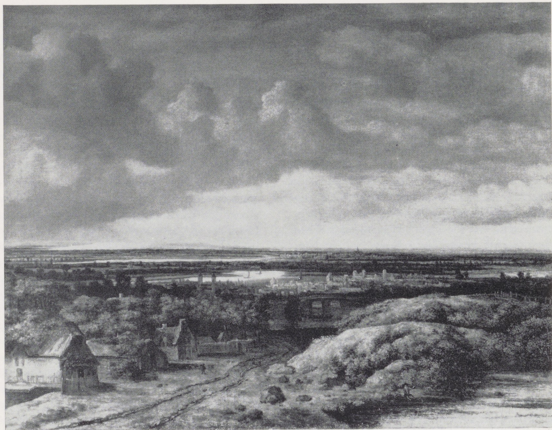
Afb. 1. Philips Koninck. Vergezicht met hutten aan de weg, 1655. Rijksmuseum, Amsterdam.