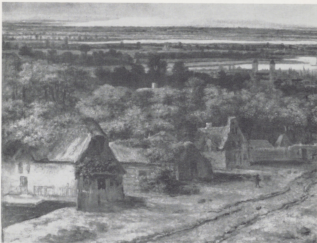
Afb. 3. Detail van afb. 1.