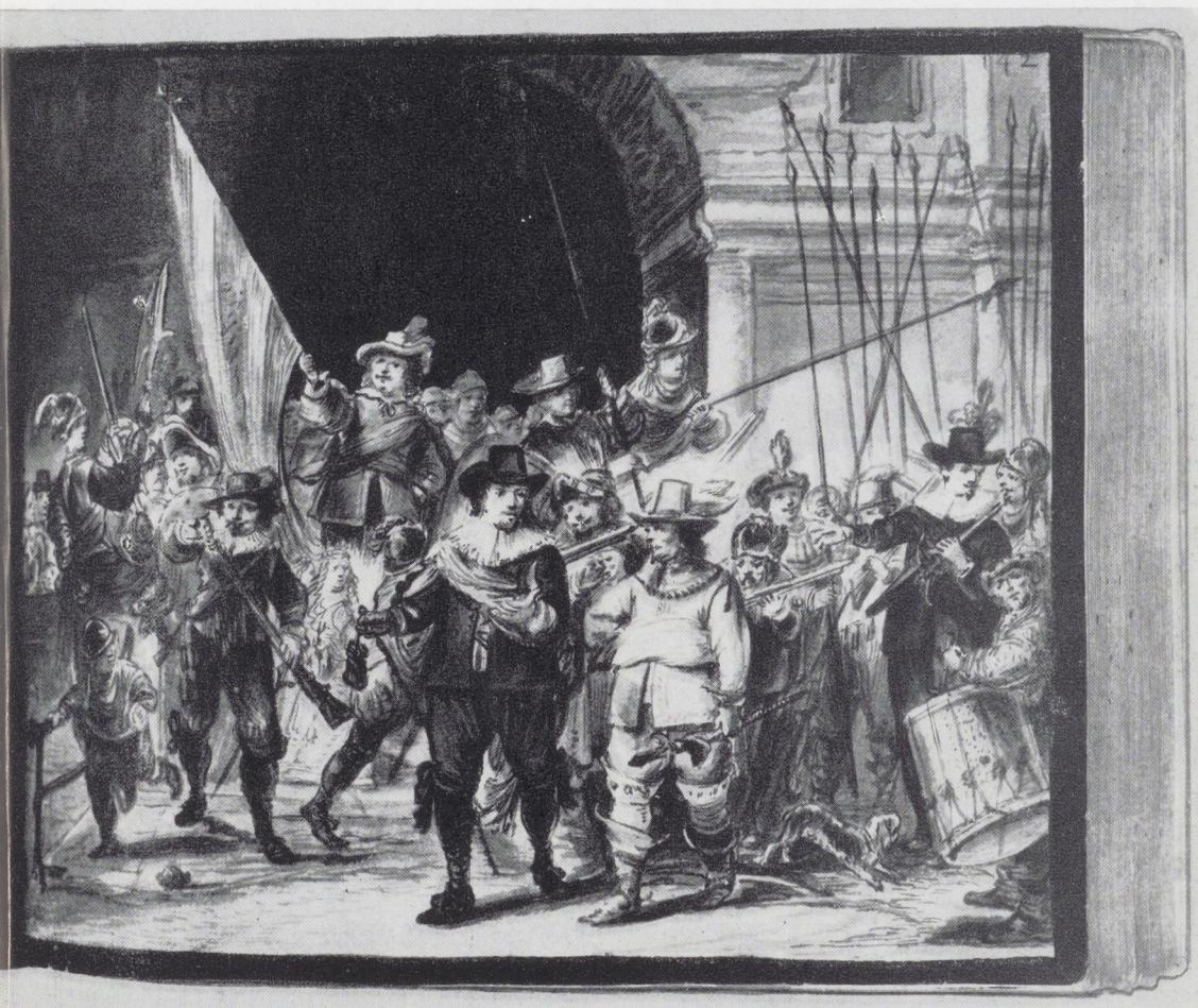
Amsterdam (bruikleen van de fam. De Graeff).