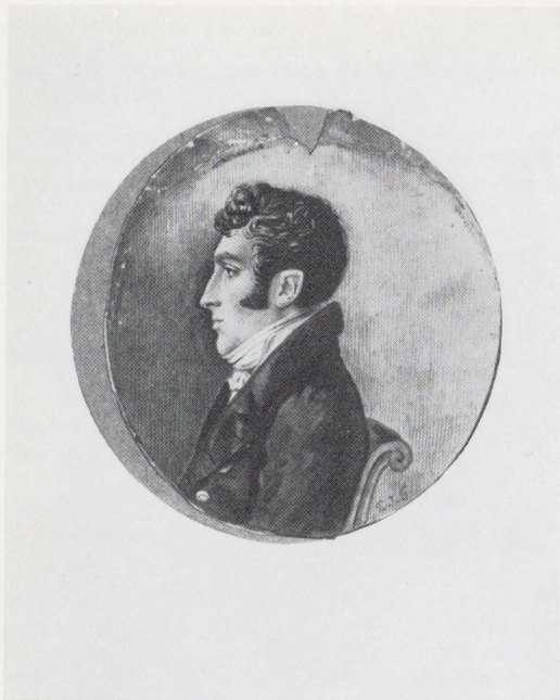
Afb. 2. Het portretje van afb. 1, reconstructie oorspronkelijke omvang.

spronkelijke gedaante een evenwichtiger aanzien had. Er is nog een secundaire overweging, die bij de toetschrijving aan Gabriël een rol speelt. In opzet doet dit miniatuur sterk denken aan de kleine physionotraceportretjes, eveneens profielletjes en met een meestal cirkelvormige, soms ovale omtrek, die toentertijd zeer en vogue waren en die speciaal in Parijs werden gemaakt 1 . In ons prentenkabinet worden tal van deze 'kiekjes' uit de tijd tussen 1790 en 1830 bewaard (afb. 4). Het kan haast niet anders of de jonge Gabriël met zijn beoefening van de portretminiatuurkunst heeft zich voor zoiets als de physionotrace geïnteresseerd. Indien hij niet al in ons land, nog vóórdat hij in 1805 naar Parijs ging, iets, hetzij van de geïmporteerde, hetzij van de kort vóór 1800 ook in Den Haag door Gonord vervaardigde physionotrace-pretjes gezien heeft, dan moet toch zeker zijn verblijf in Parijs hem de welkome gelegenheid verschaft hebben zich terdege van die praktijk en haar resultaten op de hoogte te stellen en zich erdoor te laten inspireren. De physionotrace-achtige vormgeving van ons portretje laat zich dan ook verklaren als men P. J. G. voor de kersvers uit Parijs teruggekeerde P. J. Gabriël mag houden. Bij een poging tot identificatie van de voorgestelde hadden wij gelegenheid een aantal andere, wel bekende familieportretten uit de boedel van de erflaatster, die thans berusten bij de Dienst voor 'sRijks verspreide kunstvoorwerpen in Den Haag, ermee te vergelijken.