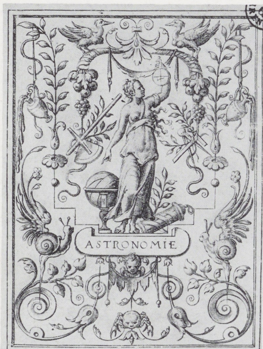
CVM PRIVILEGIO REGIS · STEPHANVS · F · 6