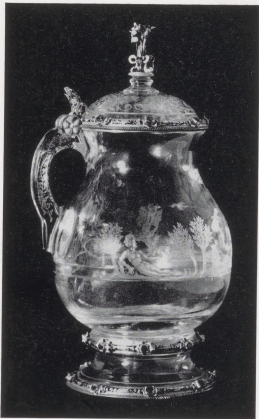
Afb. 21. Kannetje van bergkristal. Grünes Gewölbe, Dresden.

die, welke in de Zuidduitse steden München of Augsburg gedrukt werden.