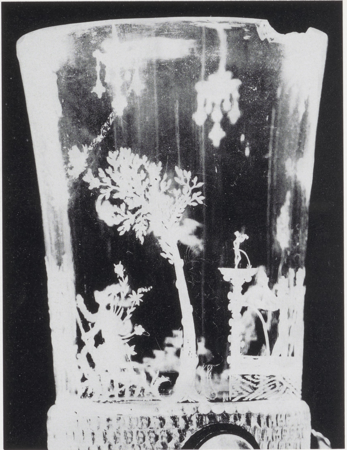
Afb. 14. Detail afb. 1.