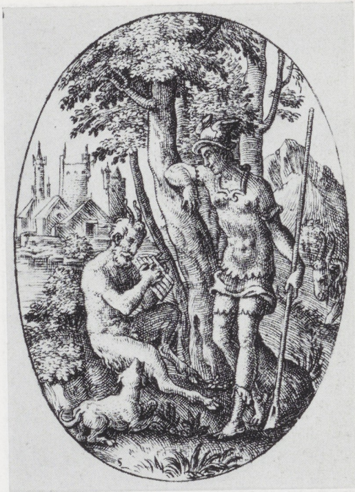
Afb. 5. E. Delaune. Mercurius en Pan. Gravure. Albertina, Wenen.

rechts (afb. 9) en zo zijn er meer kleinigheden. Onder dit mythologische verhaal zitten drie cabochons, de vierde is verdwenen. Deze zijn bevestigd met smalle gouden bandjes, versierd met blauw émail in champlévé techniek. Grillige gouden ranken zijn in het blauwe veld uitgespaard. Hetzelfde motief keert terug bij de gouden ringen om de voet. Op de cabochons staan symbolen van de vier elementen: Water (vissen aan een snoer, afb. 8), Vuur (brandende lamp, afb. 1) en Lucht (een blaasbalg). Op de plaats van de verdwenen cabochon, waarop het element Aarde was afgebeeld, is een gladgeslepen iets concaaf ovaal te zien. In het ovaal zijn twee gaatjes geboord voor pinnetjes om het gouden montuur vast te houden; in het