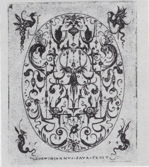
Afb. 16-17. Corvinianus Saur. Twee ornamentprenten, 1594 (naar Jessen, Meister des Ornamentstichs, I, 119).