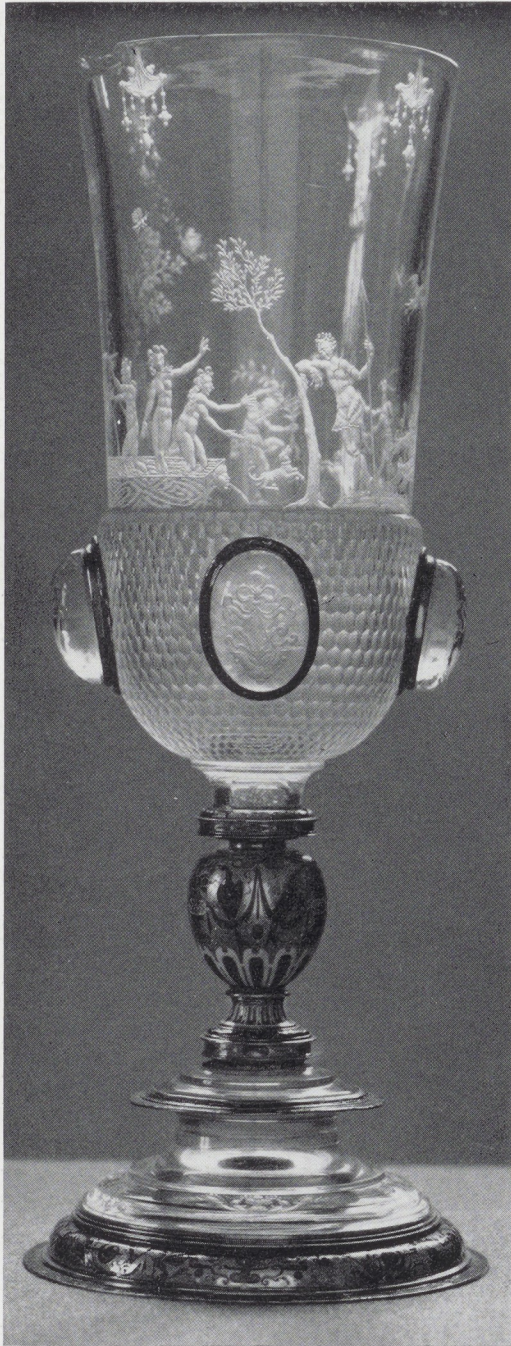
Afb. 1. Bokaal van bergkristal met geëmailleerd gouden montuur. H. 22,4 cm, Diam. 8,5 cm. Rijksmuseum, Amsterdam.