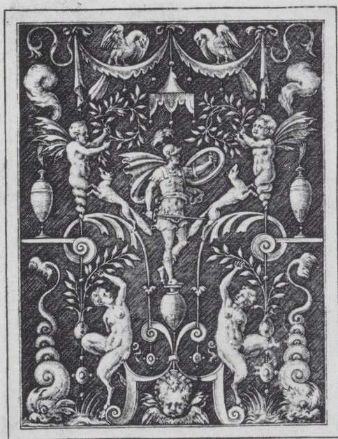
CVM · PRIVILEGIO · REGIS · STEPHANVS · FECIT ·

Afb. 12. E. Delaune. Mars. Gravure. Rijksprentenkabinet, Amsterdam.