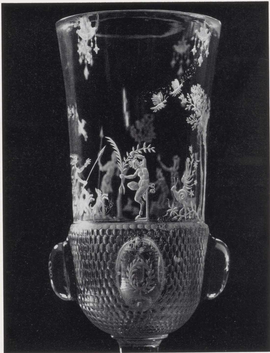
Afb. 11. Detail afb. 1.