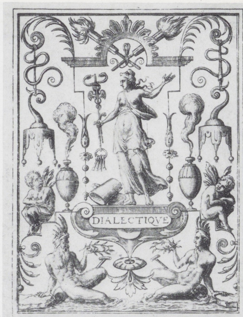
CVM PRIVILEGIO REGIS · STEPHANVS · F · 7