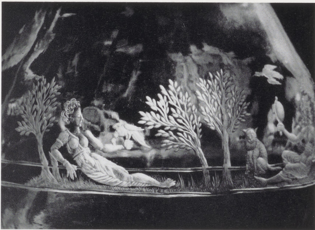
Afb. 22. Detail afb. 21.

Kaspar Lehmann, de enige Duitse graveur van niveau – oorspronkelijk afkomstig uit de omgeving van Dresden – was een van hen 13 , maar ook met zijn werk heeft de bokaal geen verwantschap, evenmin als met het werk, dat afkomstig is uit het atelier van de familie Miseroni, die keizer Rudolf II vanuit Milaan naar Praag liet overkomen 14 .