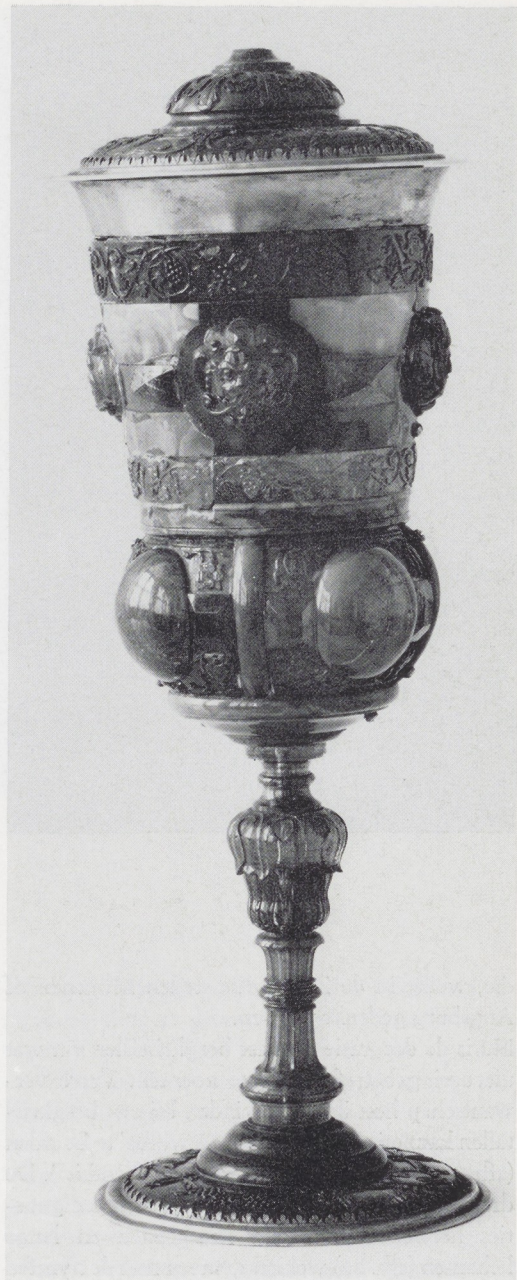
Afb. 20. Bokaal van barnsteen. Johann Kohn, Koningsbergen, ca. 1640. Kungl. Husgeräds-kammaren, Stockholm.