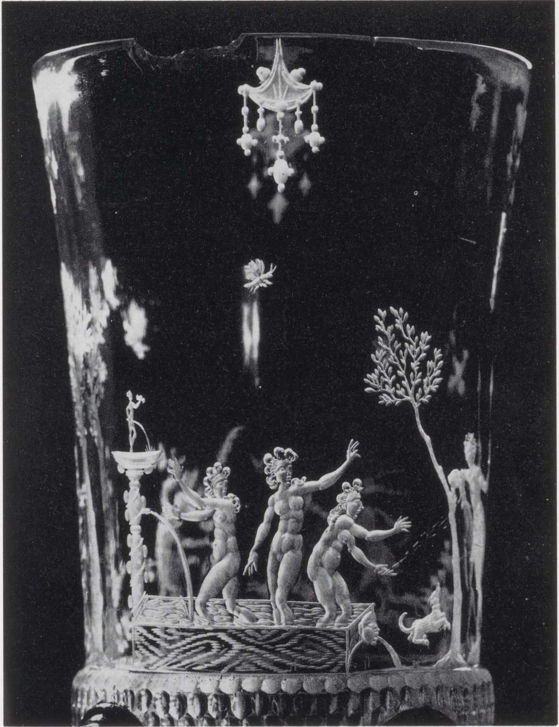
Afb. 2. Detail afb. 1