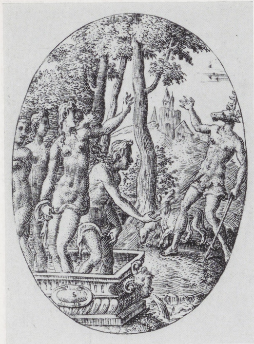
Afb. 4. E. Delaune. Actaeon en Diana. Gravure. Albertina, Wenen.