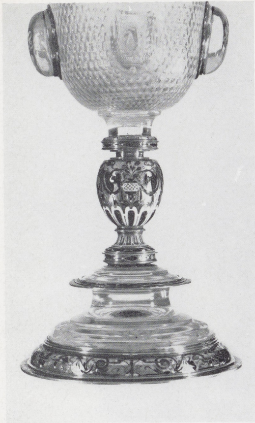
Afb. 15. Detail afb. 1.