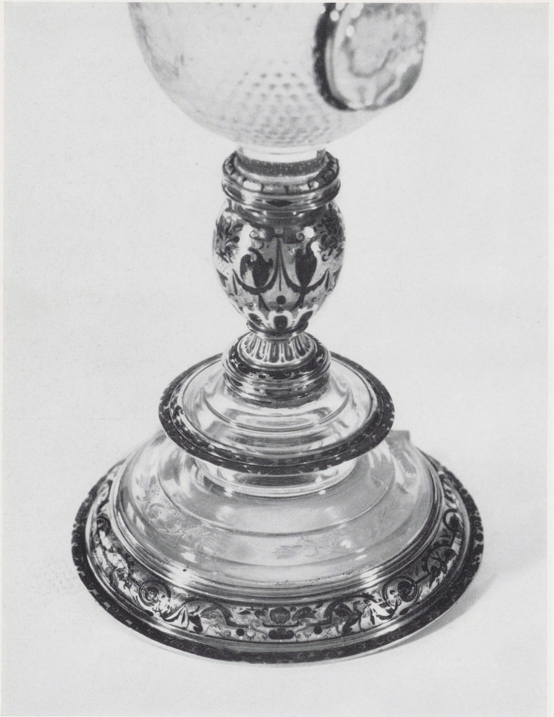
Afb. 18. Detail afb. 1.