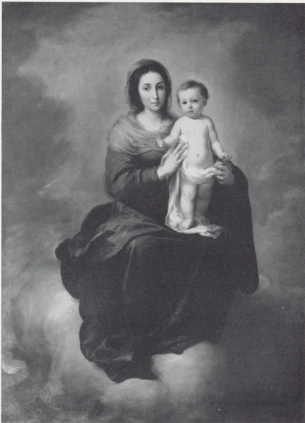
Afb. 2. B. E. Murillo. Madonna met kind. Rijksmuseum, Amsterdam.