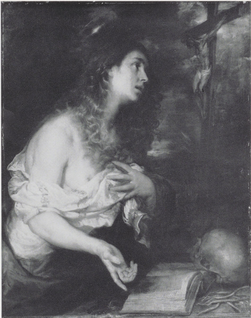
Afb. 4. M. Cerezo. De boetvaardige Magdalena, 1661. Rijksmuseum, Amsterdam.