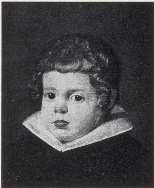
Afb. 9. J. B. M. del Mazo. De infant Balthasar Carlos? Rijksmuseum, Amsterdam.