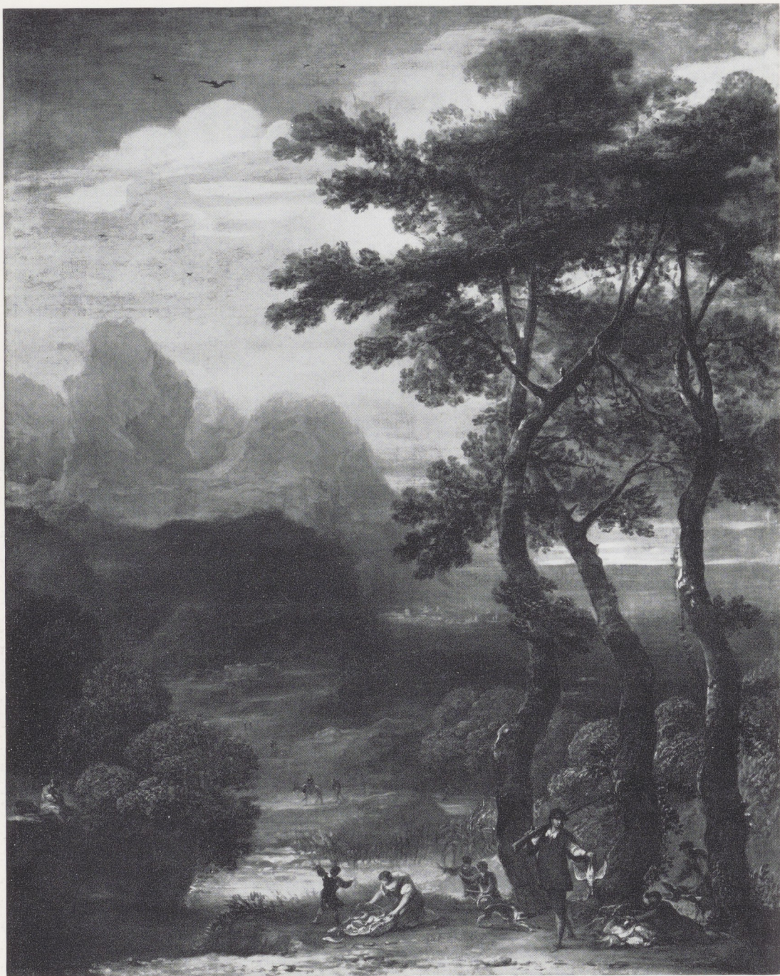
Afb. 5. Spaanse School. Landschap. Rijksmuseum, Amsterdam.