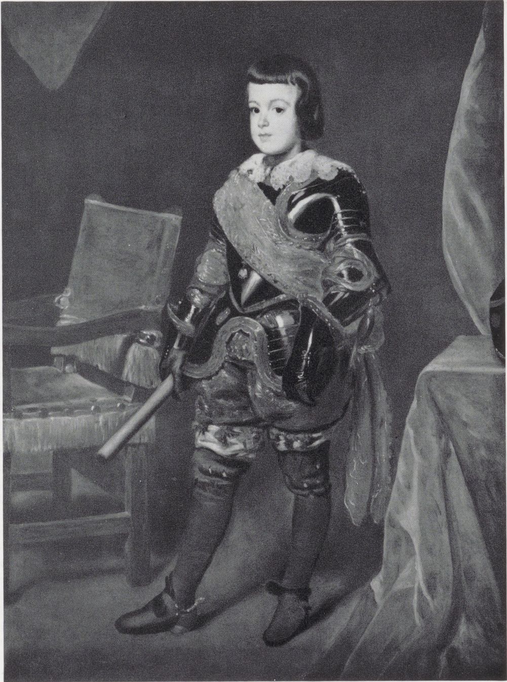
Afb. 8. J. B. M. del Mazo. De infant Balthasar Carlos. Rijksmuseum, Amsterdam.