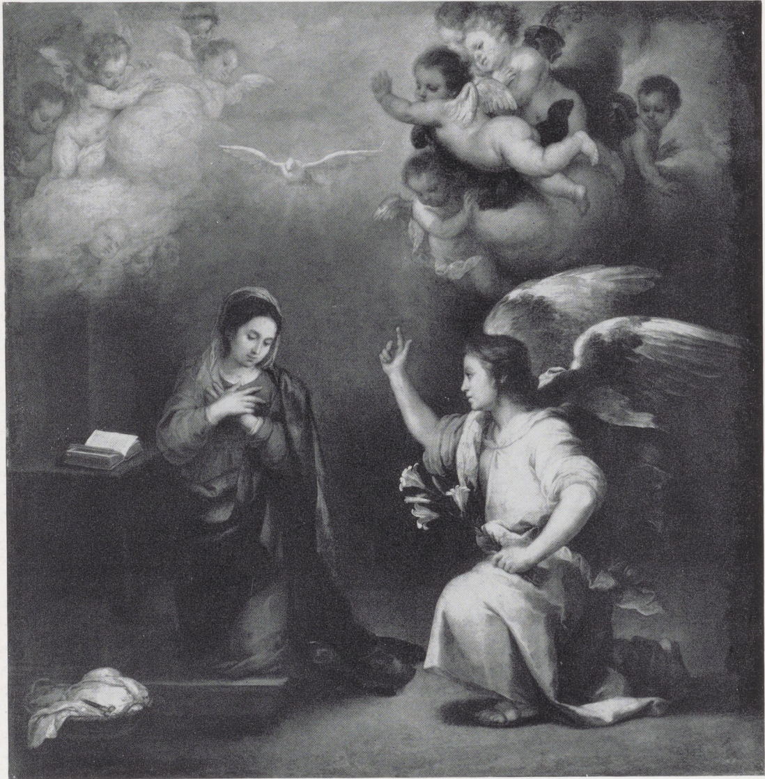
Afb. 6. B. E. Murillo. De Verkondiging. Rijksmuseum, Amsterdam.