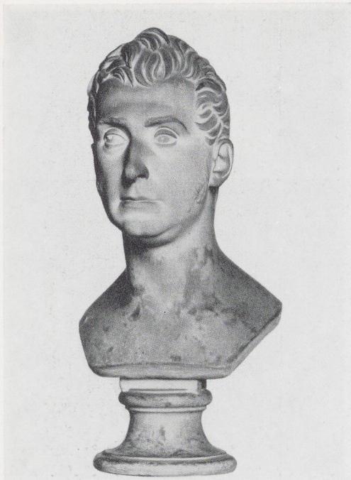
Afb. 7. B. Thorwaldsen. Portret van Graaf Edmund Bourke.

zeer grote bedrag van 100 000 (goud-) francs heel wat moeten in de aarde heeft gehad. Zou men er heden ten dage mede kunnen volstaan zulks op te dragen aan een bank, waarvan men dan binnen enkele dagen de afrekening tegemoet zou kunnen zien, in die tijd was dat lang zo eenvoudig niet. Blijkens de desbetreffende, in het Koninklijk Huisarchief aanwezige stukken werd het na enig beraad het beste geoordeeld hier te lande wissels op Parijs te kopen, waartoe men twee wisselmakelaars in de arm nam, één te Brussel en één te Antwerpen. Deze gaven aan de eerder genoemde geheime regeringsraad Hofmann te kennen dat het, gezien de grote vraag naar papier op Parijs, zaak zou zijn zonder haast te werk te gaan teneinde de cours niet na de hoogte te jagen . De totale som is dan ook geleidelijk in verscheidene wissels tot verschillende bedragen geremitteerd.