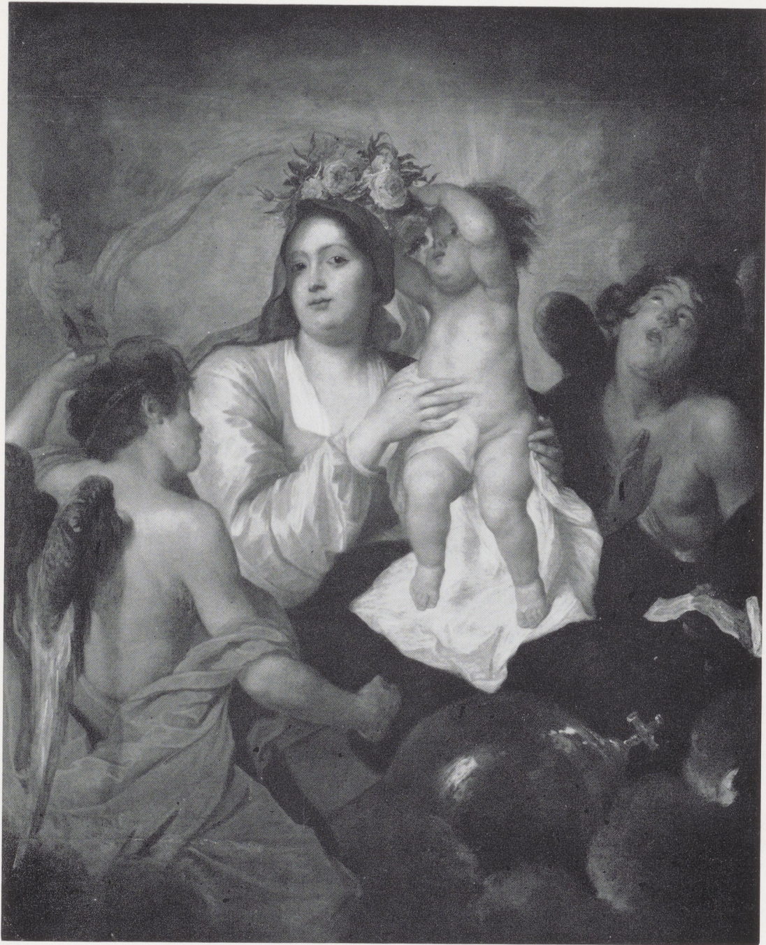
Afb. 3. J. Antolínez. De verheerlijking van de H. Maagd. Rijksmuseum, Amsterdam.