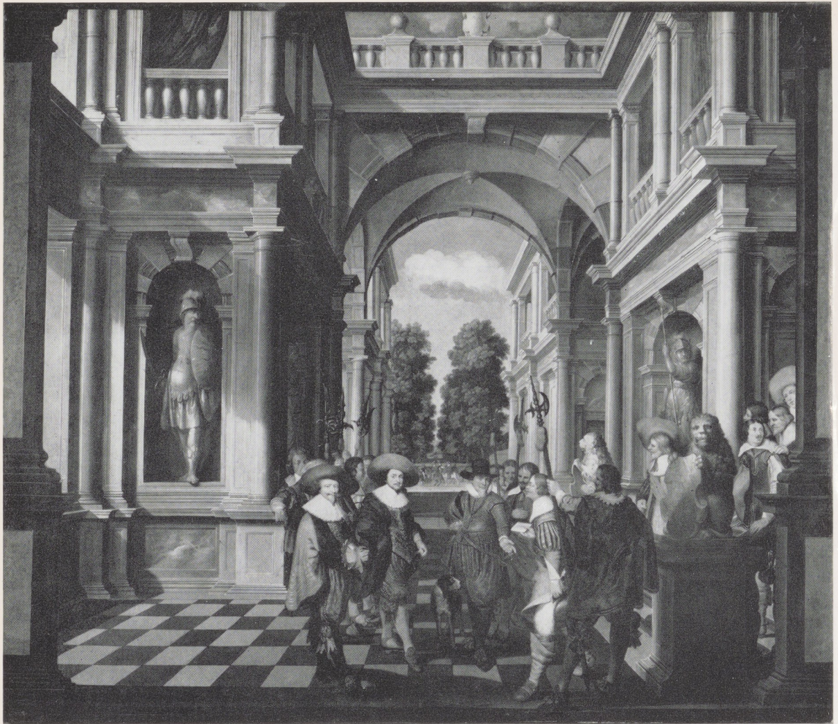
Afb. 3. Bartholomeus van Bassen (?). Deel van een kamerbeschildering, 308,5 × 349 cm. Rijksmuseum, Amsterdam.

nog moeilijker wordt zich een voorstelling van de oorspronkelijke opstelling te maken. In Vlaanderen kende men grote, met de lijsten aaneensluitende, liggend langwerpige decoratieve landschappen, als een fries geplaatst boven een hoge plint van goudleer; in onze gewesten waren zulke decoratieve reeksen, waaruit zich geheel beschilderde wanden konden ontwikkelen, echter niet in gebruik. In het tijdperk waarin deze schilderstukken werden gemaakt, vormden goudleer en Delftse of Vlaamse tapijten, overwegend verdures, nog de gebruikelijke volledige wand-