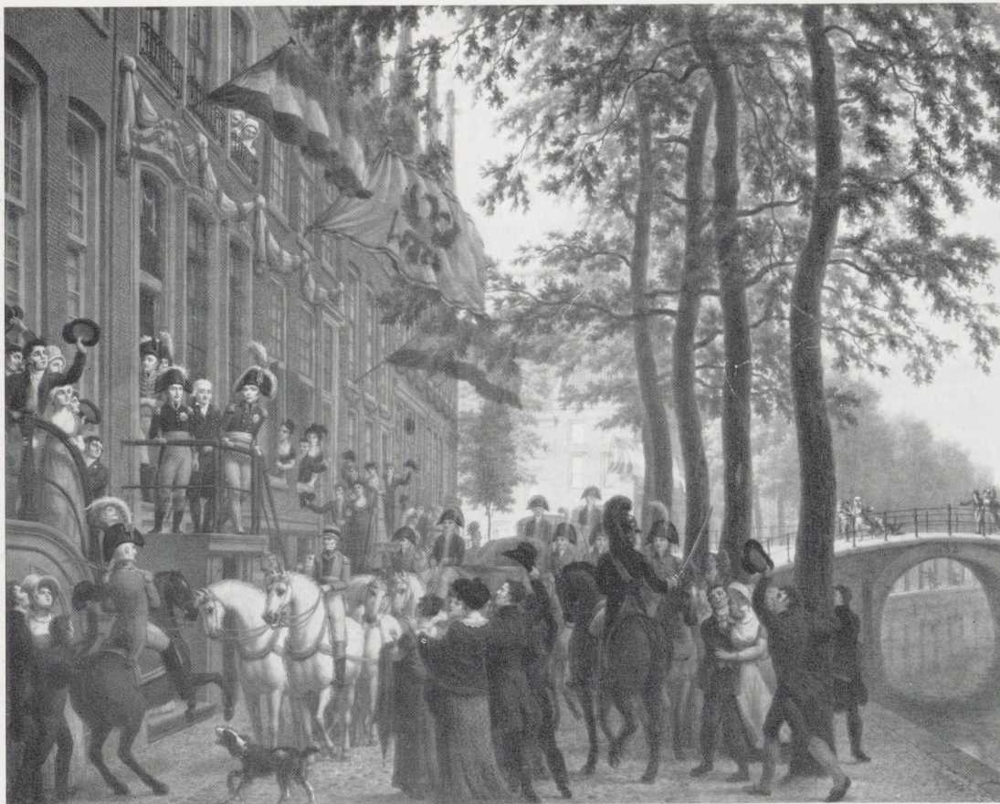
Afb. 4. Jan Kamphuysen. Het bezoek van [Alexander I aan de verzameling Brentano. Paneel, 64,5 × 80,5 cm. Stichting Brentano, Amsterdam.

zoals hij vooral in de geschiedenis voortleeft; hij heeft bij de aankopen voor het Mauritshuis en het Rijksmuseum dikwijls een beslissende stem gehad 3 en hij zal zijn gast Alexander dan ook wel met plezier hebben vergezeld.