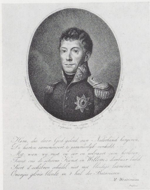
Afb. 2. W. van Senus naar H. W. Caspari. Willem I. Gravure. Rijksprentenkabinet, Amsterdam.

Alexander is in gezelschap van de soevereine vorst, die juist in 1814 sterk bepaald werd bij de Nederlandse kunstverzamelingen en wel in het bijzonder bij de Amsterdamse, toen hij bij Koninklijk Besluit bekrachtigde dat 's Lands Museum van schilderijen, oudheden, kunstwerken en penningen in Amsterdam gevestigd zou blijven. De latere koning Willem I was waarlijk niet uitsluitend de koning-koopman,