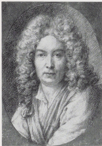
Afb. 8. HANS BURGMKMAIR (1473-1531).

De tekening is op gelijke schaal, maar spiegelbeeldig t.o.v. de zwartekunstprent door Nicolaas Verkolje van 1715 naar een schilderij door J. M. Nattier uit 1709. De gravure vertoont de kunstenaar te halven lijve in zijn werkkamer, leunend op een tafel. Het is niet zeker dat dit schilderij nog bestaat, en evenmin of Picart daarop in dezelfde richting staat afgebeeld. Daardoor is het moeilijk precies vast te stellen hoe onze tekening en Nattier's schilderij zich tot elkaar verhouden.