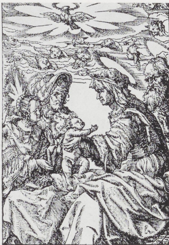
Afb. 9. FRANCISCO JOSÉ DE GOYA Y LUCIENTES (1746-1828).