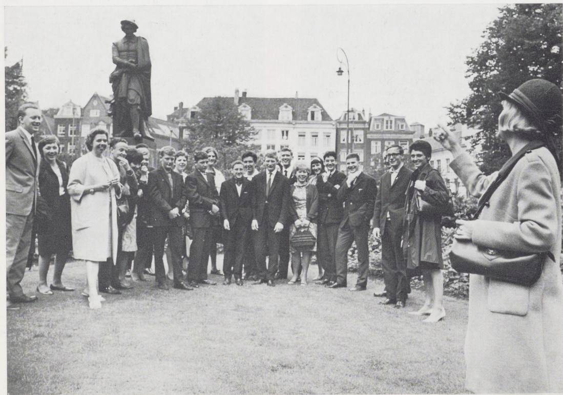
Afb. 4. 24 juli. De Belgische deelnemers aan de Rembrandttocht bij het standbeeld van de kunstenaar.