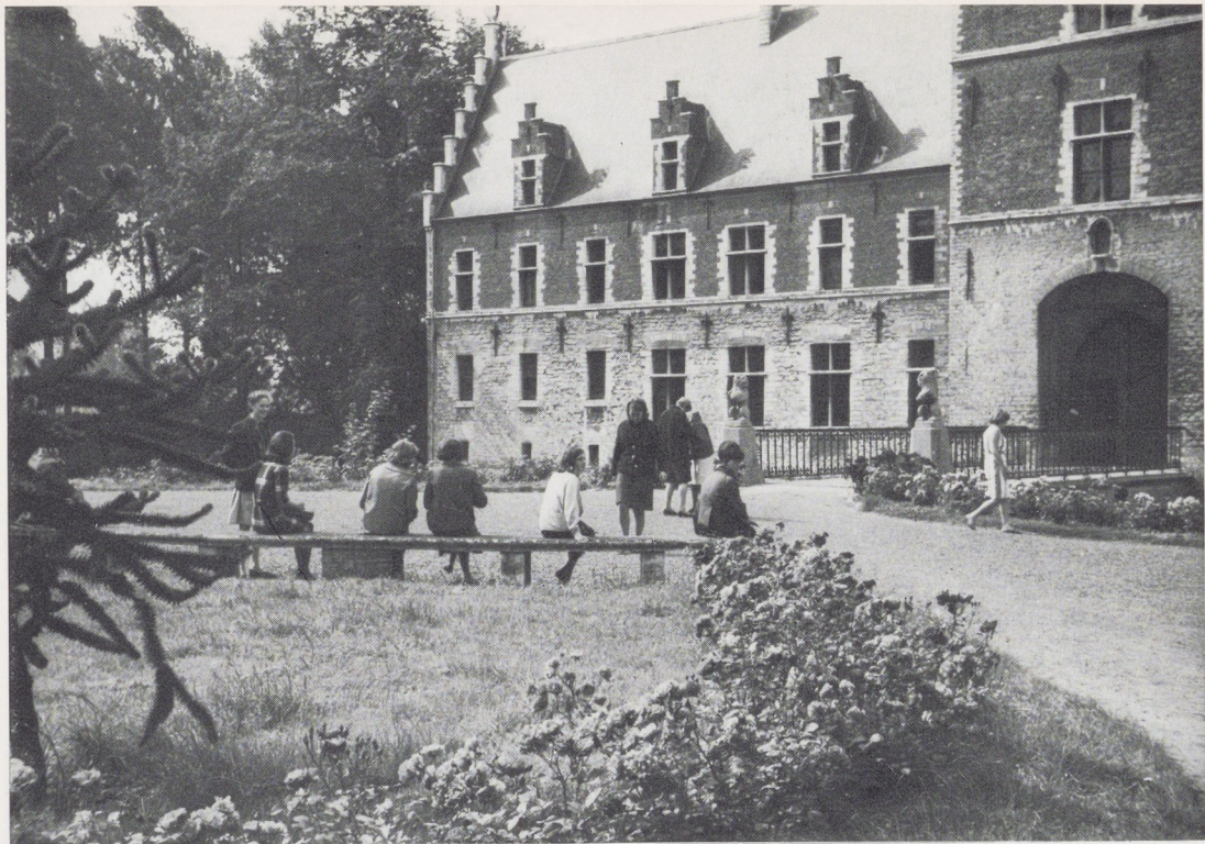
Afb. 3. 10 juli. Bezoek aan het Park en Kasteel Elewijt, certijds eigendom van Rubens.