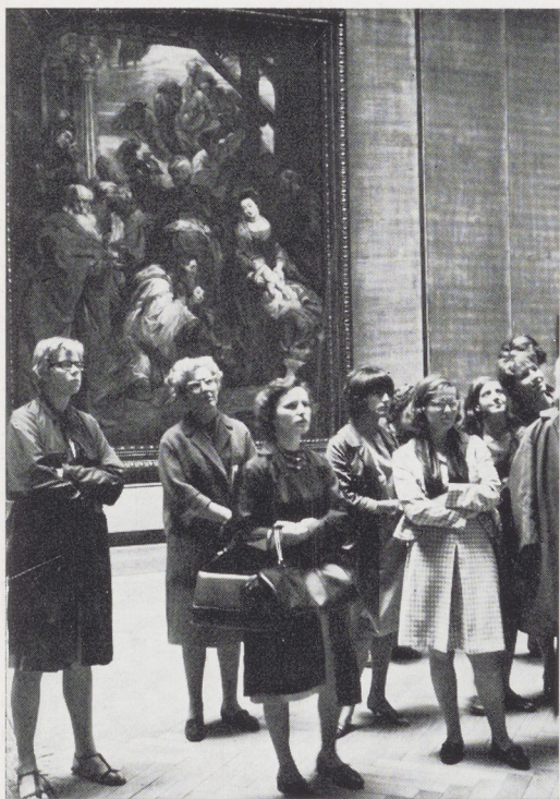
Afb. 1. 9 juli. Bezoek aan het Museum voor Schone Kunsten te Antwerpen.