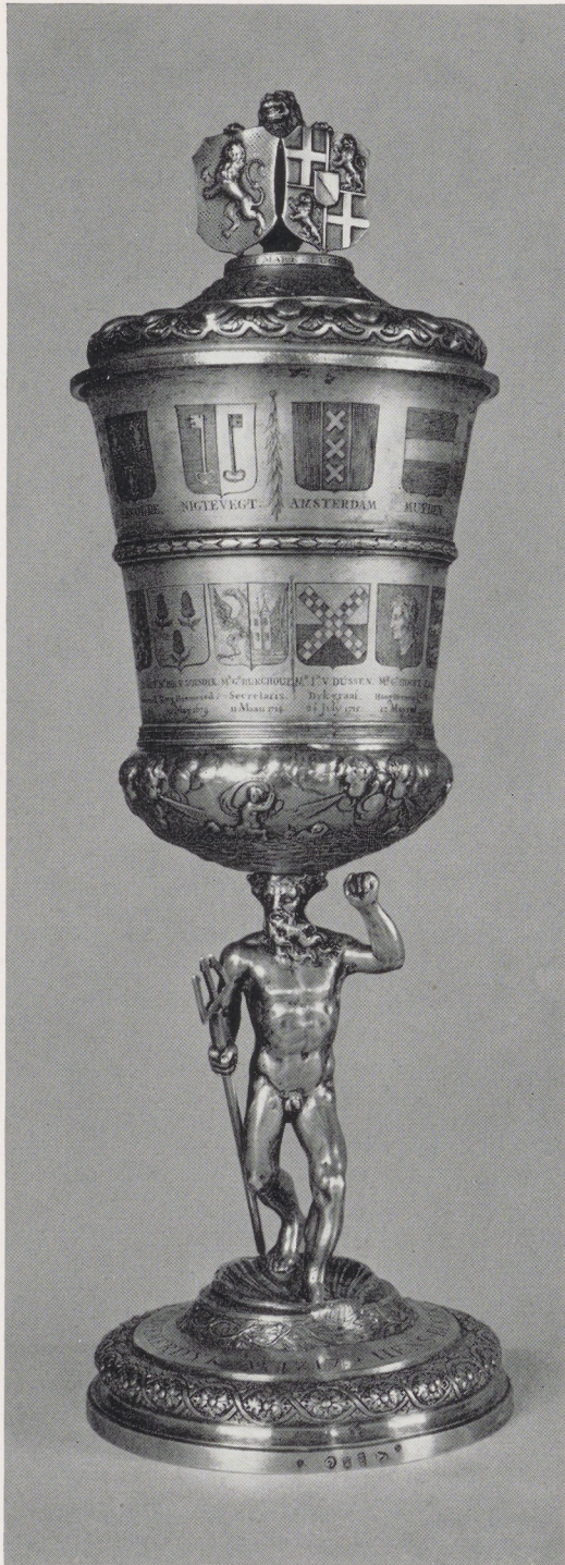
◀ Afb. 11. Hensbeker van het Hoogheemraadschap Zeeburg en Diemerdijk. Dijkhuis, Amsterdam.