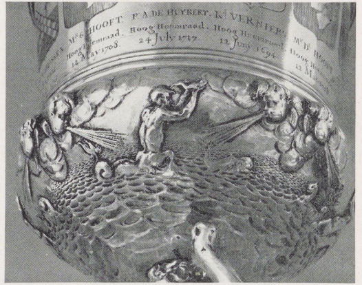
Afb. 12. Detail van afb. 11.