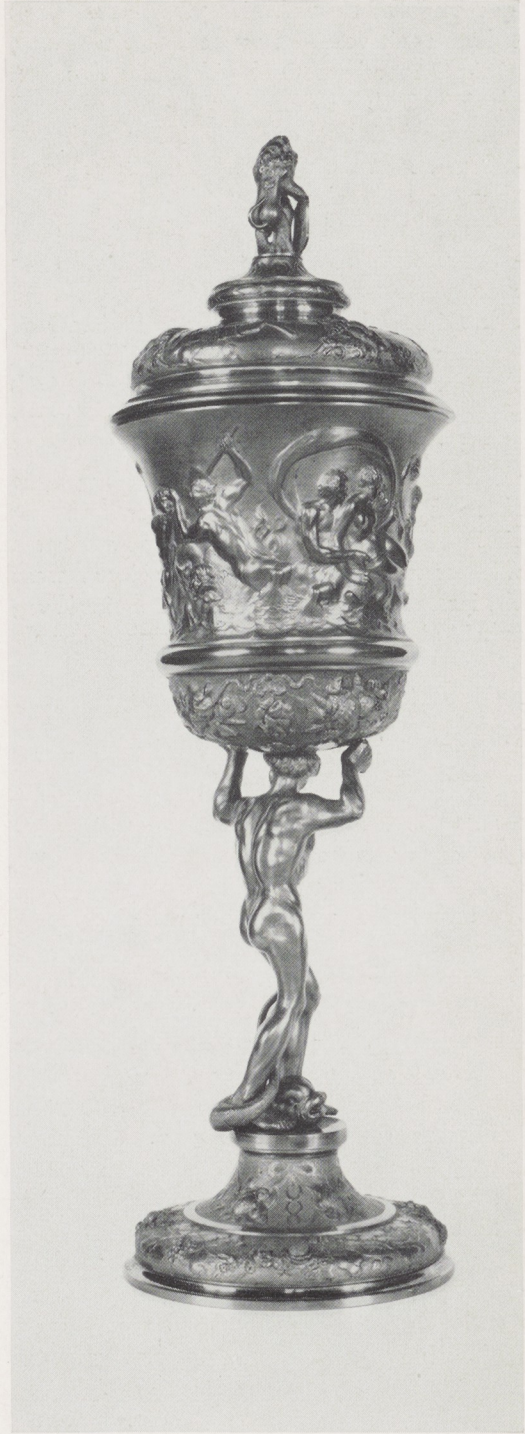
Afb. 10. Beker van Swaerdecroon. H. 45 cm. Rijksmuseum, Amsterdam.