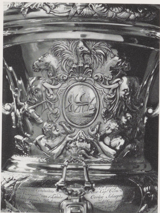
Afb. 5. Detail van voorzijde afb. 4.

door Isaac Sweers werd buitgemaakt, fraai zilver bij zich op de Royal Prince 4 .