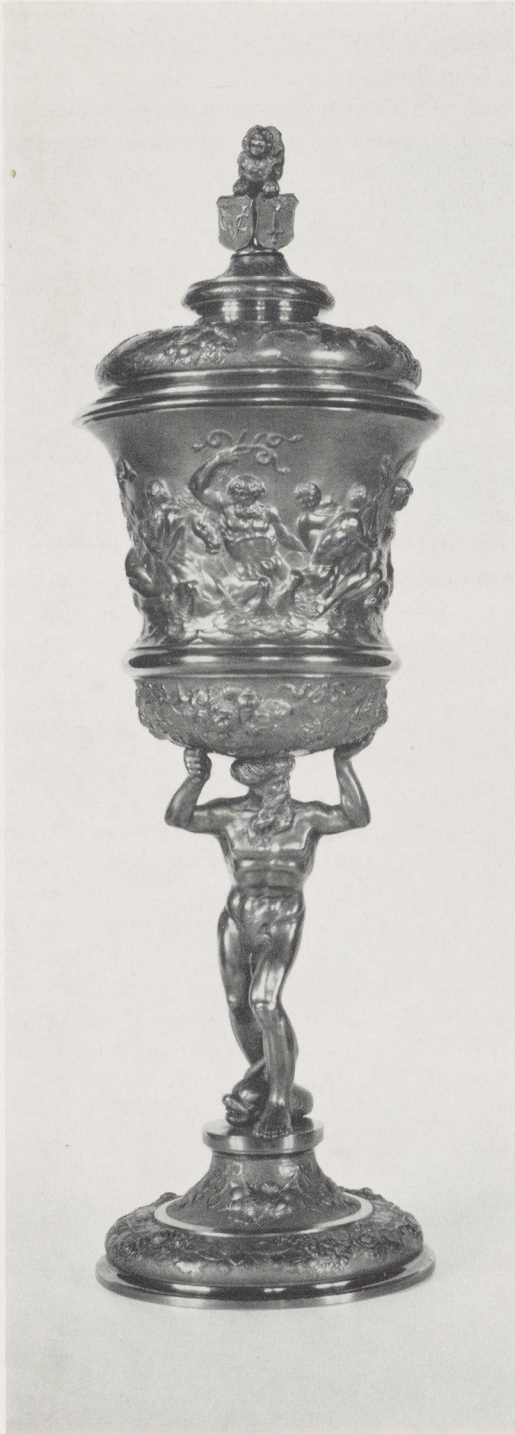
Afb. 9. Beker van Swaerdecroon. H. 45 cm. Rijksmuseum, Amsterdam.