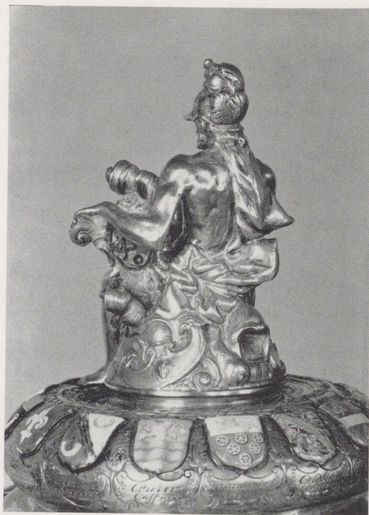
Afb. 17. Detail van afb. 15.