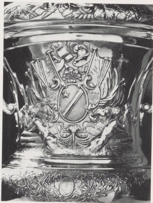
Afb. 6. Detail van achterzijde afb. 4.

De fontein dan, heeft de vorm van een tuinvaas waaraan een kraantje is bevestigd en ze werd aan Schrijver geschonken door de Oost-Indische Compagnie. In de resolutiën van de O.I.C. van 4 maart 1732 5 , vinden wij een besluit, waarin wordt gezinspeeld op een episode in de - 1715 verklaarde - oorlog met de roofstaten langs de Middellandse zee, waarvan Algiers en Marokko de gevaarlijkste waren. De Algerijnen verweten ons verzuim in de bereidheid tot loskopen van Nederlandse slaven, die tijdens 'legale' kaapvaart waren buitgemaakt. Einde mei 1730 was het kapitein Schrijver gelukt om, in opdracht van de Staten, met de Dey van Algiers een redelijke overeenkomst te sluiten. Schrijver lag op 19 juni nog in de haven toen hij opmerkte, dat er toch weer twee Compagnies-schepen werden opgebracht. Zijn woede hierover moet vreselijk zijn geweest en alleen windstilte belette hem er im-