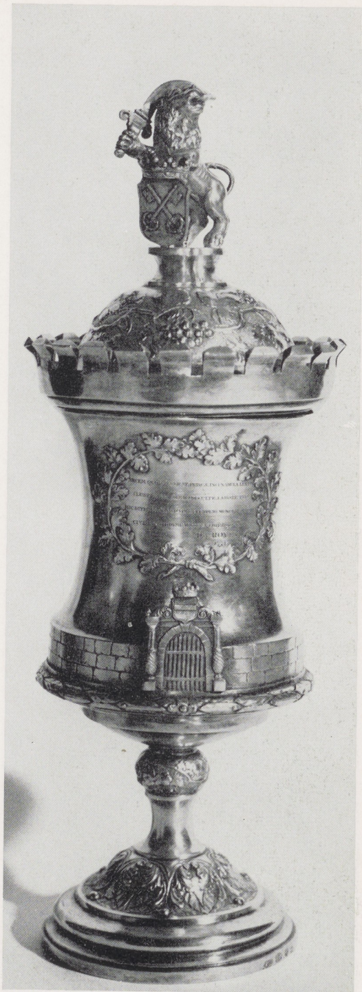
Afb. 14. Bokaal van Cornelis van Alkemade (De 'Burg'). H. 31 cm. Leiden, Sted. Mus. 'De Lakenhal'.

In dezelfde tentoonstellingscatalogus van 1880 wordt onder nr. 244 een gedreven gouden kop (afb. 13) beschreven, gemaakt van een keten, die in 1677 met penning geschonken werd aan Cornelis Tyloos. Hij was een Hollandse kapitein, die in de oorlog tussen Zweden en Denemarken voor dat laatste land gevochten had en voor zijn heldendaden door Christiaan V aldus werd beloond 17 . De penning is in tweeën gezaagd en ingelaten in de bekerwand. Een bloemrijk vers bezingt wat er in feite is geschied. 'Toen Tyloos Neerlandsch held met mannenmoed bezielt / De Sweedsche schepen hadt veroverft of vernielt / Schonk hem de Deensche Vorst tot roem voor dit gevecht / Een gouden penning aen een keeten vastgehecht / De penning ziet gij hier, de keeten is ontslaekt / Zoodat nu van dit goud dees beker is gemaakt'. Aan de keerzijde wordt de bronvermelding opgesomd: 'Zie A. Casteleijn, Holl. Merc. van 't jaar 1677 p. 170. - J. v. Loon, penningkunde 3e D. 3e B. p. 210. - Basnage, annal des Prov. Unies. Tom 2. p. 823'. Bij deze beker - in 1880 bij Dr. R. VerLoren van Themaat te Utrecht, in 1957 in de Nederlandse Kunsthandel en thans in Zweeds particulier bezit - is een kwitantie bewaard gebleven van 3 februari 1733, uitgeschreven door Jan Lanckhorst aan Cornelis Schrijver. Hoe Schrijver aan de keten is gekomen zal wel altijd een raadsel blijven. Mogelijk heeft hij hem geërfd van zijn vader, Philips, een tijdgenoot van Tyloos en evenals zijn zoon een strijdbaar zeeheld. Het is een eenvoudige beker