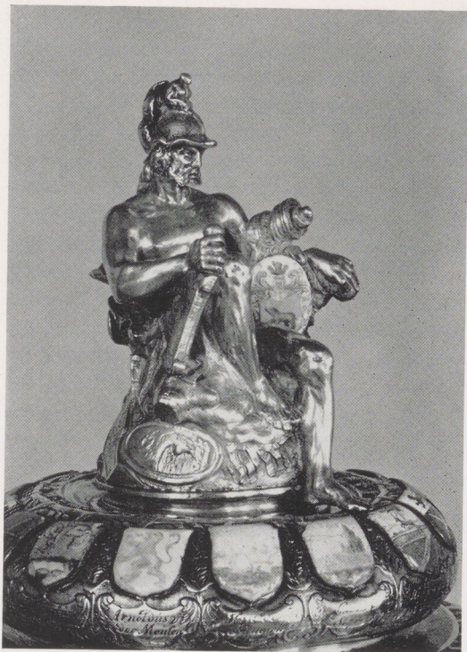
Afb. 16. Detail van afb. 15.