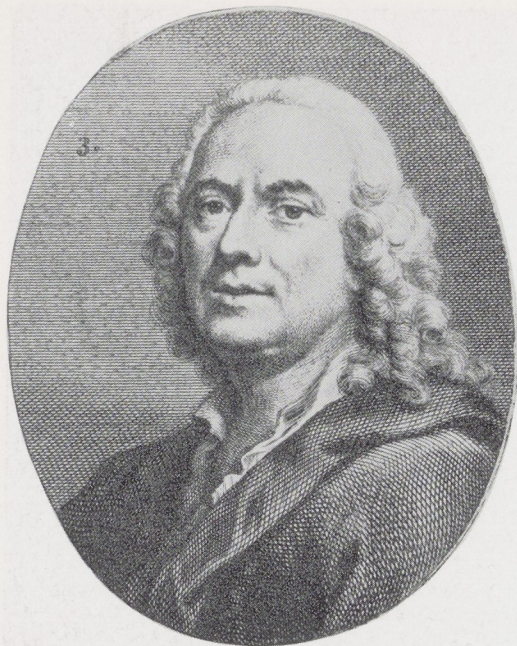
Afb. 4. P. Tanjé naar A. Schouman. Engel Sam. Gravure in Van Gool, dl. II. (detail)

de tekenstift en etsnaald beter machtig dan het penseel, ons een touchant beeld naliet van zijn jong gezin, waarvan hij de vreugden pas als goede veertiger had leren kennen.