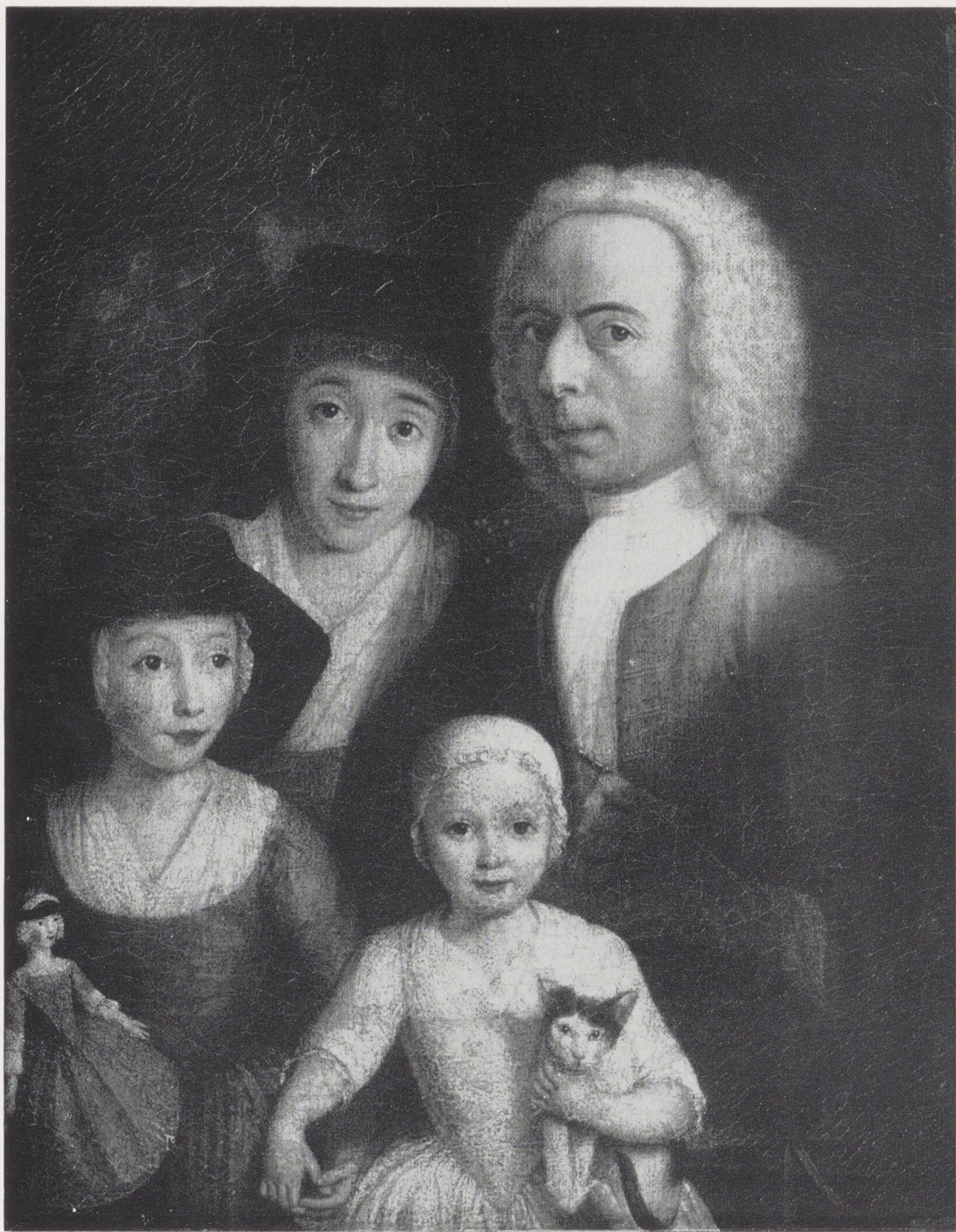
Afb. 1. H. Spilman. Zelfportret met gezin. Amsterdam, Rijksmuseum nr. 304