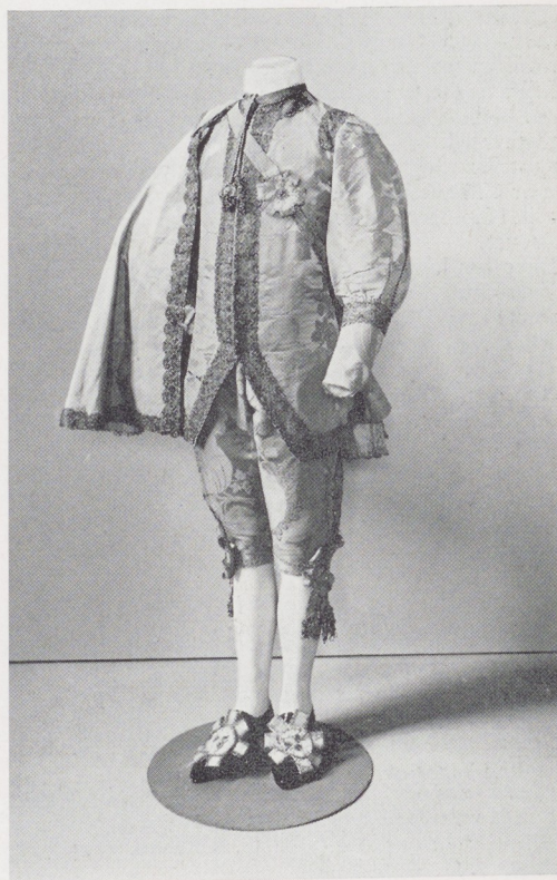
Herenverkleedcostuum, omstreeks 1770

Hoedenvoile van groene zijde van 1820 en een Empire japon van witte percale. Geschenk van de dames C. M. en Ir. A. Kam te Haarlem.