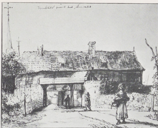
Afb. 3. De Dymbkes Poort, British Museum, Londen