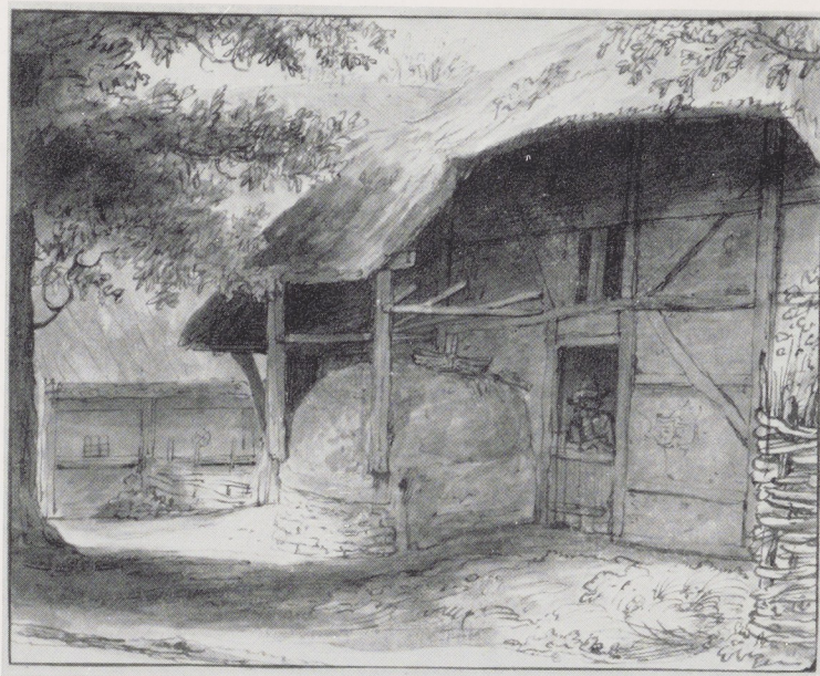
Afb. 2. Gezicht in Anrath, Rijksprentenkabinet Inv. A 3387

ook de maten geen bezwaar opleveren, deze tekeningen eveneens met Anrath in verband brengen. Zo zouden vier tekeningen gevonden zijn die wellicht in het boek Doomer-Hoff thuisbehoord hebben.