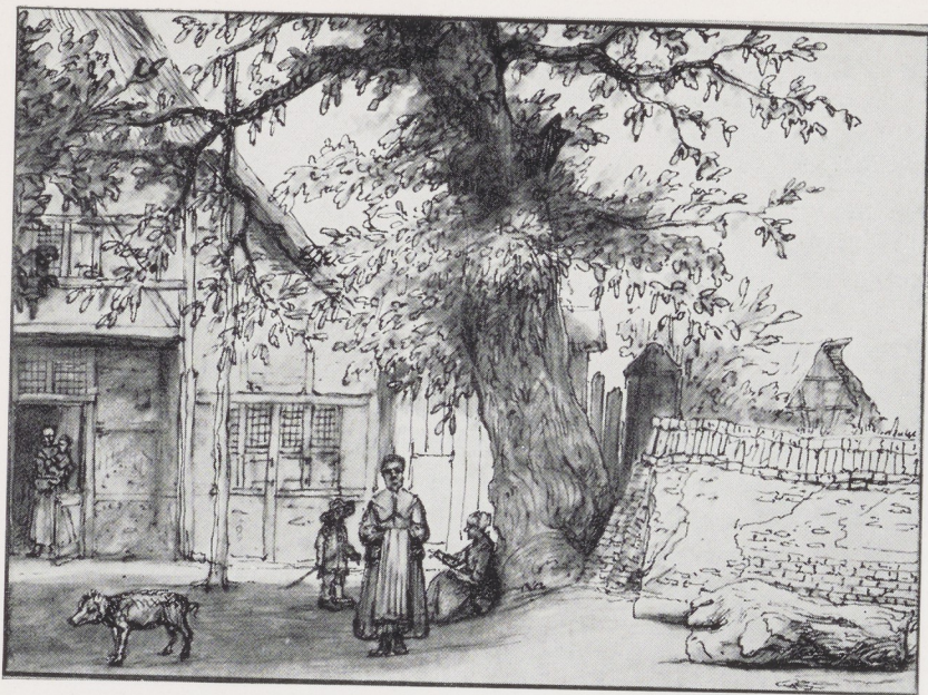
Afb. 1. De herberg 'zur blauen Hand am Kirchhof', Rijksprentenkabinet Inv. A 3530

Het bewijs voor het verblijf van Doomer in Anrath is de tekening van de Dymbkes Poort – het opschrift is eigenhandig – in het British Museum 4 . Het is een in groen-gelige toon gewassen pentekening van kleiner formaat (14,7 × 18,6 cm) dan Doomer gewoonlijk voor zijn tekeningen gebruikte (ongeveer 24 × 40 cm). Men mag hieruit zonder twijfel opmaken dat het gezicht op de Dymbkes Poort deel uitmaakte van het kunstboek Doomer-Hoff (afb. 3).