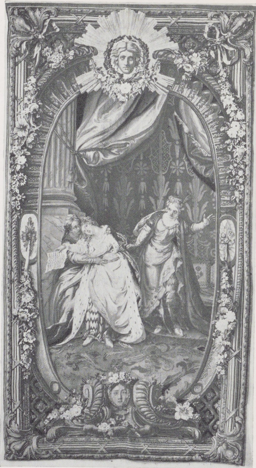
Wandtapijt met een voorstelling uit Bajazet van Racine. Ontworpen door Charles Coypel. Manufacture des Gobelins 1776

Servet van linnen damast met Belgrado en Themes-