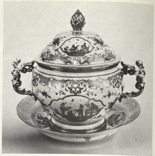
Terrine met deksel en onderschotel. Wenen, Du Paquier, omstreeks 1735

Twee bordjes, het plat beschilderd in blauw met een wapen en de rand met bloemen en vogels. Delft, Adrianus Kocx, Plateelbakkerij 'De Grieksche A', 4de kwart XVIIe eeuw.