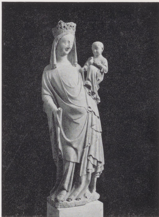
Madonna met kind. Frans. Midden XIVE eeuw. Kalksteen