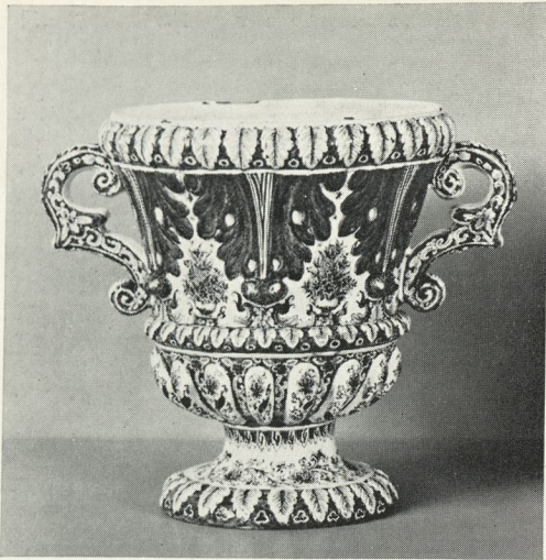
Eén van een paar tuinvazen. Delft, Lambertus van Eenhoorn of Louwijs Fictoor, begin XVIIIe eeuw