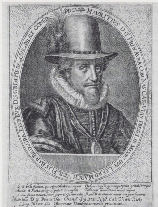
Afb. 17. Crispijn de Passe de Oude, Prins Maurits.

familie de Passe gemaakt, zoals op Fr. 714, die misschien ook door Willem gemaakt is en Fr. 717 die voorkomt in de Maneige Royal door A. de Pluvinel, verschenen in 1623. Voor deze prent komen zowel Willem als Crispijn de Jonge in aanmerking. Een tegenzijdige kopie uit 1624 is door Willem gemaakt (Hind II, pl. 178).