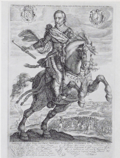
Afb. 16. Crispijn de Passe de Oude, Gustaaf Adolf aan de Oder, 1631.

zwakkere navolging door een onbekende graveur komt voor in: Robert Dallington, Aphorismes civil and militaire , 1613 3 . Waarschijnlijk was het voorbeeld voor de gravure van Simon de Passe het door Robert Peake geschilderde portret, thans in de University Library, Cambridge, eveneens 1613 gedateerd 4 .