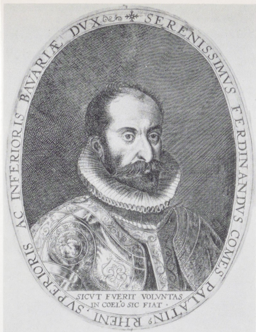
Afb. 8. Crispijn de Passe de Oude, Ferdinand van Beieren.