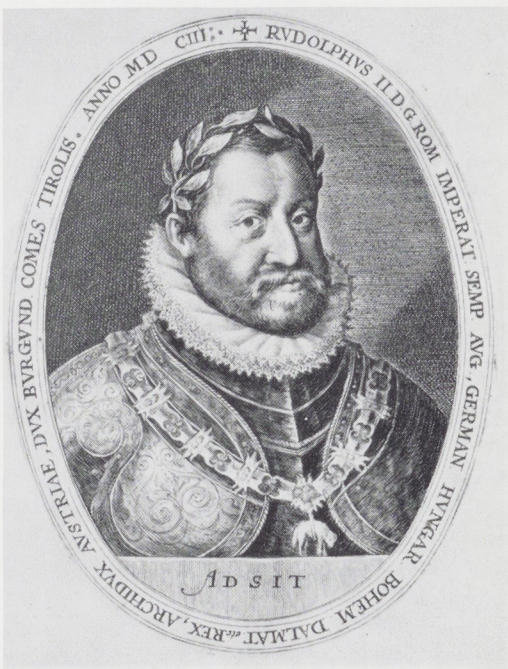
Afb. 11. Crispijn de Passe de Oude, Keizer Rudolph II, 2e staat, 1603.