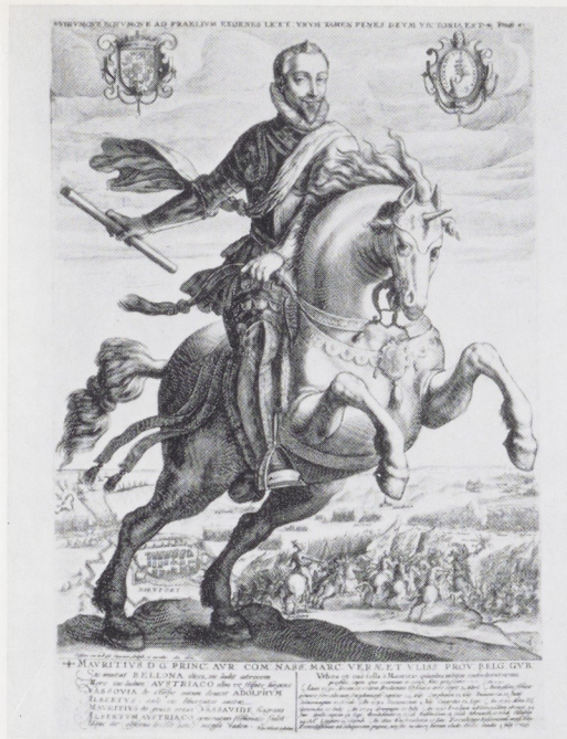
Afb. 15. Crispijn de Passe de Oude, Maurits in de Slag bij Nieuwpoort, 1600.