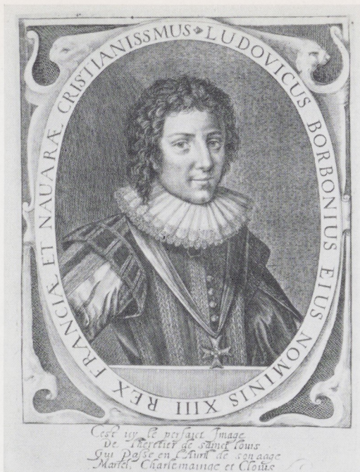
Afb. 4. Willem de Passe, Koning Lodewijk XIII van Frankrijk, 1e staat.