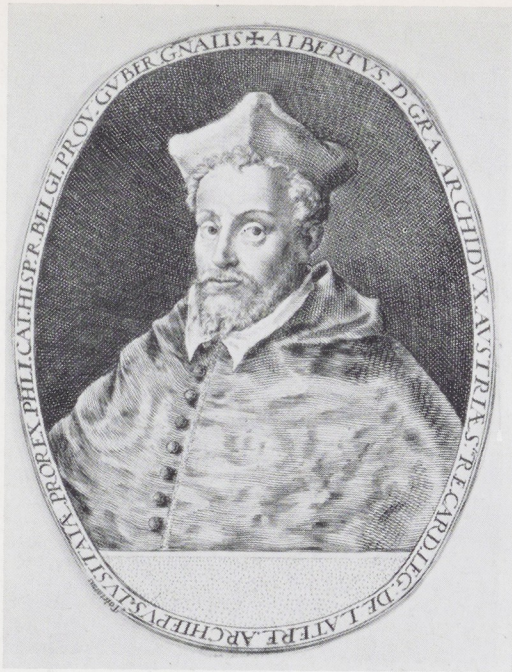
Afb. 12. Crispijn de Passe de Oude, Albertus van Oostenrijk, 1e staat.