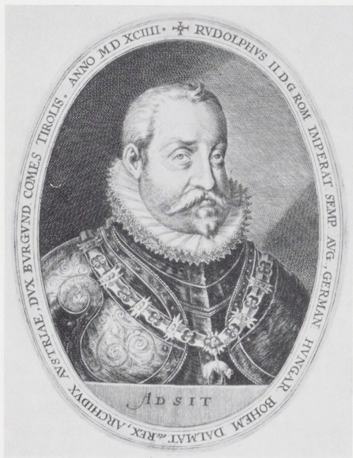
Afb. 10. Crispijn de Passe de Oude, Keizer Rudolph II, 1e staat, 1594.