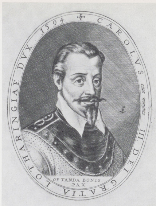
Afb. 9. Crispijn de Passe de Oude, Karel II van Lotharingen, 1594.