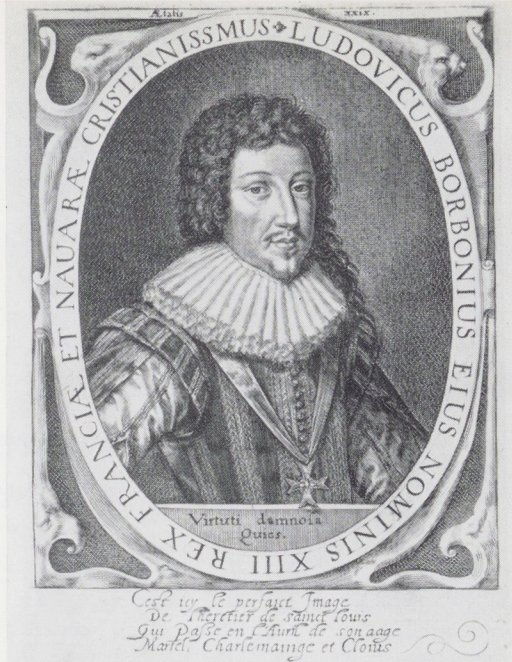
Afb. 5. Willem de Passe, Koning Lodewijk XIII, 2e staat.