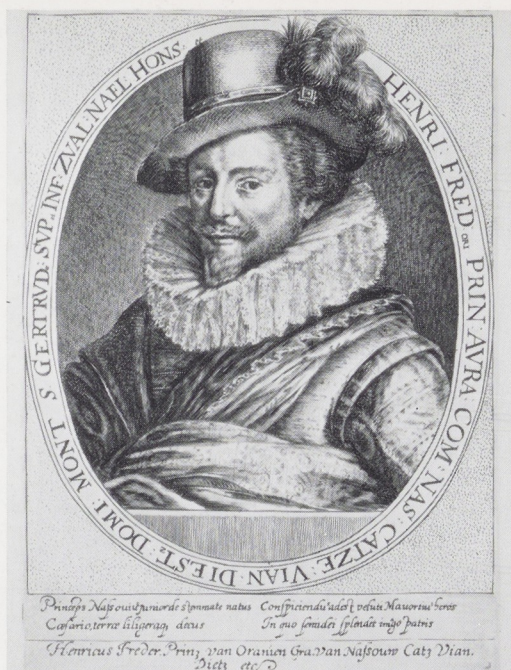
Afb. 18. Crispijn de Passe de Oude, Prins Frederik Hendrik.

De vroegste prenten zijn nogal stijf en wat de gezichten betreft nogal grof en ongenueanceerd. In latere jaren heeft Crispijn zijn platen zo bijgewerkt, dat de voorgestelde er ouder op leek en de gelaatsuitdrukkingen zijn dan ook veel boeiender