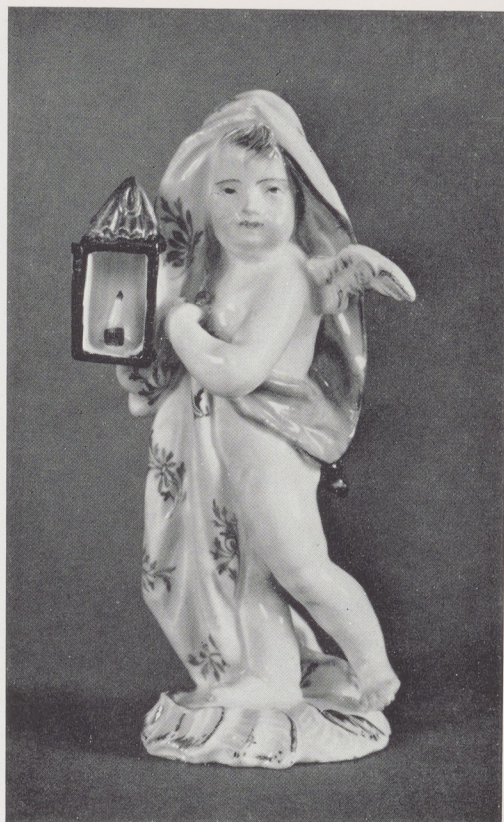
Afb. 3. Putto, Meissen, tussen 1749 en 1752. H. 9,7 cm (detail van afb. 2).

De Meissner putti waren zeer geliefd en we zien dan ook spoedig, bijv. in de fabriek van Wegely te Berlijn (vóór 1757) 2 , copieën en varianten ontstaan. Ook van de putto met lantaarn is zo'n