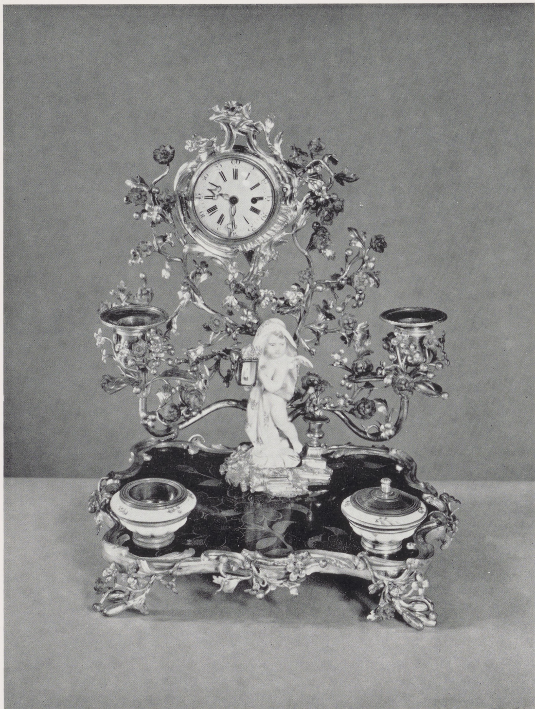
Afb. 2. Inktstel met klok van verguld brons, Frans, omstreeks 1750. H. 28 cm.