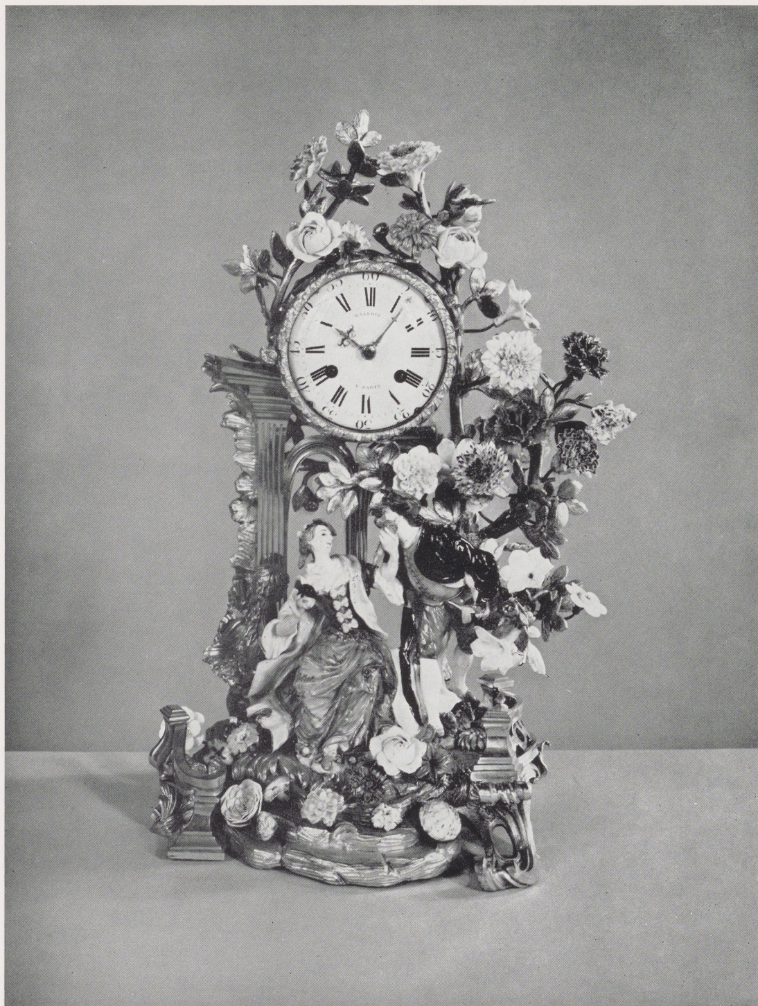
Afb. 6. Pendule, Frans, omstreeks 1750. H. 42,5 cm. Groep van Colombine en Pantalone, Meissen, model van J. J. Kändler, 1741. H. 16,5 cm.