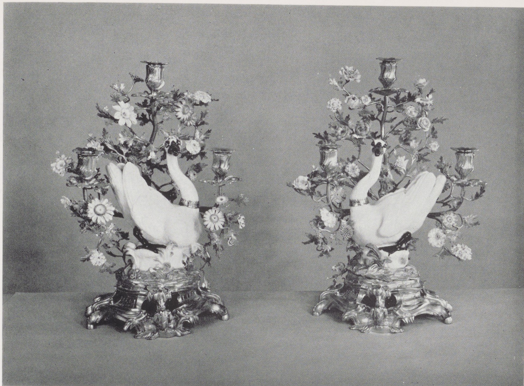
Afb. 5. Twee drie-armige kandelaars van verguld brons, Frans, omstreeks 1750. H. 43 cm. Zwanen, Meissen, model van J. J. Kändler, 1748. H. 22 cm.

gebrek aan archiefmateriaal 'vóór 1764' dateerde 1 . In 1765/66 vermeldt het fabrieksarchief correcties en reparaties aan een deel van de figuren 2 . Een bewijs dat ze vroeger gedateerd moeten worden, bracht reeds Honey door aan te tonen dat ze reeds vóór 1756 in Chelsea gecopieerd zijn 3 . Het grootste deel van het orkest (19 van de 25) is dus tussen 1749 en 1753 ontstaan; vermoedelijk ook reeds de dirigent, daar Mme de Pompadour tegelijkertijd een lessenaar verwerft. Vermeldenswaard is nog het verschil in prijs tussen de putti en de apen, nl. resp. 18 l., 14 s. en 23 l. per stuk. In januari 1752 verkoopt Duvaux 'un éléphant de porcelaine de Saxe portant une figure, 216 l.' (J. nr. 1007). Bedoeld is zeer waarschijnlijk de olifant waarop een Pers en een Moor zitten, door