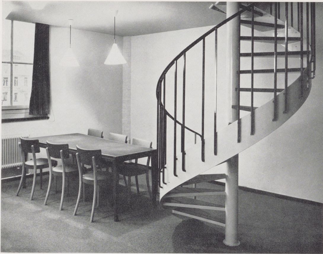
Afb. 3. Gedeelte van de lees- en studiezaal.

Luykenstraat omgetoverd in een zaal voor lezingen, projectie en tentoonstellingen, ten behoeve van het middelbaar onderwijs, waar ruim 60 scholieren tegelijkertijd een plaats kunnen vinden. Bovendien is er een kleine handbibliotheek ondergebracht, waar docenten, kweekelingen en scholieren zich kunnen verdiepen in kunsthistorische literatuur en afbeeldingenmateriaal. Mochten de aanwezige boeken niet toereikend zijn, dan is er altijd de mogelijkheid een of meer boeken aan te vragen uit de grote bibliotheek van het museum. De mogelijkheden die deze nieuwe ruimten bieden zijn zo talrijk, dat het voorbarig zou zijn nu