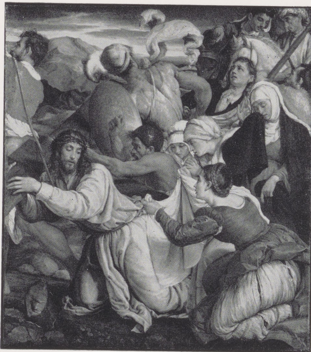
Jacopo Bassano, de Kruisdraging