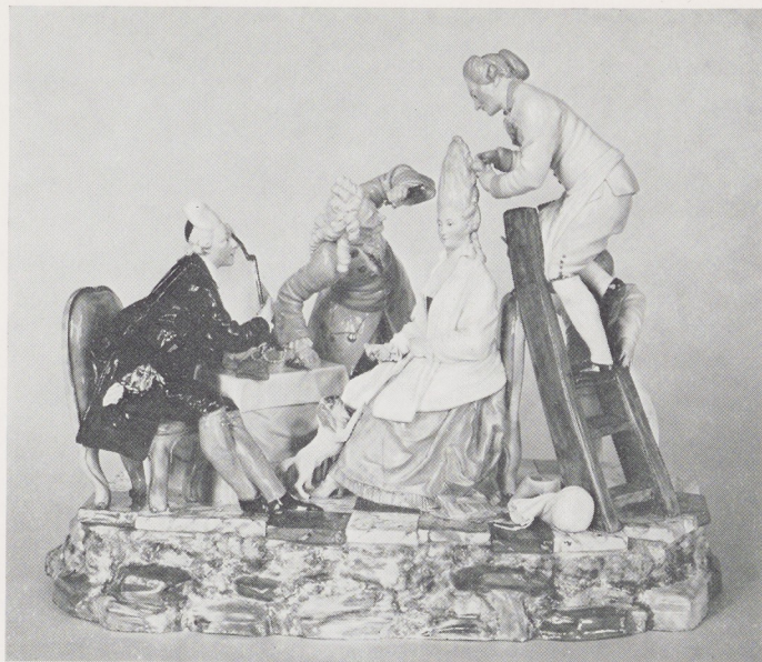
Groep voorstellende een satyre op de hoge haardracht van de vrouw. Höchst, omstreeks 1775

Twee kelkglazen met een randversiering, bestaande uit bandwerk met cartouches, waarin voorstellingen betreffende huwelijk en vruchtbaarheid. Drilwerk in de manier van Jacob Sang.