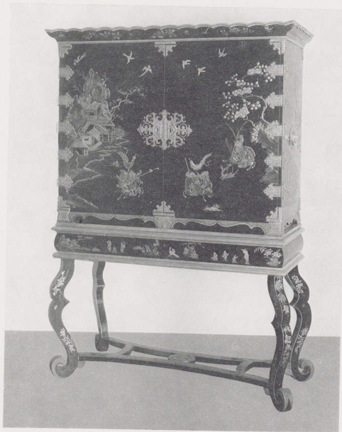
Kast versierd met lakwerk. Toegeschreven aan Gerard Dagly, 1ste kwart XVIIIe eeuw.

Brisé-waaier van ivoor met Vernis Martin-beschildering. Nederlands?, midden XVIIIe eeuw.