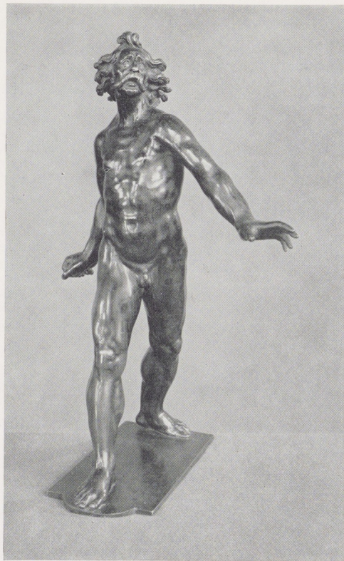
Naakte mannefiguur, brons. Nederlands?, omstreeks 1600.

Athena lezend in een boek, door Eros bijgelicht, brons. Omgeving Jan Gregor van der Schardt, einde XVIe eeuw.